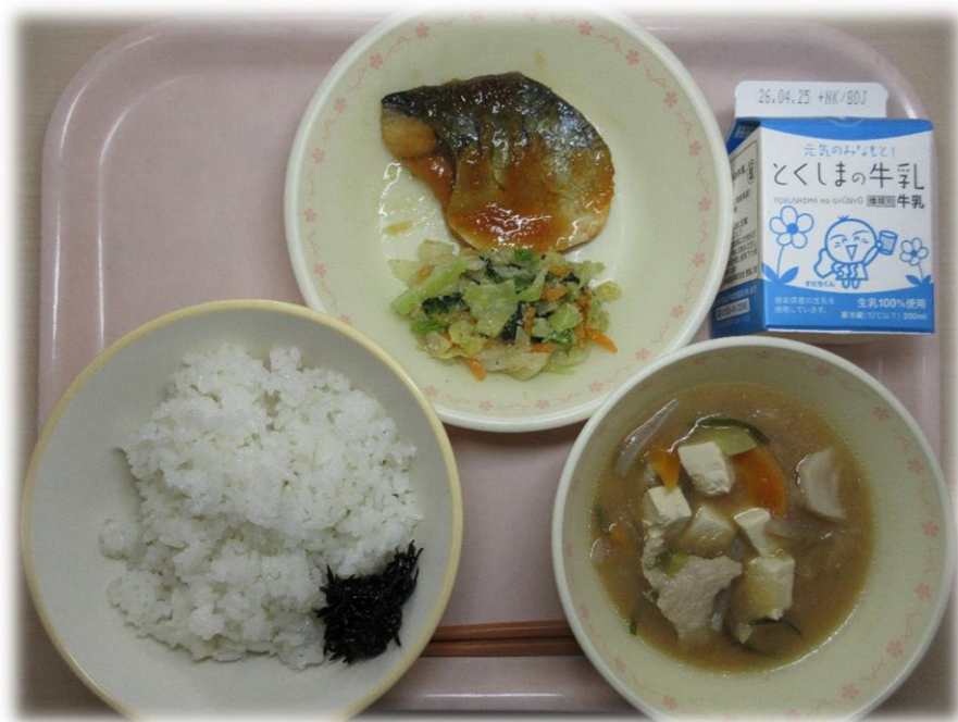
4月13日(月) ごはん ごまあえ とん汁 さばのすだちおろしあんかけ しそひじき 牛乳