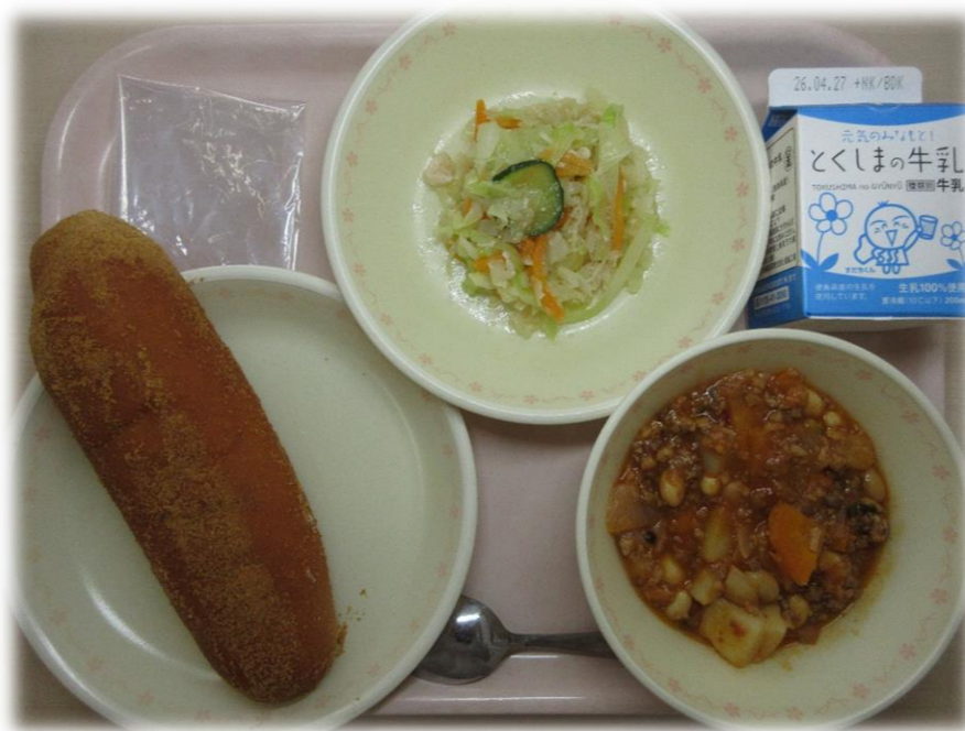
4月14日(火) きなこあげパン ちゅうかサラダ チリコンカン 牛乳