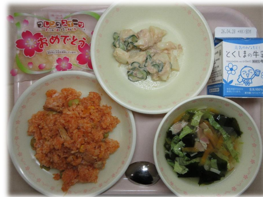
4月15日(水) チキンライス ジャがいもサラダ レタスのコンソメスープ おいわいいちごクレープ 牛乳