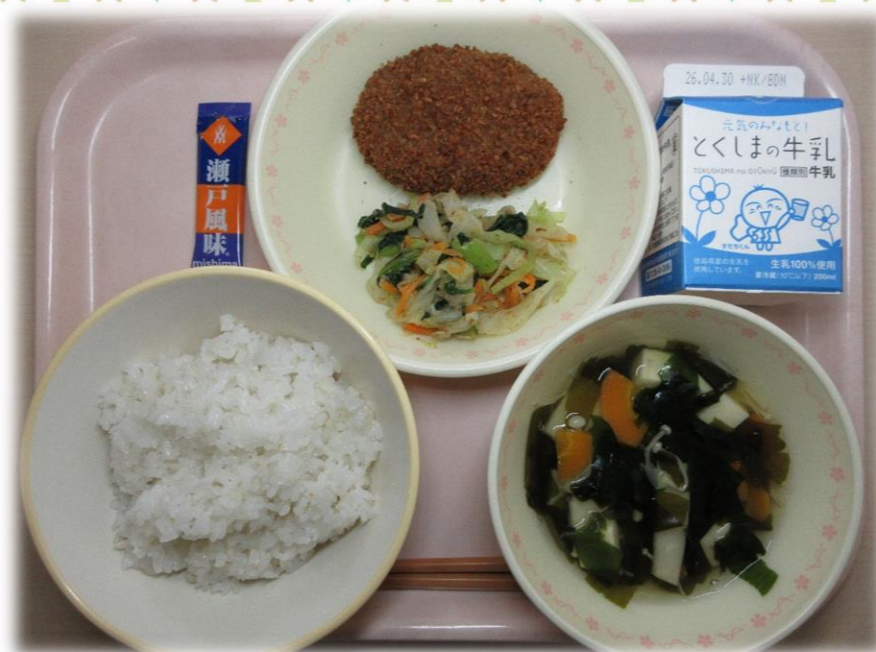
4月17日(金) ごはん 焼きメンチカツ とさあえ 若竹汁 ふりかけ 牛乳