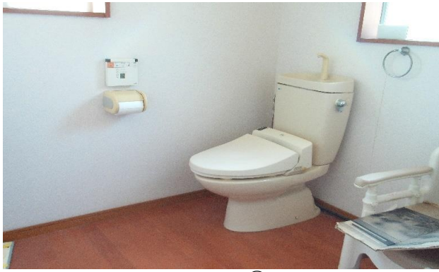
1F トイレ ⑧