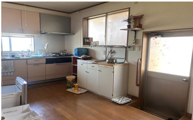
1F 台所 ⑪ (2)