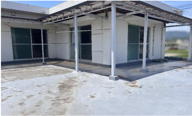
2F バルコニー ⑯