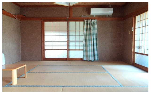
1F 和室 ⑤