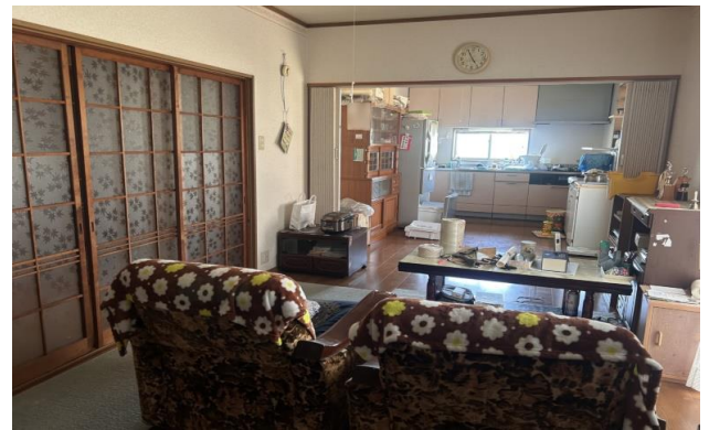
1F ⑩ ⑪