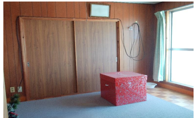
2F 洋室 ⑬