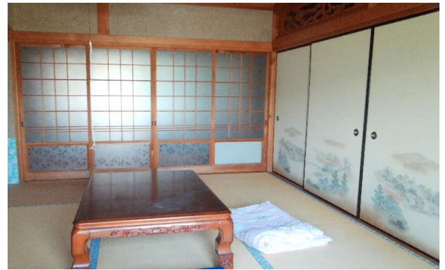
1F 和室 ③