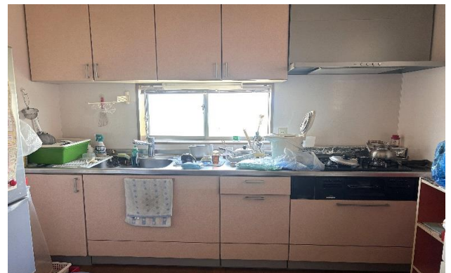
1F 台所 ⑪ (1)