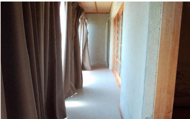
1F 廊下 ④