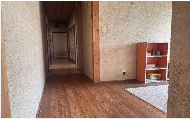
1F 廊下 ②