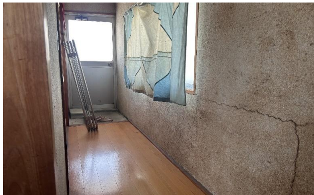
2F 廊下 ⑫