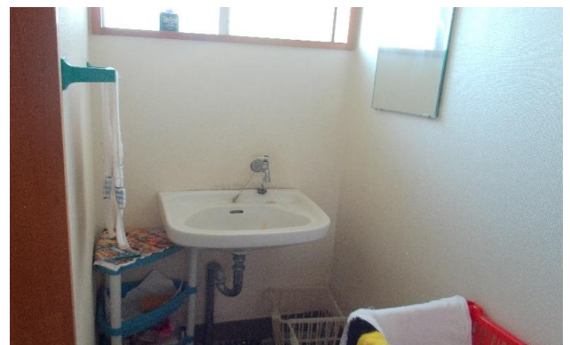
1F 洗面所 ⑦