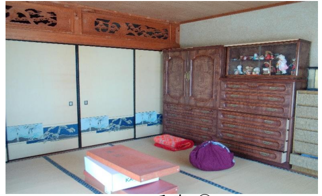
2F 和室 ⑮