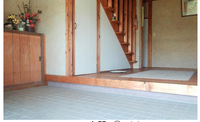
1F 玄関 ① (2)