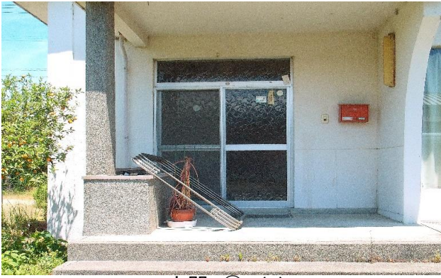
1F 玄関 ① (1)