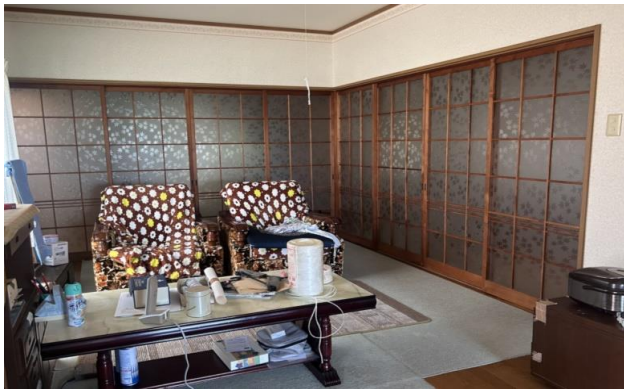
1F 洋室 ⑩