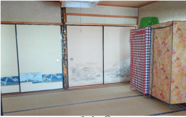
2F 和室 ⑭