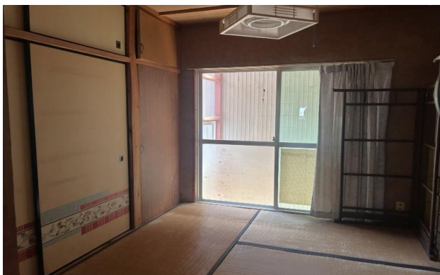
1F 和室 ⑥