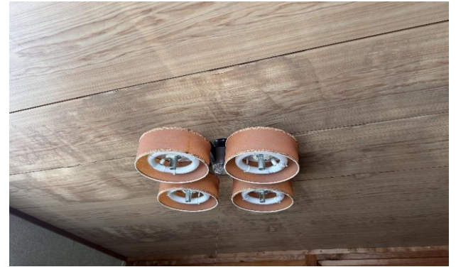
2F 和室 ⑮ 雨漏り跡