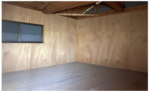
納屋 2F ⑰