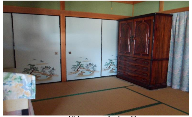
離れ 1F 和室 ⑮