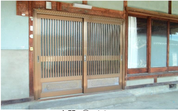
玄関 ① (1)