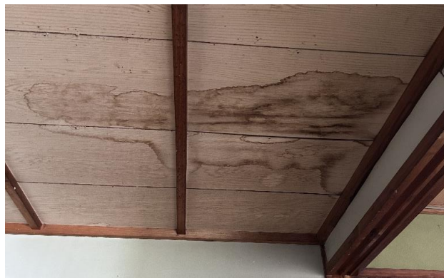
⑬ 天井 雨漏り