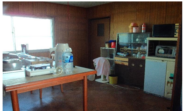
台所 ⑭ (2)