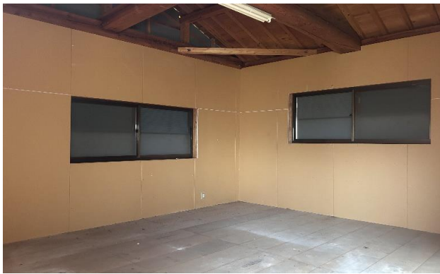
納屋 2F ⑯