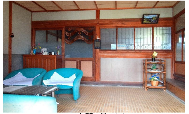
玄関 ① (2)