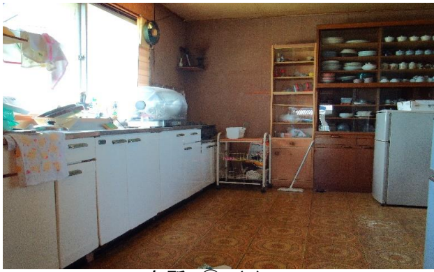
台所 ⑭ (3)