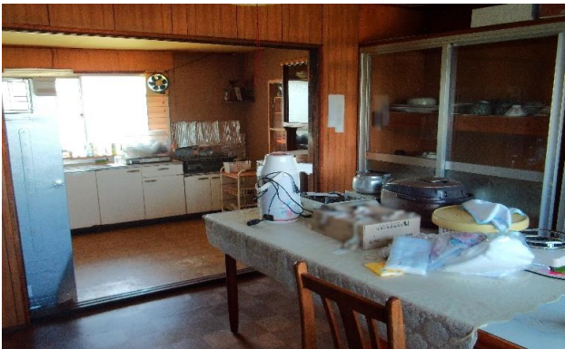
台所 ⑭ (1)