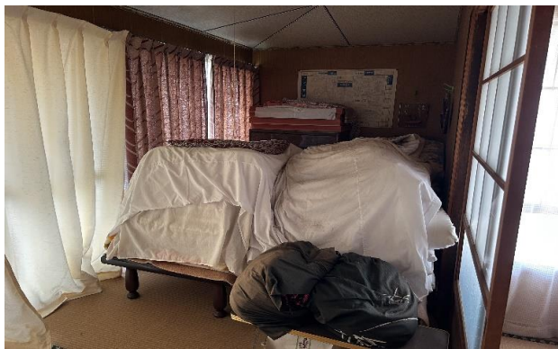
1F 和室 ④