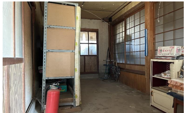
1F 土間 ⑫