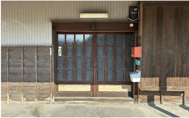
1F 玄関 ① (1)