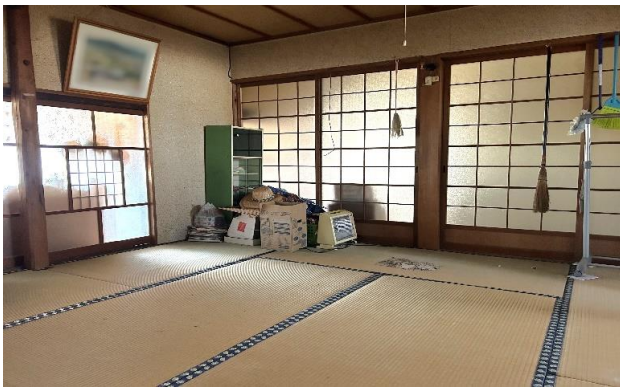
1F 和室 ⑪