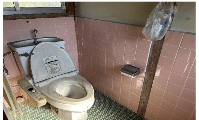
1F トイレ ⑥ (2)