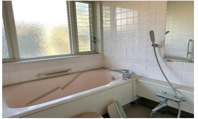
1F 風呂 ⑩