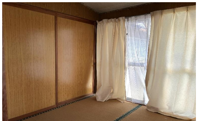
1F 和室 ⑤