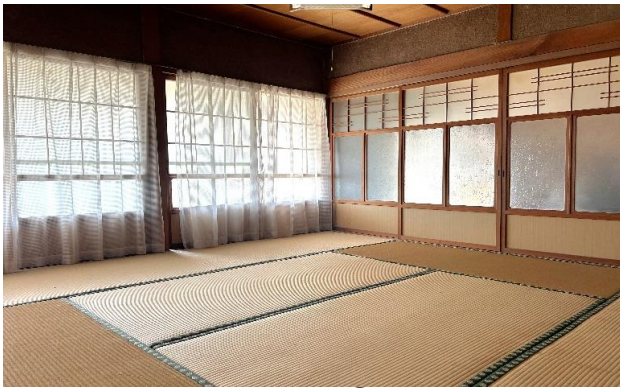
1F 和室 ②