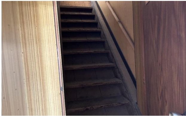
納屋 1F 階段