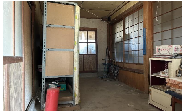
1F 土間 ⑫