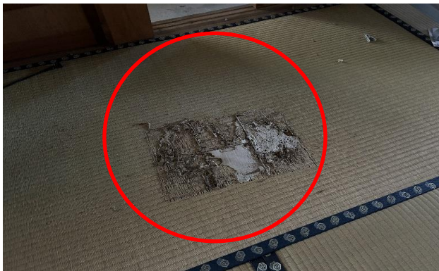
1F 和室 ⑪ 畳