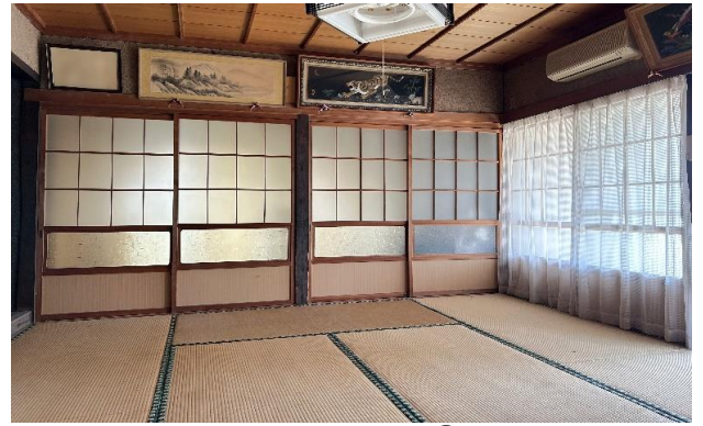
1F 和室 ③