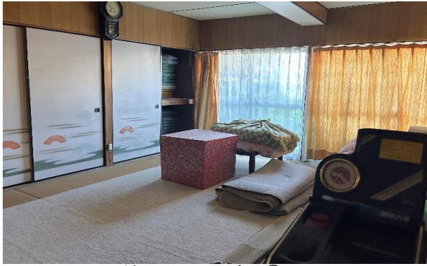
納屋 1F 和室 ⑭