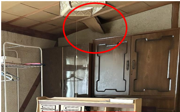
1F 和室 ⑧ 天井