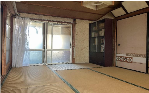
1F 和室 ⑨