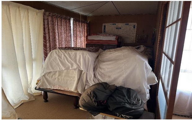
1F 和室 ④