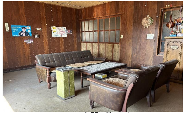
1F 玄関 ① (2)