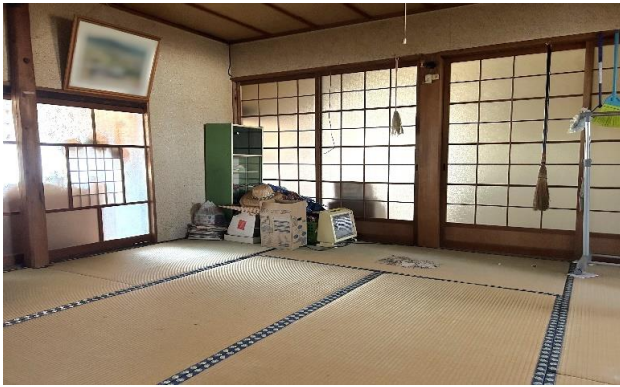
1F 和室 ⑪