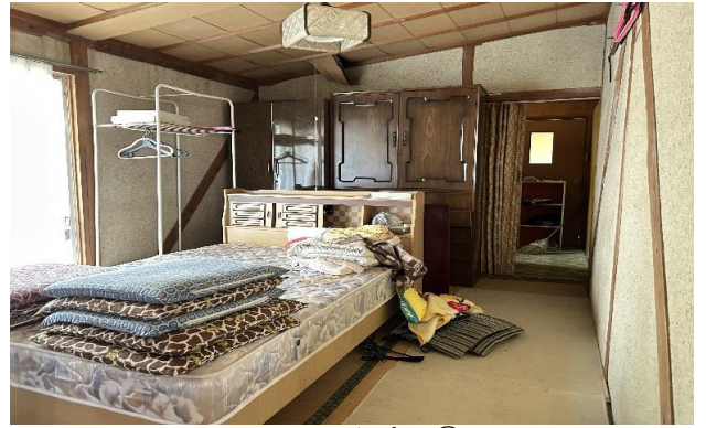
1F 和室 ⑧