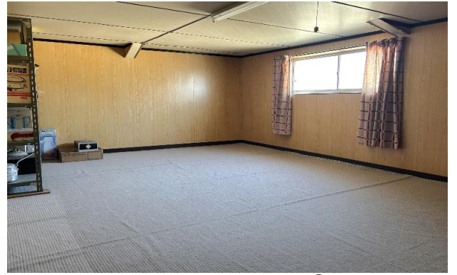
納屋 2F 洋室 ⑯