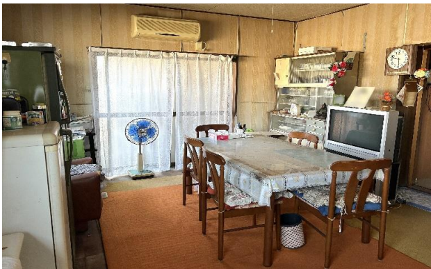
1F 台所 ⑬ (1)