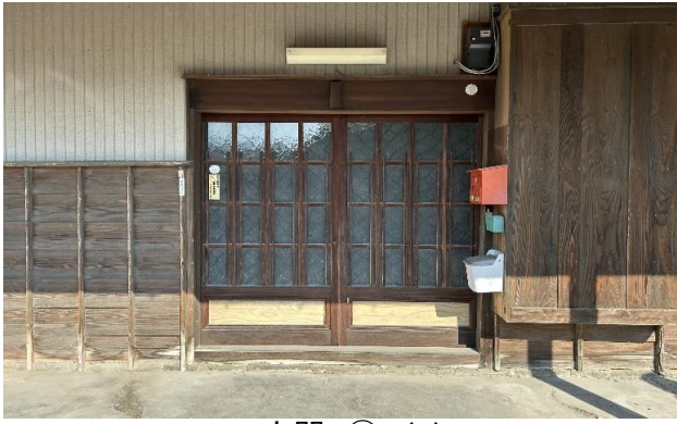
1F 玄関 ① (1)