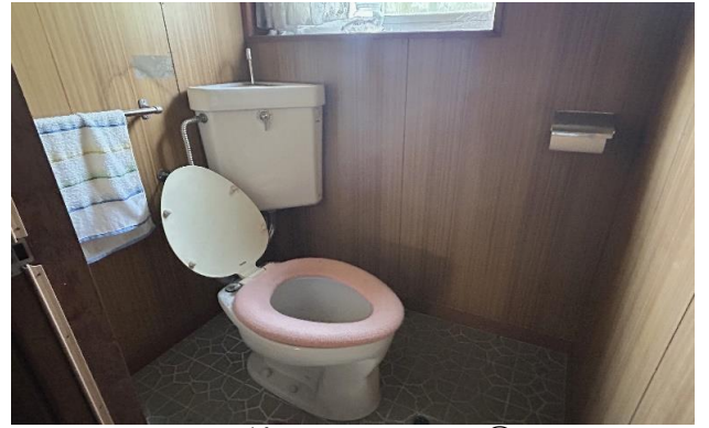
納屋 1F トイレ ⑮