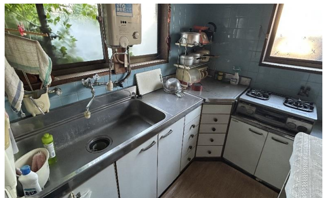
1F 台所 ⑬ (2)