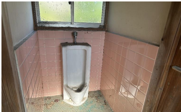
1F トイレ ⑥ (1)