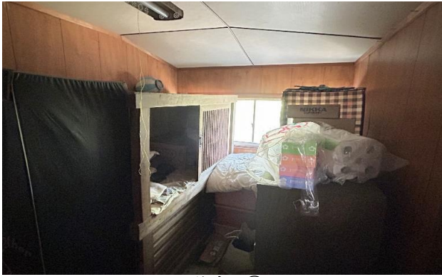
1F 洋室 ⑦