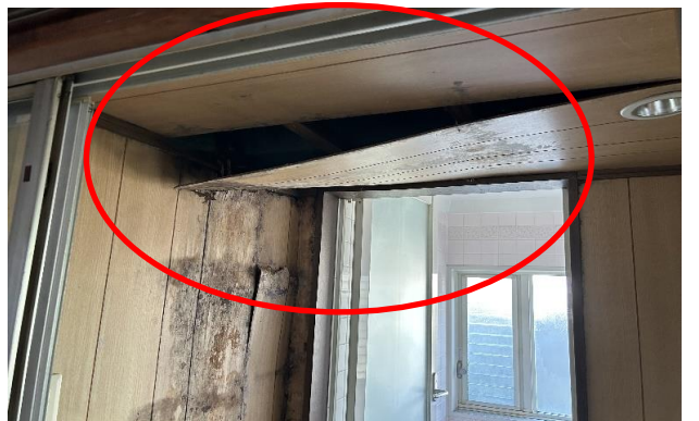
1F 風呂 ⑩ 天井