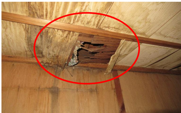
2F 洋室 ⑩ 押入 天井