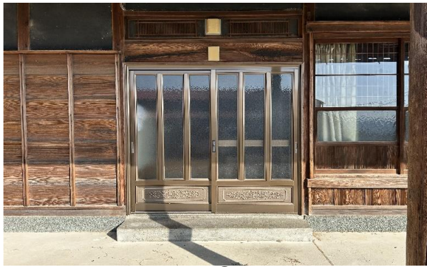
1F 玄関 ① (1)