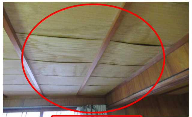
2F 洋室 ⑨ 天井