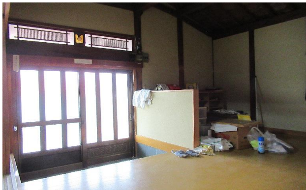
1F 玄関 ① (3)