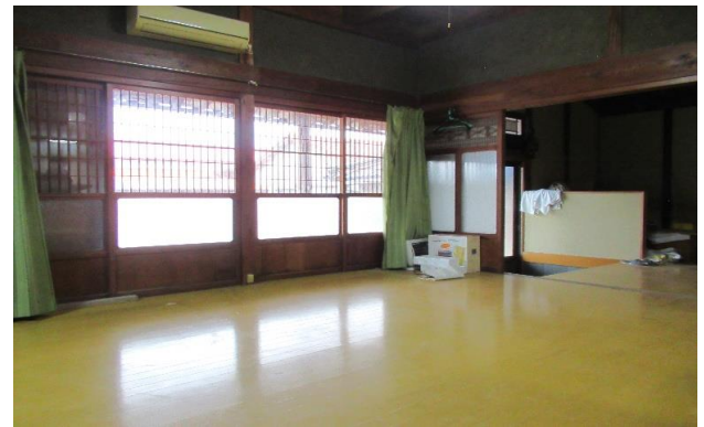
1F 和風洋室 ②