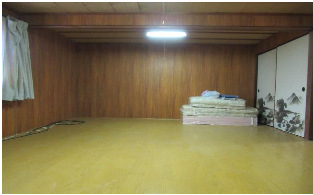
2F 和風洋室 ⑨