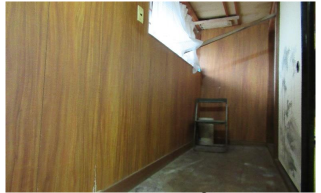
2F 廊下 ⑧