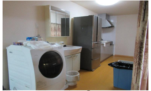
1F 台所 ⑦ (2)