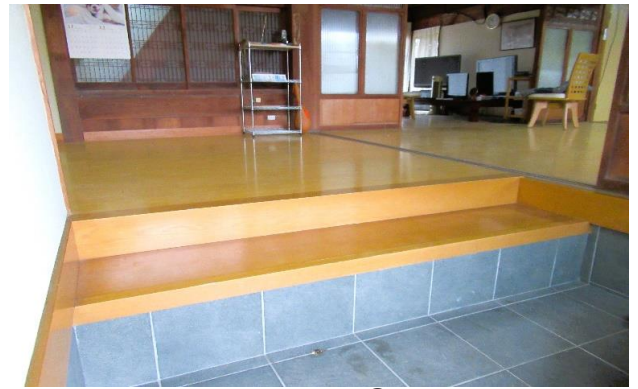
1F 玄関 ① (2)