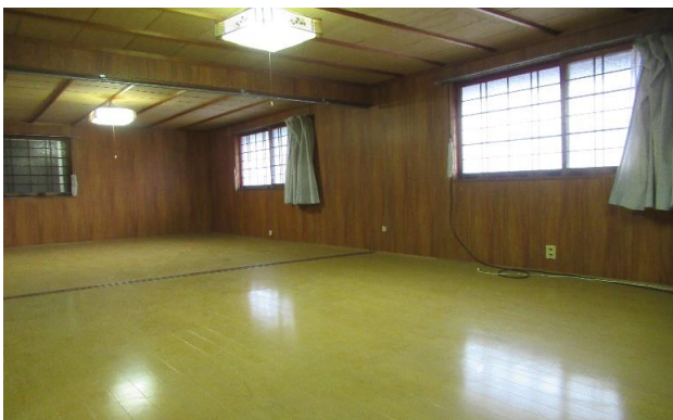
2F 和風洋室 ⑨⑩