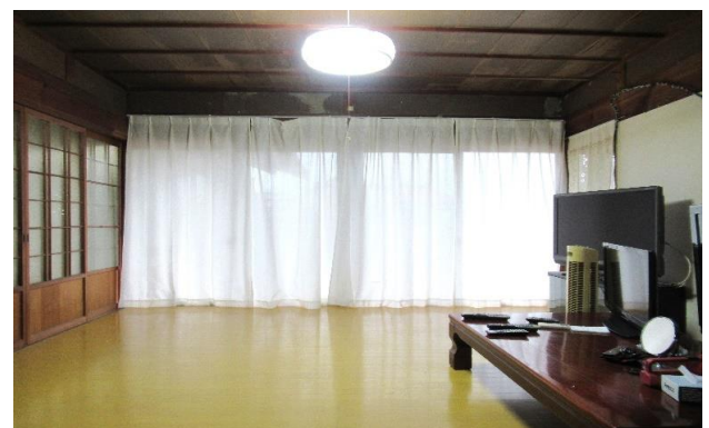
1F 和風洋室 ⑥