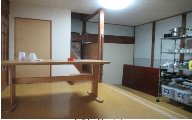
1F 台所 ⑦ (1)