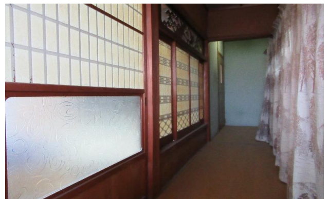
1F 廊下 ④