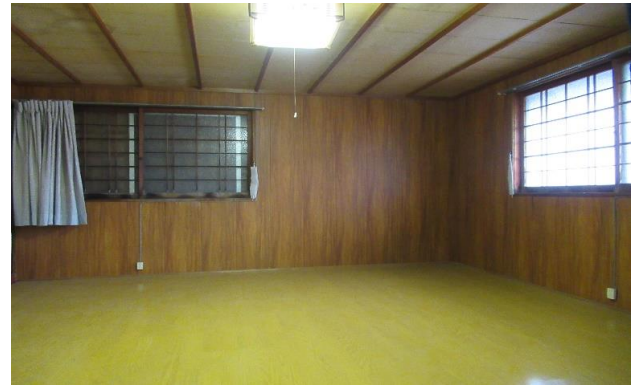
2F 和風洋室 ⑩