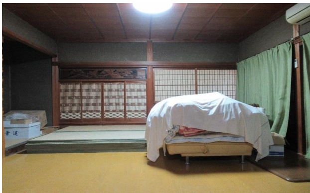
1F 和風洋室 ③