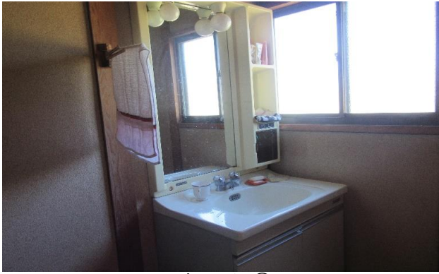
1F 洗面所 ⑦