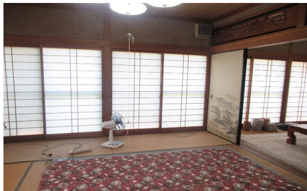
1F 和室 ④