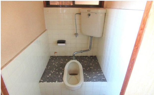
1F トイレ ⑨