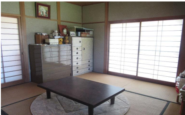
1F 和室 ⑪