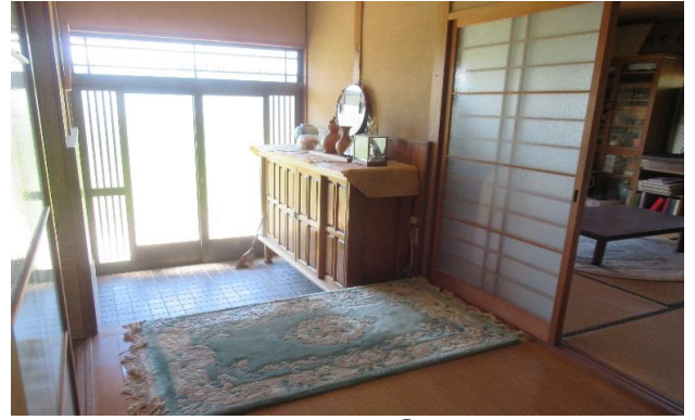
1F 玄関 ① (2)