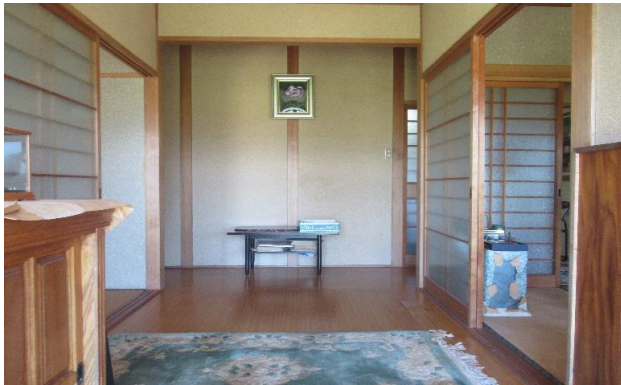
1F 廊下 ②