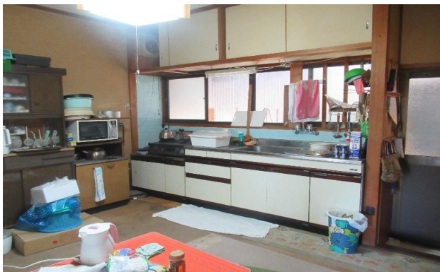
1F 台所 ⑥ (1)