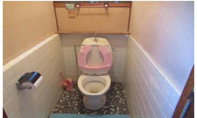
1F トイレ ⑩