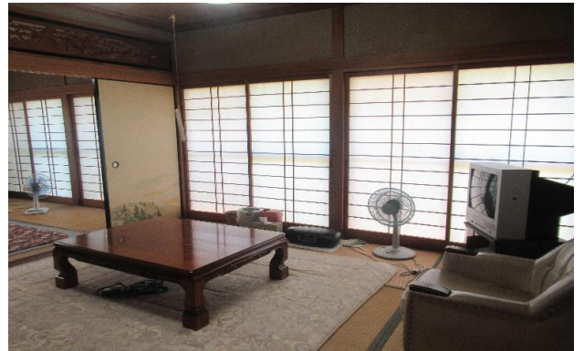
1F 和室 ③