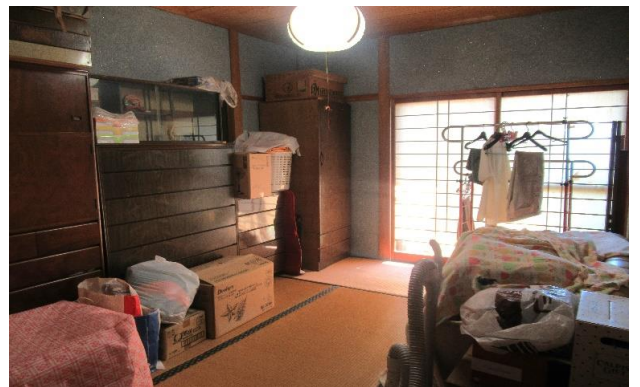
1F 和室 ⑤