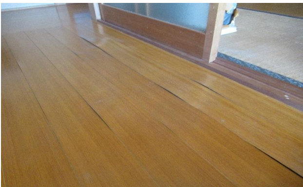
1F 廊下 たわみ