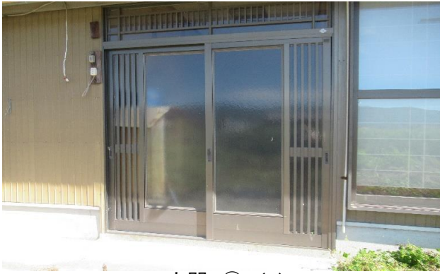
1F 玄関 ① (1)