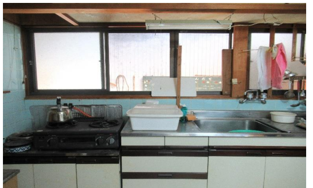
1F 台所 ⑥ (2)