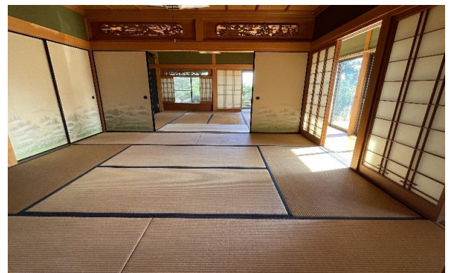
1F 和室 ⑤⑥