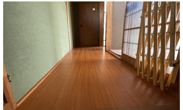
2F 廊下 ⑯