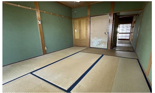
1F 和室 ⑧