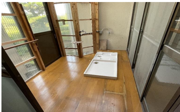
1F 洗濯機置場 ⑬