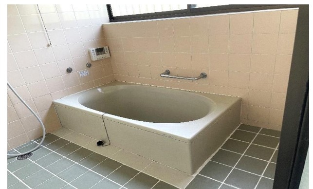
1F 風呂 ⑫