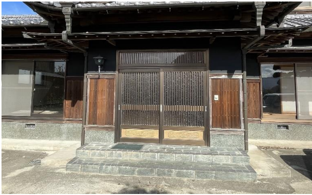
1F 玄関 ① (1)