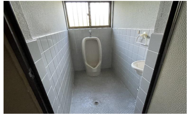
1F トイレ ⑩