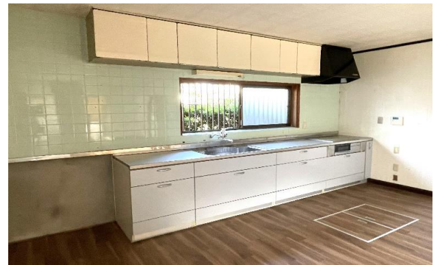
1F LDK ⑭ (1)