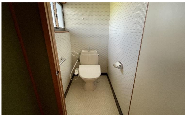
2F トイレ ⑰