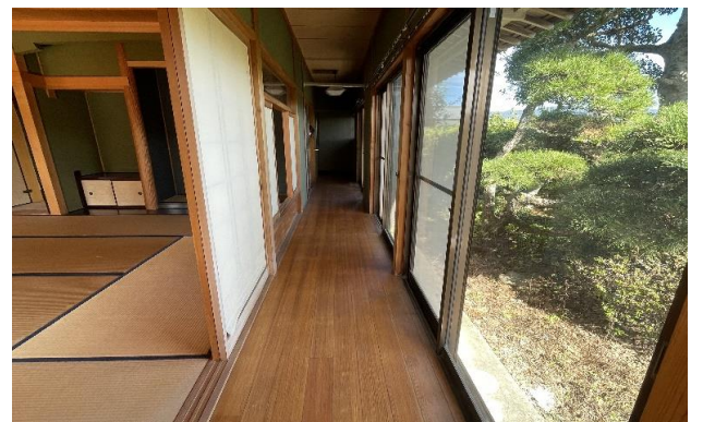
1F 廊下 ③