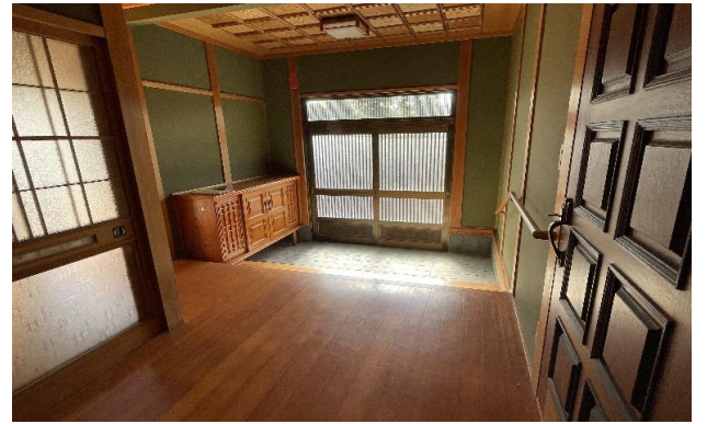
1F 玄関 ① (2)・廊下 ② (1)