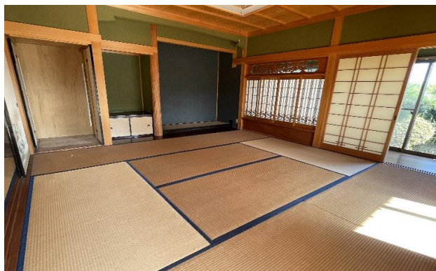
1F 和室 ⑥