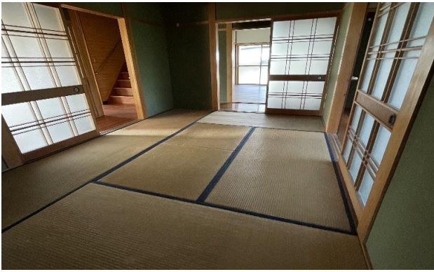
1F 和室 ⑦