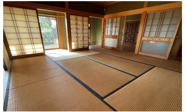
1F 和室 ⑤