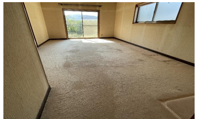
1F 洋室 ⑮