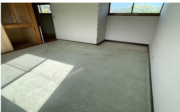
2F 洋室 ⑲