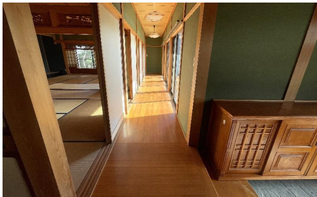
1F 廊下 ② (2)