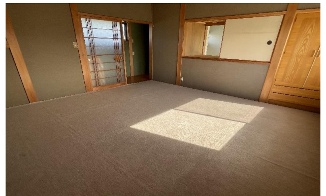
2F 和室 ⑱