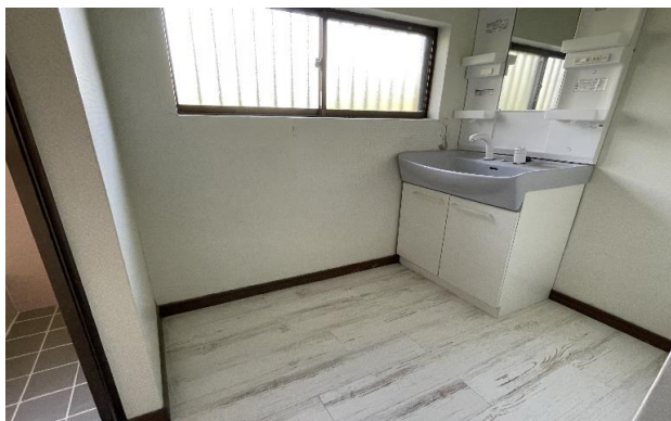
1F 洗面所 ⑪