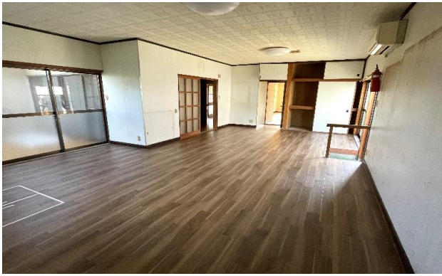
1F LDK ⑭ (2)