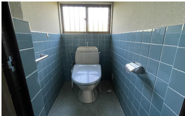
1F トイレ ⑨