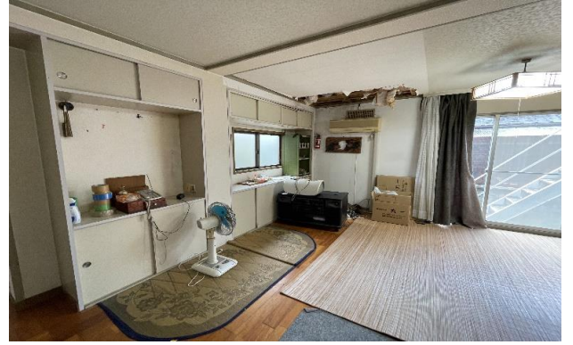
1F 台所 ④ (3)