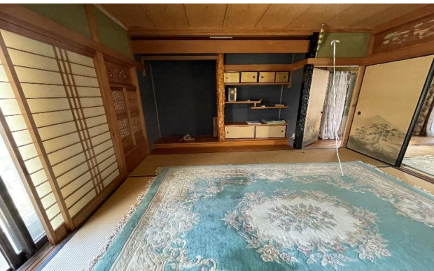
倉庫 2F 和室 ⑬