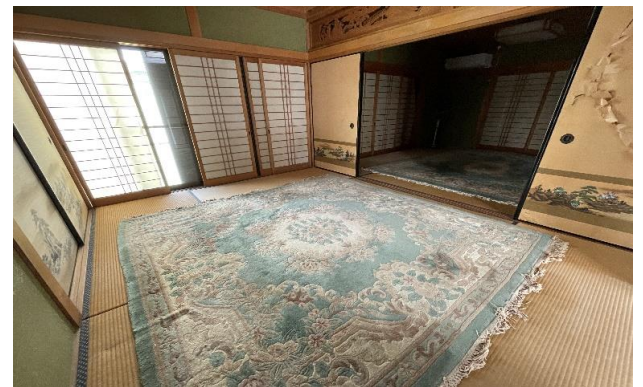
倉庫 2F 和室 ⑫