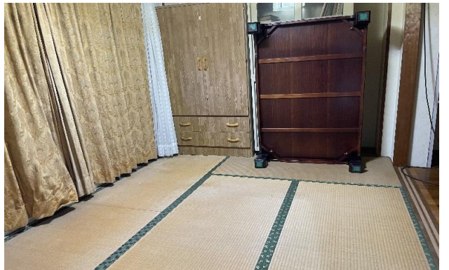
2F 和室 ⑧