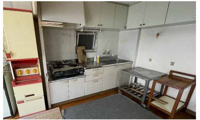
1F 台所 ④ (1)