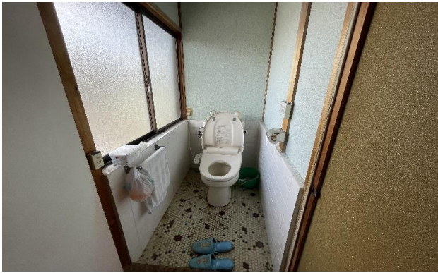
倉庫 2F トイレ ⑪