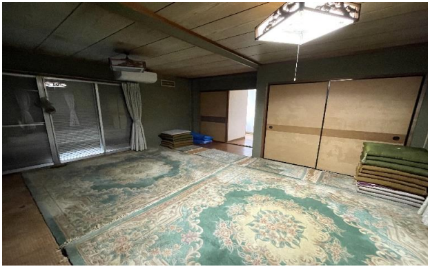
2F 和室 ⑩