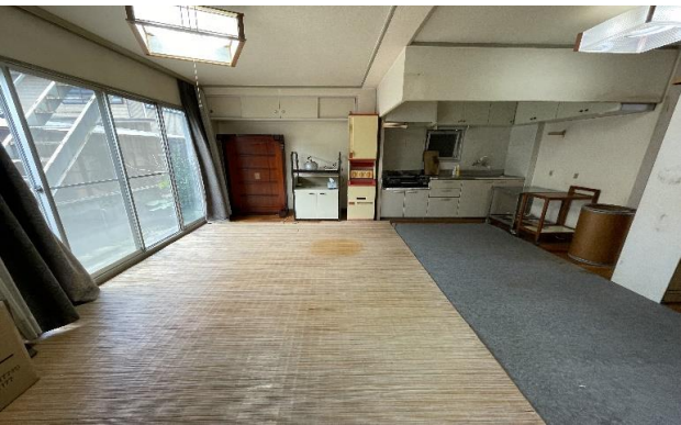
1F 台所 ④ (2)