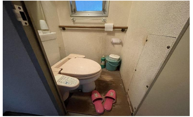
1F トイレ ⑤