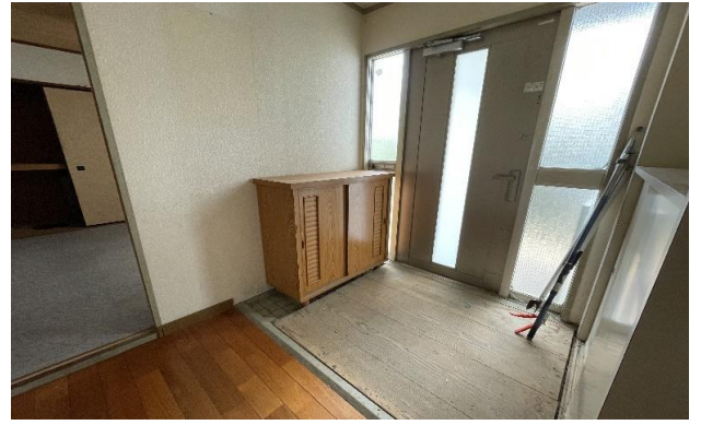
1F 玄関 ① (2)