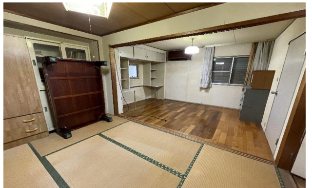
2F 和・洋室 ⑧⑨