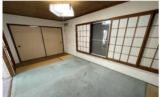
1F 和室 ③