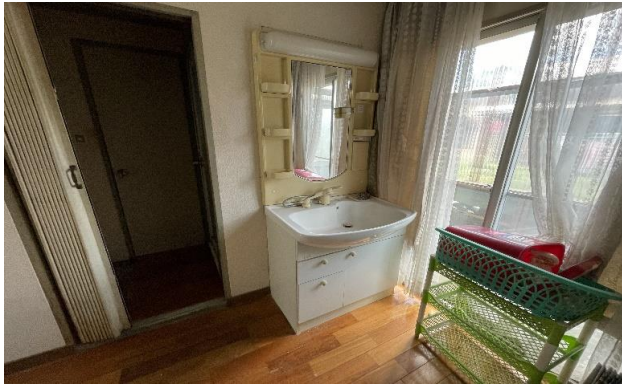
1F 台所 ④ (4)