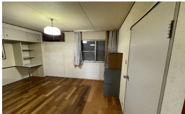
2F 洋室 ⑨