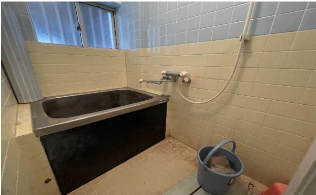
1F 風呂 ⑥