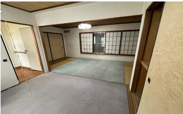
1F 和室 ②③