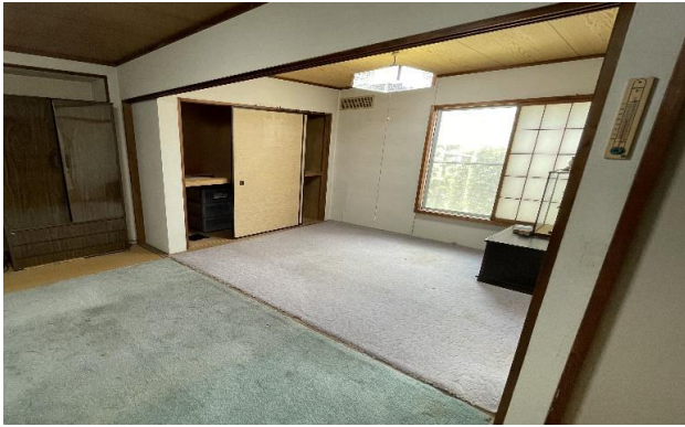
1F 和室 ②