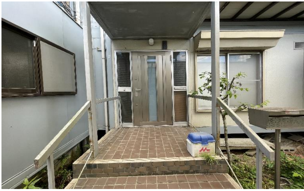
1F 玄関 ① (1)