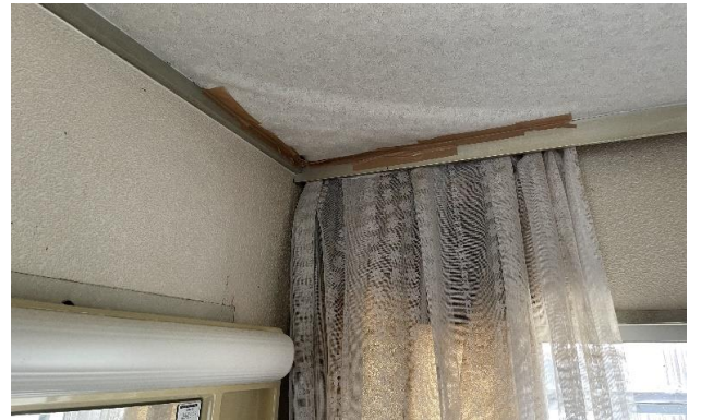
1F 台所 天井 雨漏り