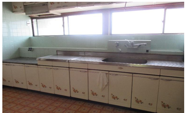
1F 台所 ⑫ (2)