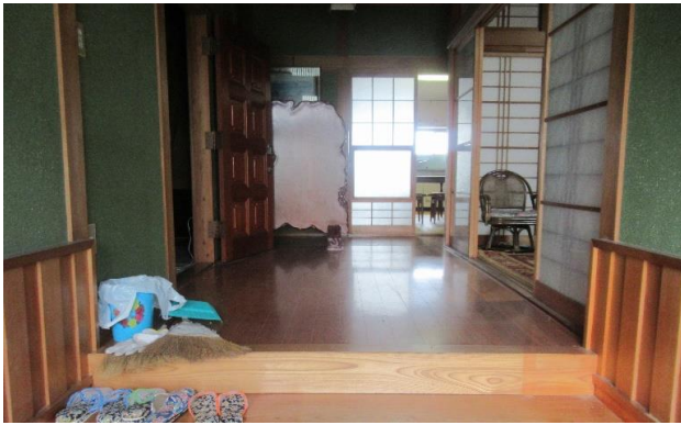
1F 廊下 ②