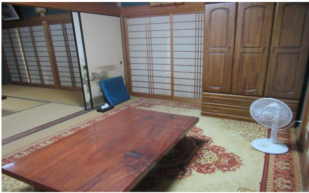
1F 和室 ④