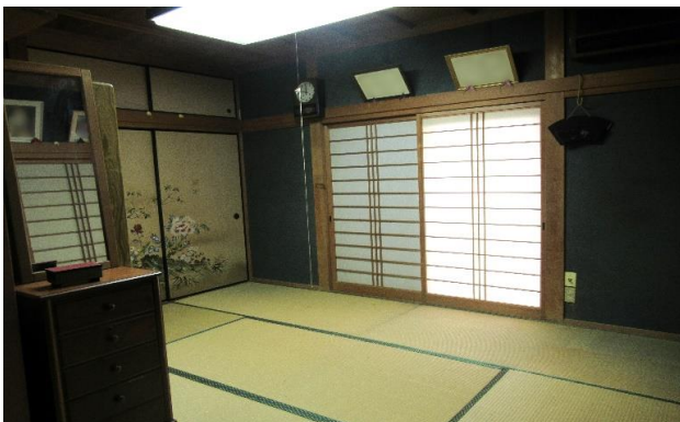
1F 和室 ⑬