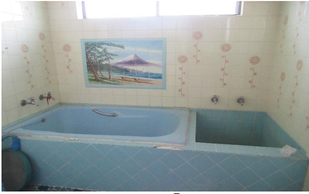
1F 風呂 ⑧