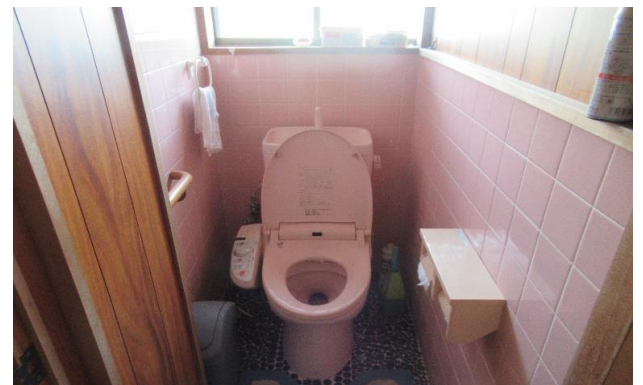
1F トイレ ⑦