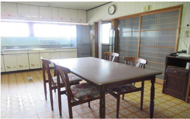
1F 台所 ⑫ (1)