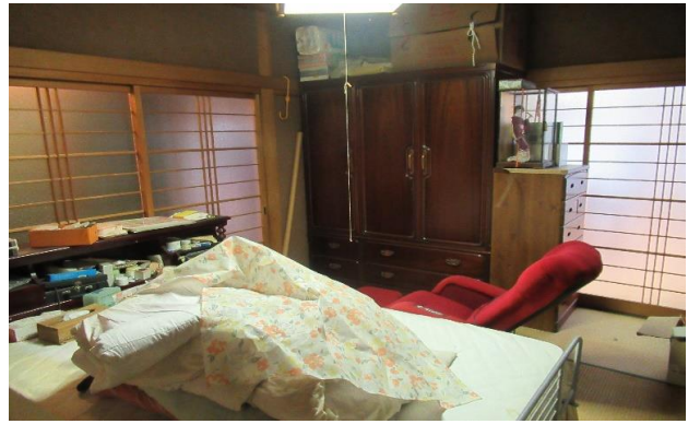
1F 和室 ⑪