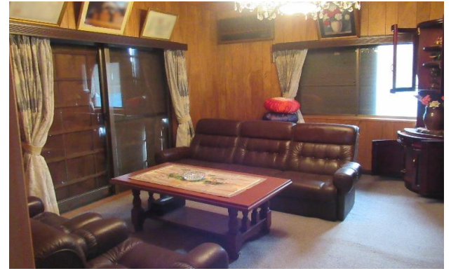
1F 洋室 ③