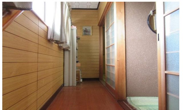
2F 廊下 ⑭