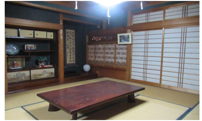
1F 和室 ⑤