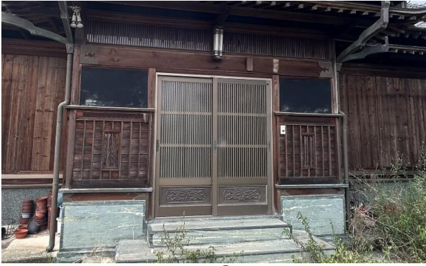
1F 玄関 ① (1)