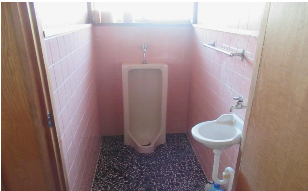
1F トイレ ⑥