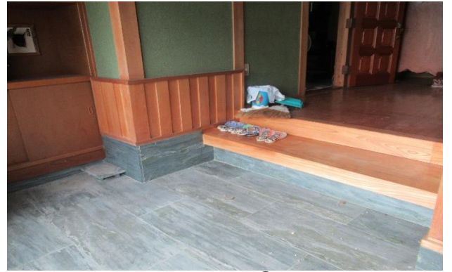
1F 玄関 ① (2)