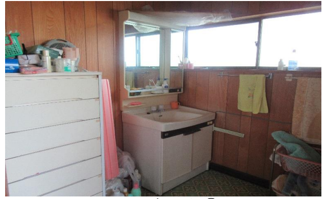
1F 洗面所 ⑨