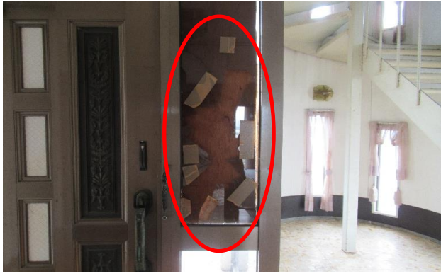
1F 玄関 ① ガラス