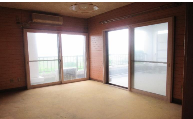
3F 洋室 ④