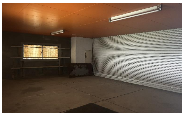
1F ガレージ ③