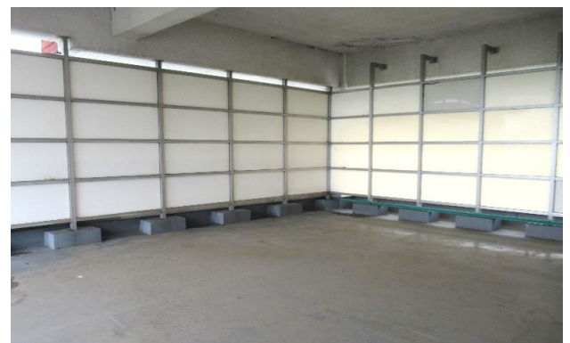
3F バルコニー ⑤