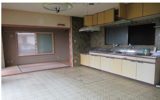
1F 台所 ⑤ (1)