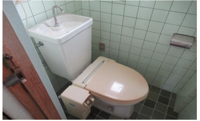
2F トイレ ④