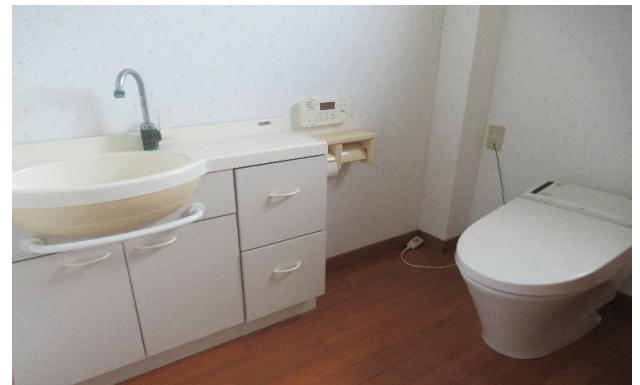
1F トイレ ⑬