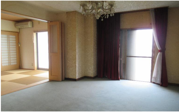
1F 洋室 ⑧