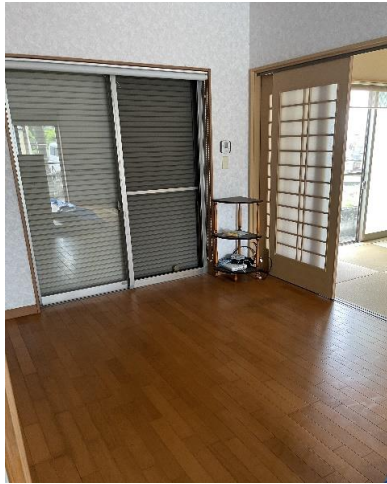
1F ホール ⑩