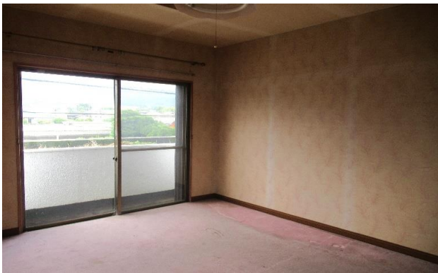
2F 洋室 ⑦