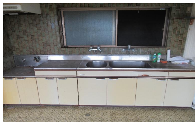
1F 台所 ⑤ (2)