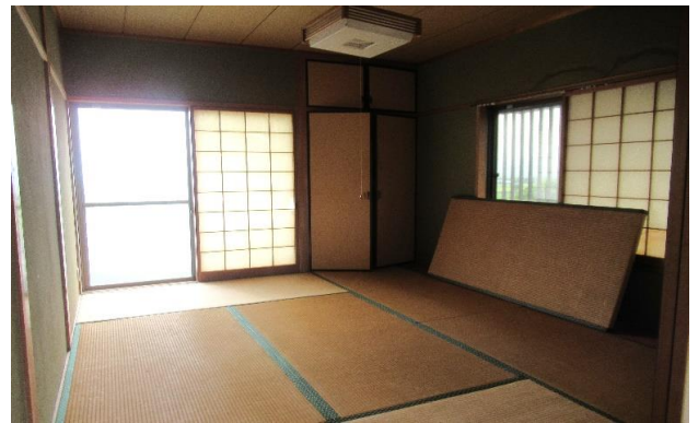
2F 和室 ⑧