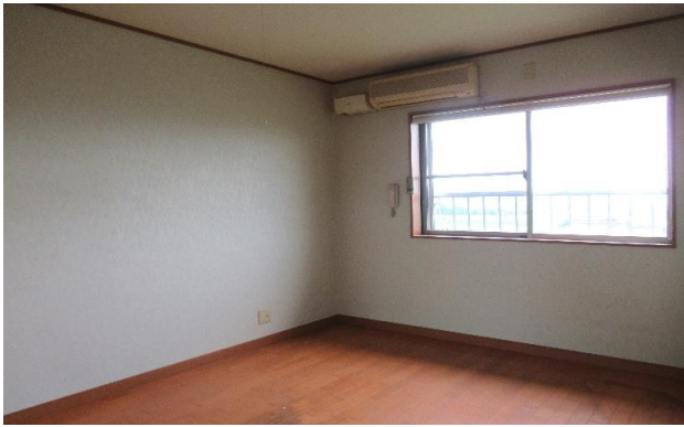
2F 洋室 ⑪