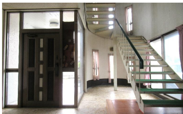
1F ホール ②