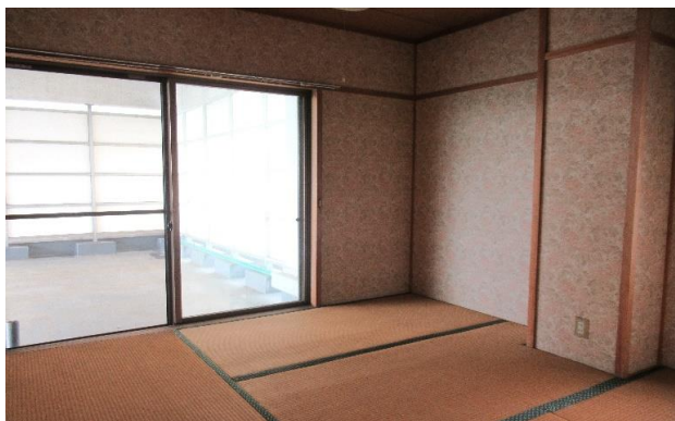
3F 和室 ②