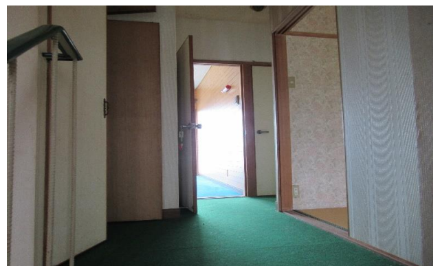
3F 廊下 ①