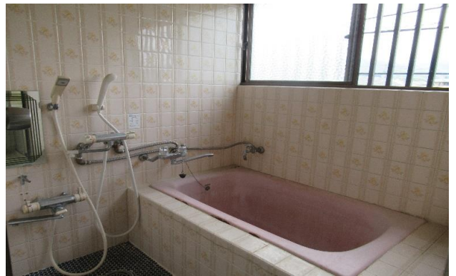
2F 風呂 ⑥