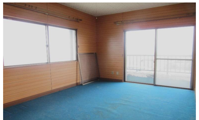
3F 洋室 ③