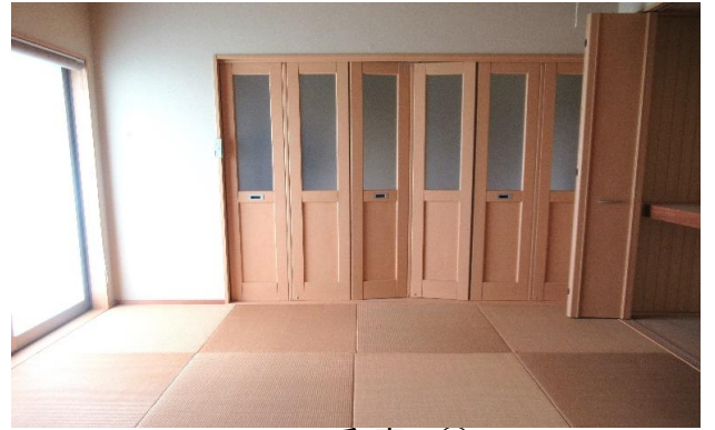
1F 和室 ⑨