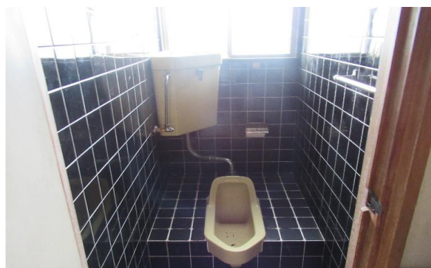
1F トイレ ⑥