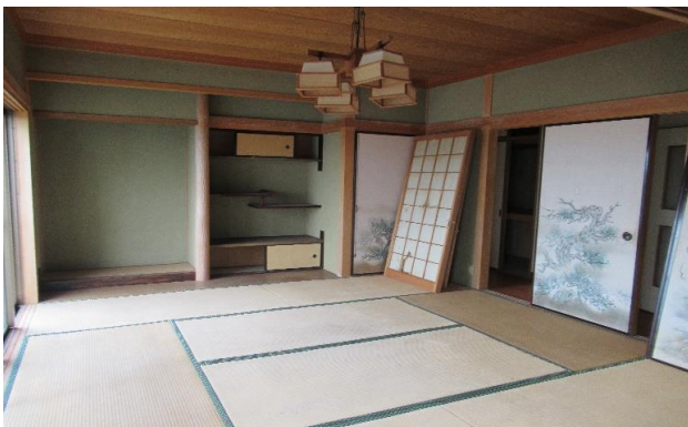
2F 和室 ⑨