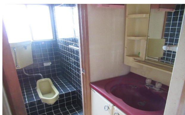
1F 洗面所 ⑦