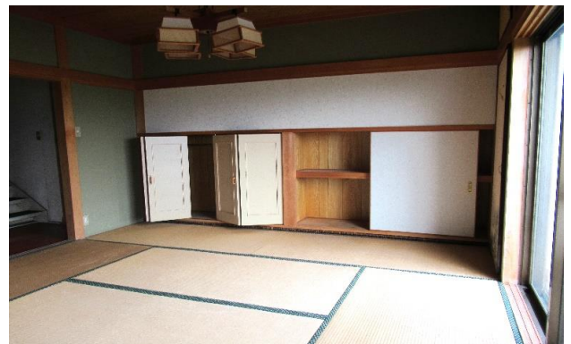
2F 和室 ⑩