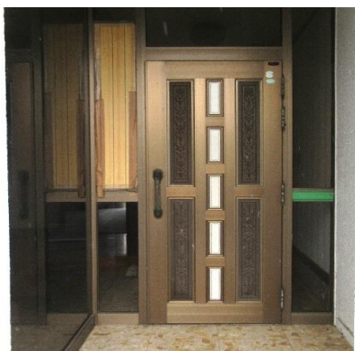
1F 玄関 ①