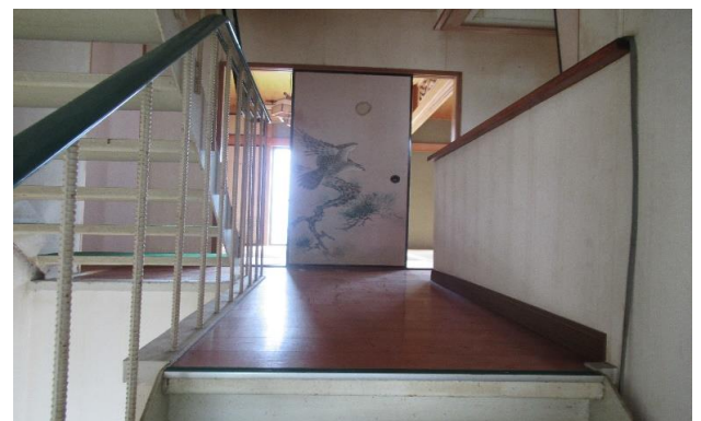
2F 廊下 ②