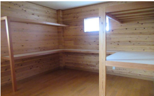
2F 納戸 ⑬