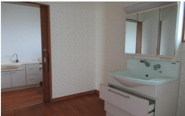
1F 洗面所 ⑫