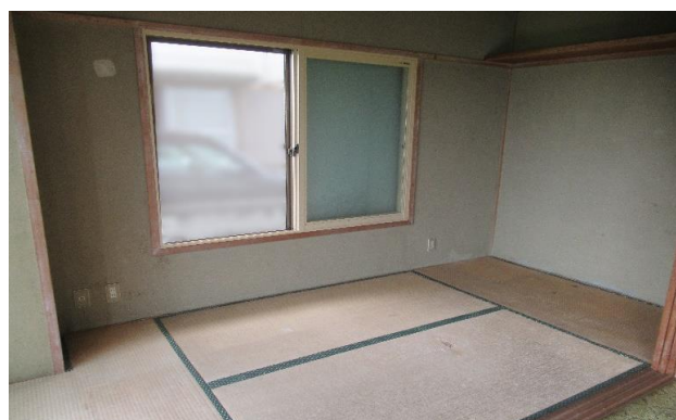
1F 和室 ④