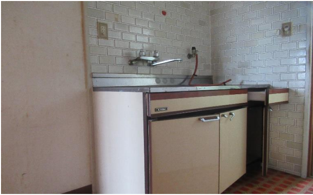
2F 台所 ③