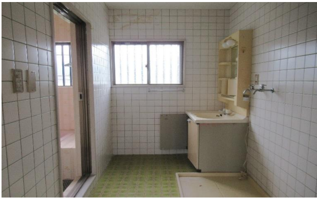
2F 洗面所 ⑤