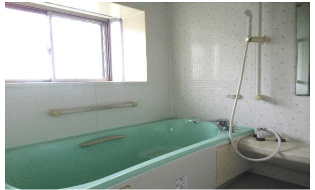
1F 風呂 ⑪