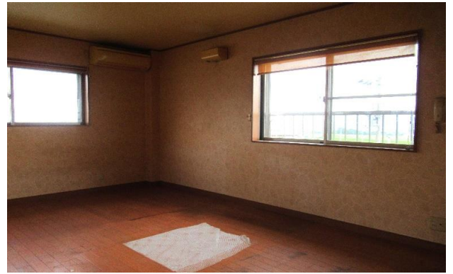
2F 洋室 ⑫