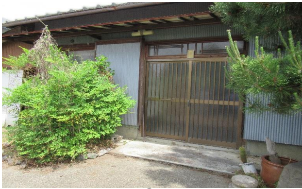
玄関 ① (1)