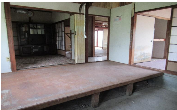
台所 ⑪ (2)