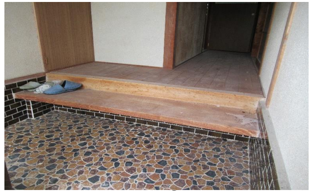
玄関 ① (2)