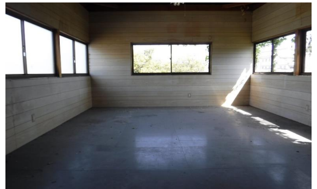
1F 倉庫 ⑭