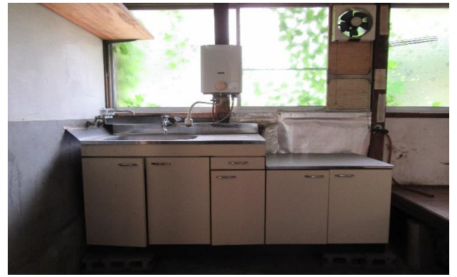
台所 ⑪ (1)