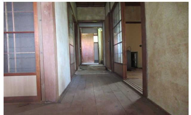
廊下 ② (2)