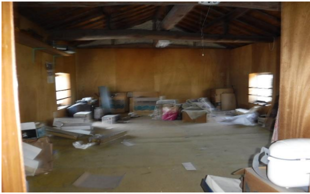
2F 和室 ⑰