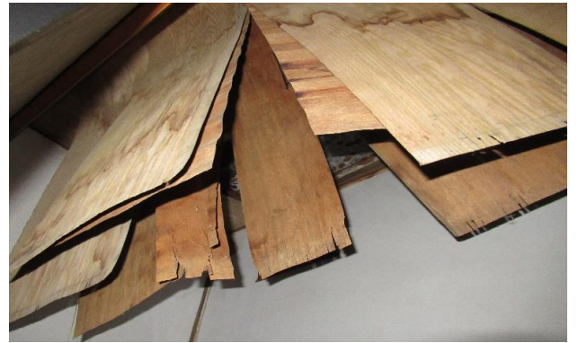
廊下 ② 天井(雨漏り跡)