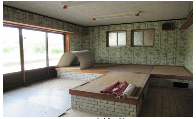
1F 店舗 ⑯