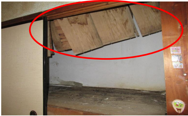
和室 ⑤ 押入(雨漏り跡)