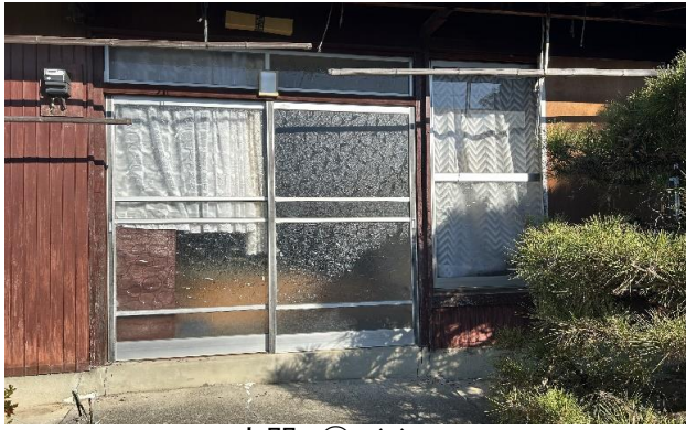
玄関 ① (1)