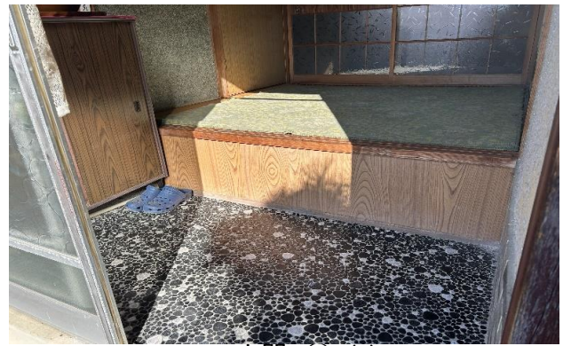
玄関 ① (2)