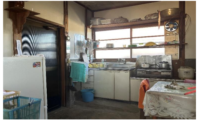
台所 ⑤ (1)