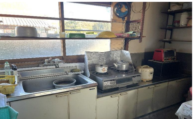
台所 ⑤ (2)