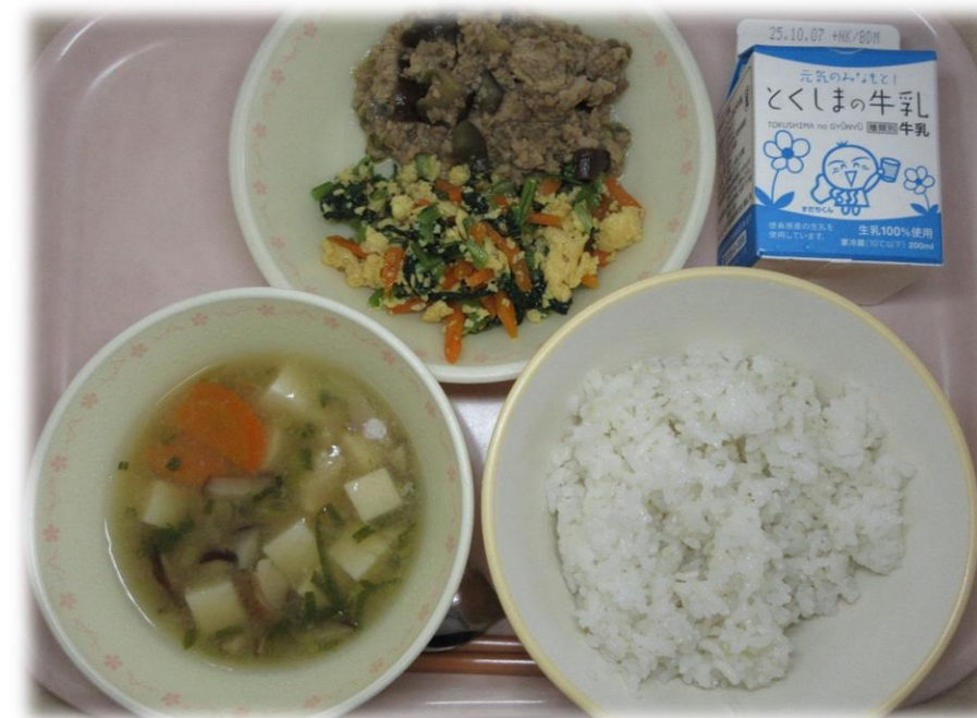
9月24日(水) ごはん みぞれ汁 夏野菜の肉みそそばろどん (肉みそ・あえ物) 牛乳