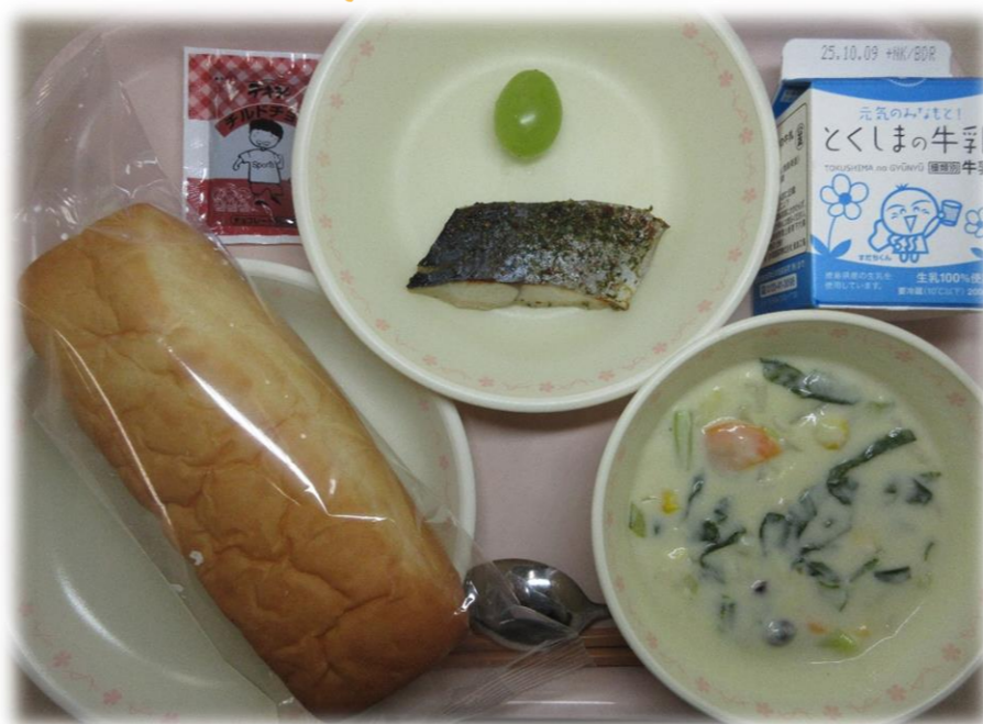
9月26日(金) コッパン チンゲンサイのミルクスープ さわらのハーブ焼き チョコクリーム シャインマスカット 牛乳