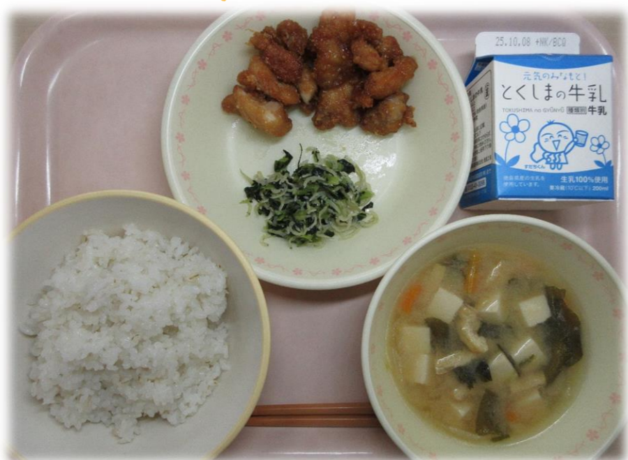
9月25日(木) ごはん とり肉のすだち風味 阿波温菜のじゃこピーふいかけ みそ汁 牛乳