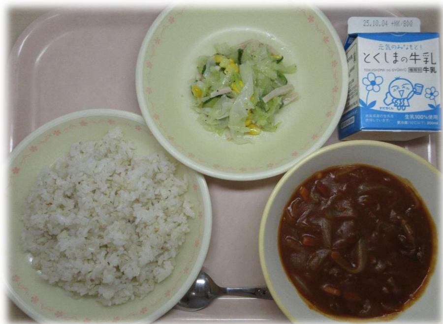
9月22日(月) 麦ごはん ハヤシライス イタリアンサラダ 牛乳