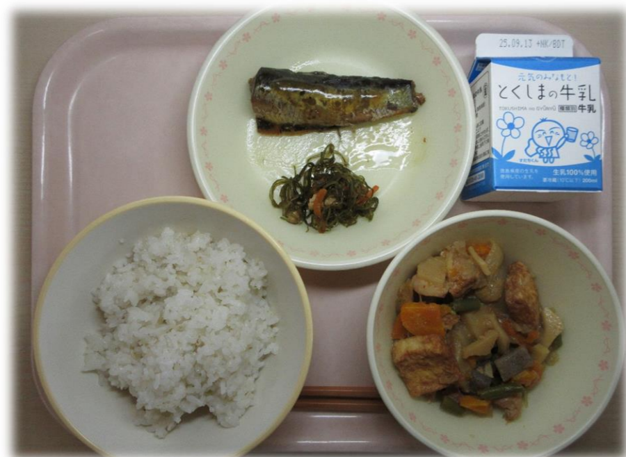
9月1日(月) ごはん いわしのうめに こんにゃくとあつあげのみそに こんぶのにももの 牛乳