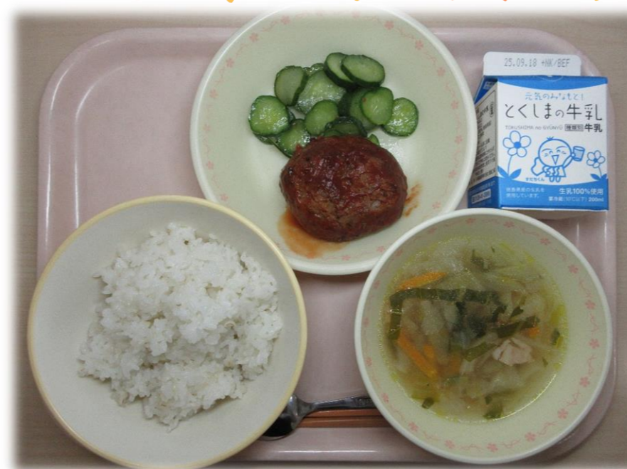
9月5日(金) ごはん 手作りハンバーグ キャベツのコンソメスープ きゅうりのマリネ 牛乳