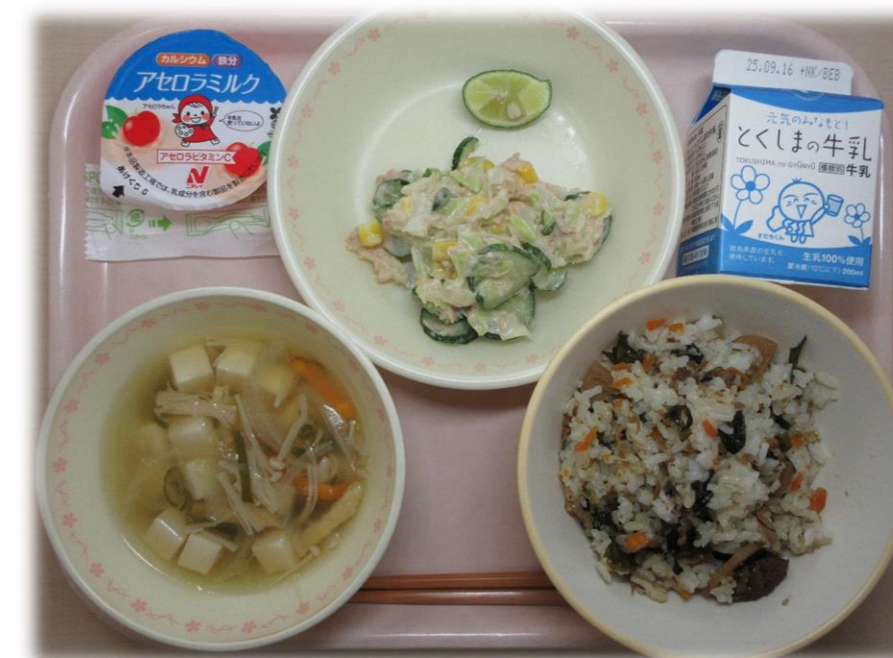
9月3日(水) 阿波キューまぜごはん ツナサラダ すまし汁 すだち アセロラとう乳ゼリー 牛乳