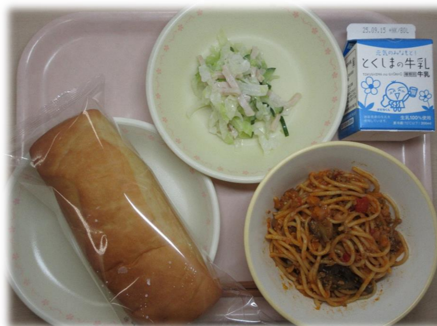
9月2日(火) コッパン コールスローサラダ なす入りミートスパゲティ 牛乳