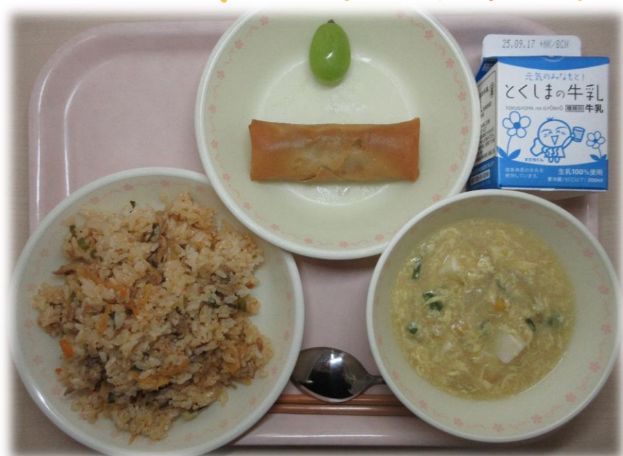
9月4日(木) ぶたキムチチャーハン 春まき ちゅうか風コーンスープ シャインマスカット 牛乳