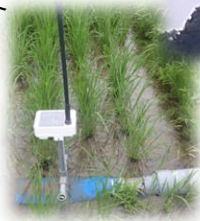
防除用ドローンや水管理システムによるスマート農業の実践

※ 支援メニュー、対象、単価、要件等について、今後の国との調整等の結果により、修正が生じ得ることにご留意ください。