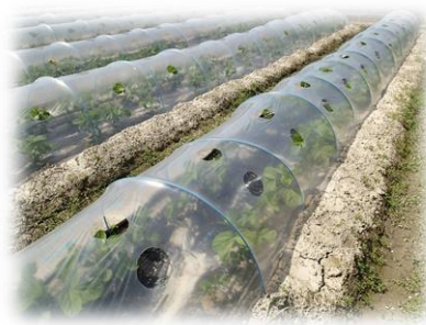
雨よけ栽培による秀品率の向上

各地域農業再生協議会が 指定する3品目（基幹作） を対象に、 生産性向上 に取り組む農業者を支援します。