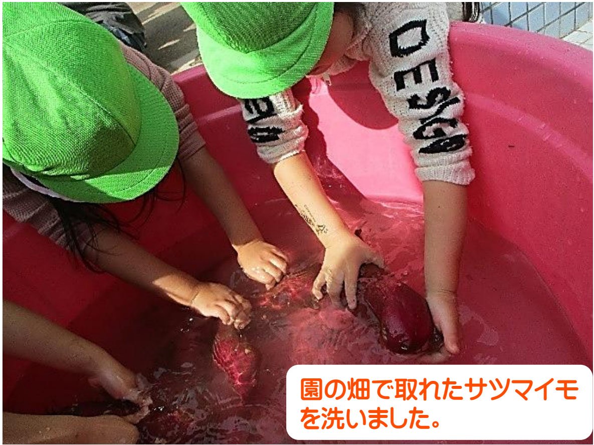
園の畑で取れたサツマイモ を洗いました。