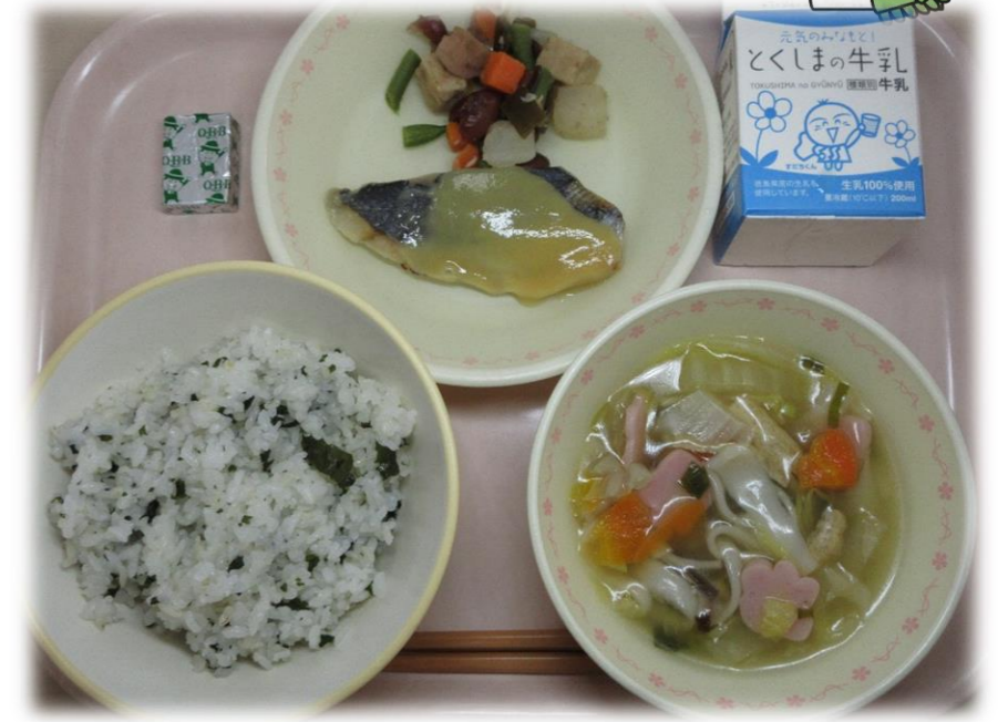
1月24日(水) ★わかめごはん さわらのゆずみそかけ おでんぶ ふしめん汁 チーズ(中のみ) 牛乳