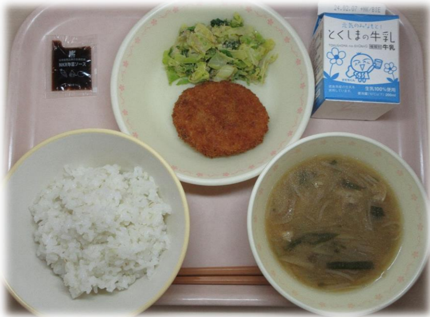
1月25日(木) ごはん れんこんはさみあげ 菜の花のごまあえ ★とん汁 パックソース 牛乳