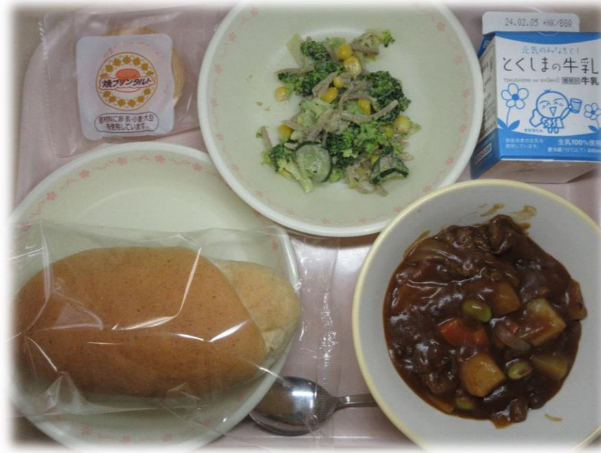
1月23日(火) 全粒粉パン ビーフシチュー ごぼうとコーンのサラダ ★焼きブリュッレ 牛乳