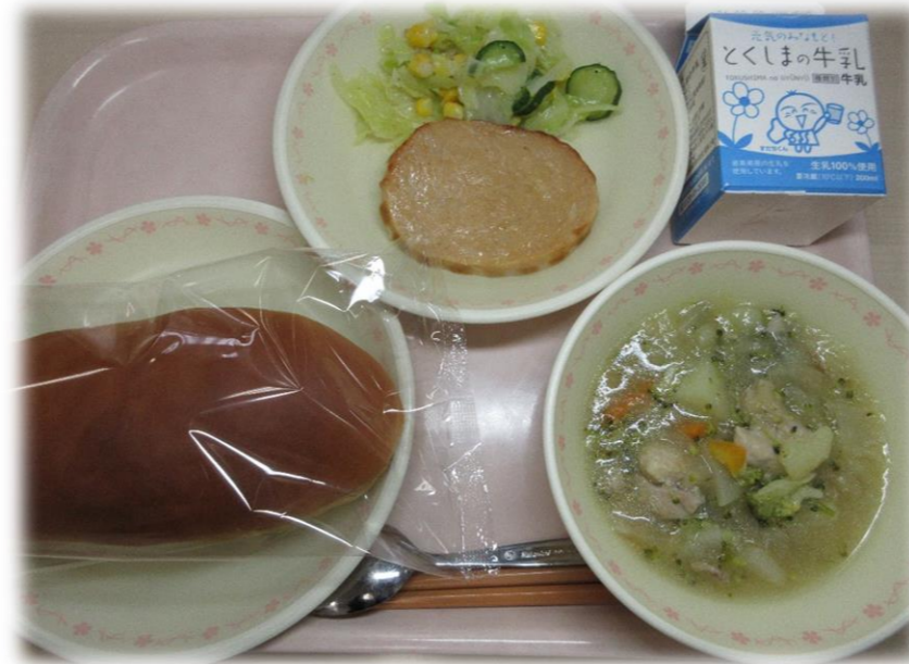
1月26日(金) キャラメルパン ボロニアハム イタリアンサラダ とり肉のみぞれに 牛乳

本年度のAwa産Our消Myメニューコンクール入選作品「とり肉のみぞれに」を26日(金)給食で提供しました。大根を使用した、この時期らしいメニューでしたね。