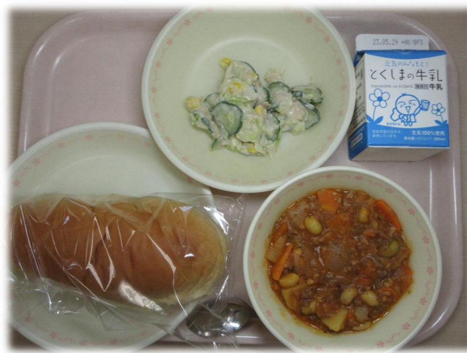
5月16日(火) ごはん 千りコンカン ツナサラダ 牛乳