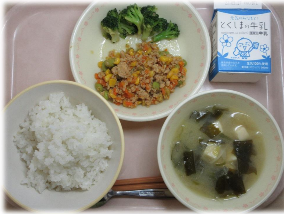
5月15日(月) ごはん そぼろ丼 ちゅうか風フロッコリー みそ汁 牛乳