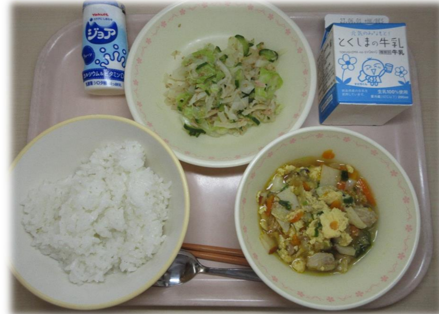
5月19日(金) ごはん 親子丼 切りほし大根のあまずあえ 飲むヨーグルト 牛乳

17日に提供された「ならえ」は徳島県の郷土料理です。野菜をたくさん使用しており、不足しがちな栄養素をとることができます。昔から伝えられてきた郷土料理を大切にしていきたいですね。