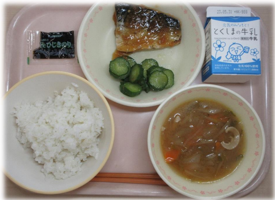
5月18日(木) ごはん さばのみぞれに きゅうりのかおりづけ とん汁 ひじきのいつくだに 牛乳