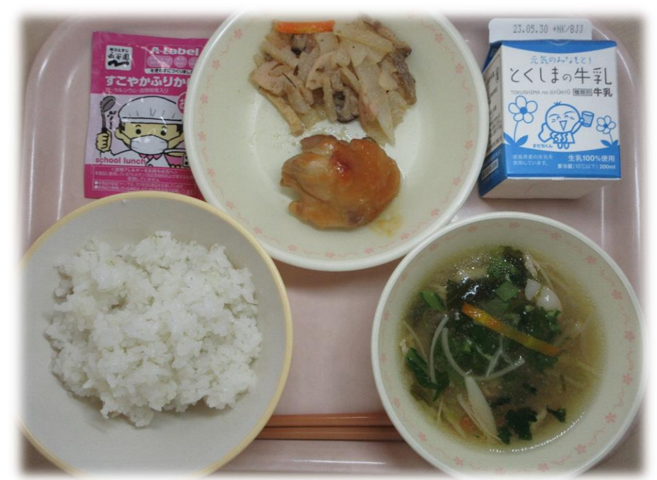
5月17日(水) ごはん とり肉のみそ焼き ならえ さわにわん おかかふりかけ 牛乳