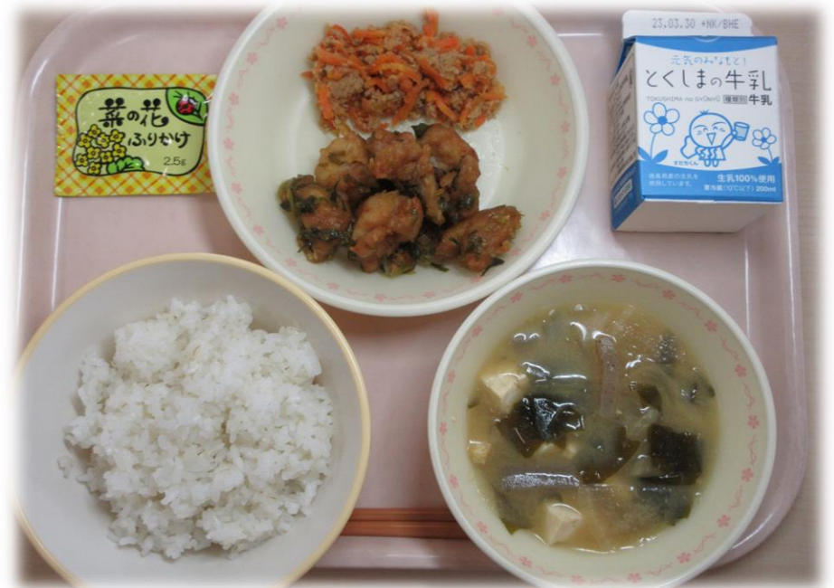
3月22日(水) ごはん とり肉のねぎソースあえ にんじんシリシリ とうふのみそ汁 菜の花ふりかけ 牛乳