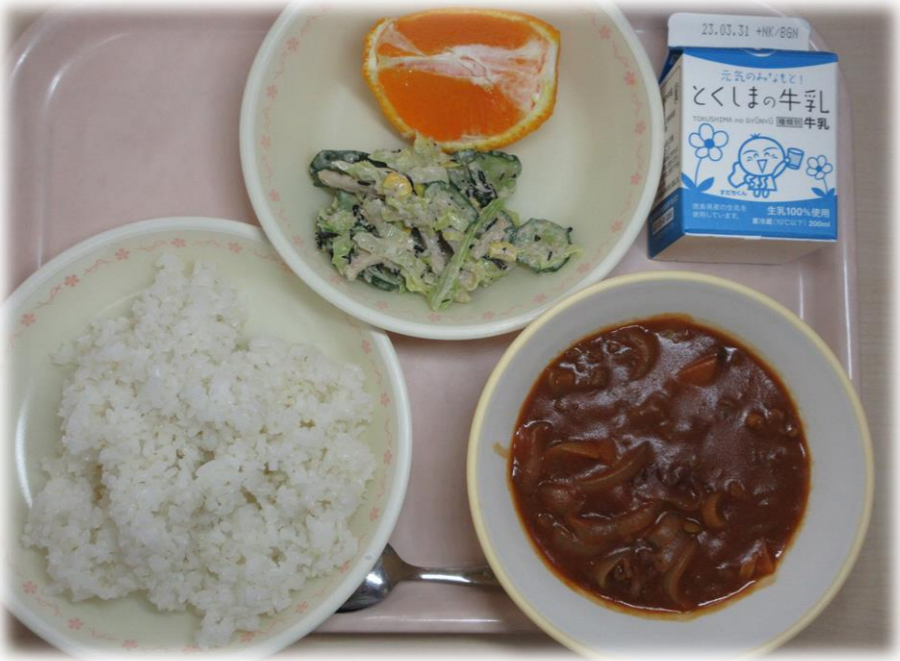
3月23日(木) ごはん ハヤシライス ひじきとコーンのサラダ デコポン 牛乳