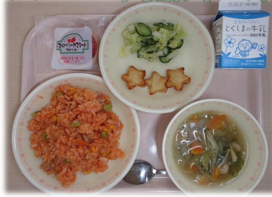
3月20日(月) チキンライス 星形ポテト イタリアンサラダ レタススープ ストロベリータルト 牛乳