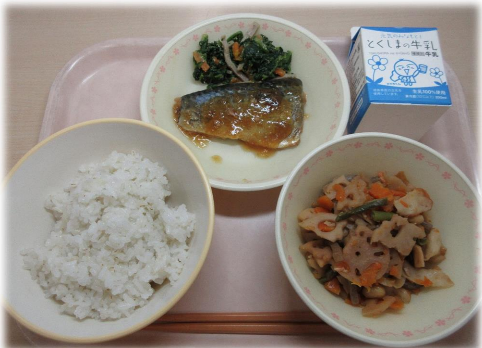
12月8日(木) ごはん さばのみぞれに ごまずあえ れんこんきんぴら 牛乳