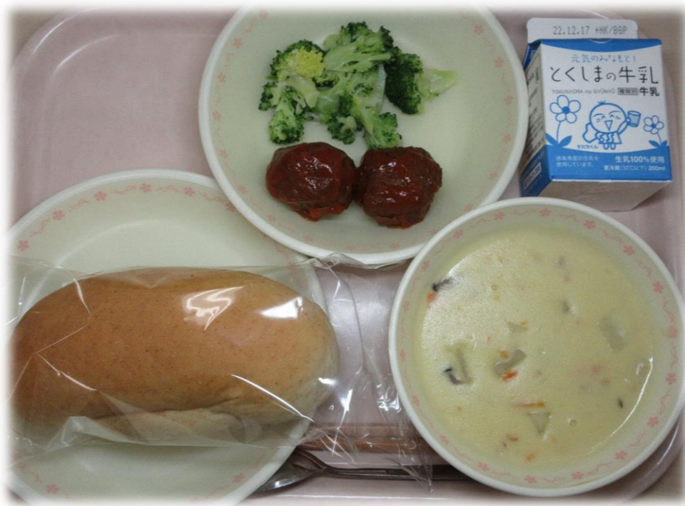
12月9日(金) 全粒粉パン フロッコリーのかんきつあえ 肉だんご 森のクリームシチュー 牛乳

今月から中学3年生が卒業までにもう一度 食べたい給食メニューが登場します！！ 7日の「大学いも」がリクエストメニュー でした。 次回もお楽しみに～