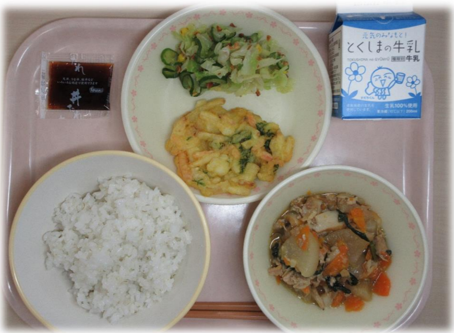
12月5日(月) ごはん えびいかかきあげ 野菜のアーモンドあえ 大根のちゅうかに あまだれ 牛乳