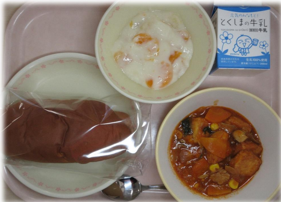
12月6日(火) ココアパン あつあげのチリソースに フルーツババロア 牛乳