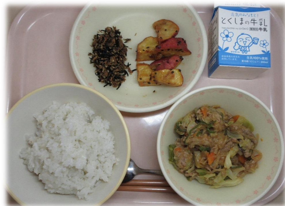
12月7日(水) ごはん ホイコーロー ★大学いも てづくりひじきふいかけ 牛乳