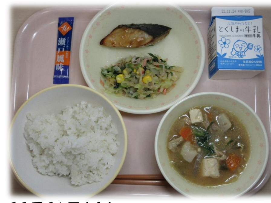
11月16日(水) ごはん 切りほし大根サラダ さわらのあまからソースかけ とん汁 ふりかけ 牛乳