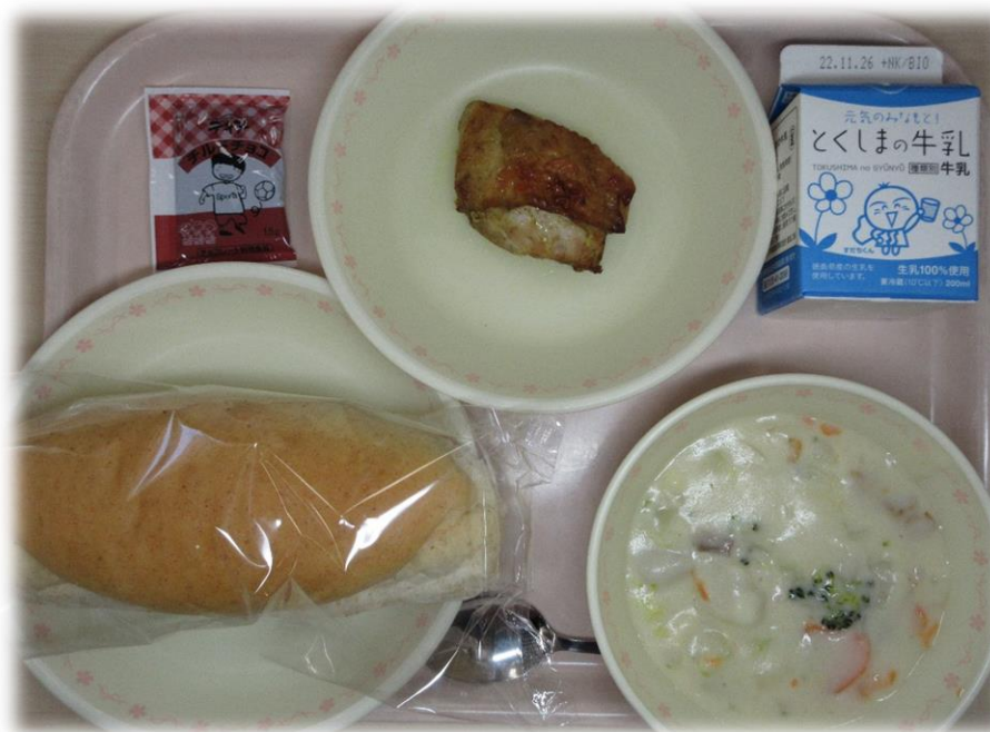
11月18日(金) 全粒粉パン とり肉のカレー焼き 冬野菜の米粉シチュー チョコクリーム 牛乳