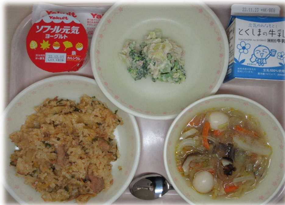
11月15日(火) ぶたキムチチャーハン さつまいもサラダ タイプーエン ヨーグルト 牛乳