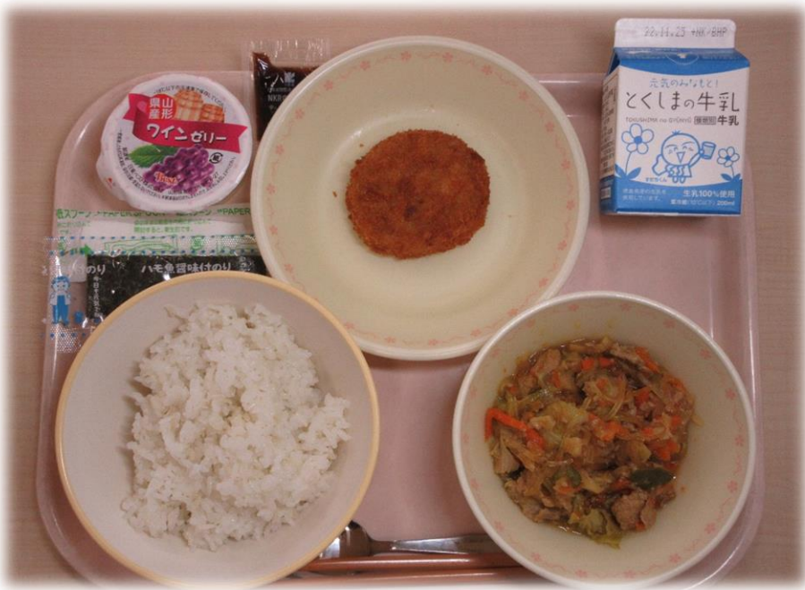
11月17日(木) ごはん れんこんはさみあげ パックソース 手作りダシの野菜いため ワインゼリー ハモ風味あじつけのり 牛乳