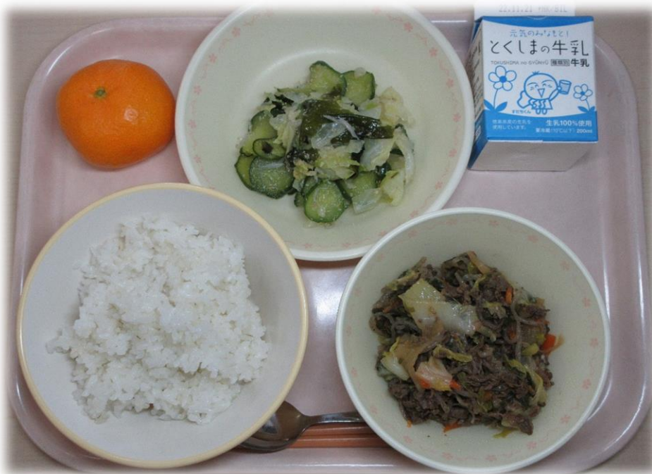
11月14日(月) ごはん 牛すき丼 すだちずあえ みかん 牛乳