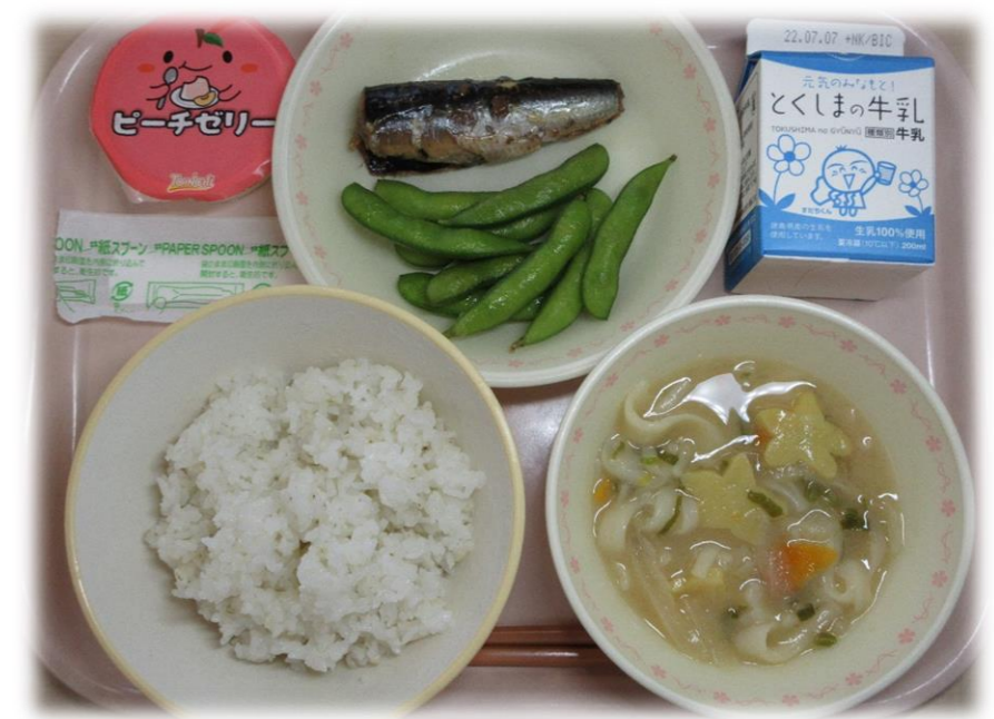
6月29日(水) ごはん いわしのうめに えだまめ ふしめんみそ汁 わかめふりかけ ももゼリー 牛乳