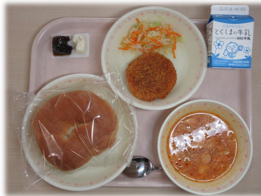
6月28日(火) 全粒粉バンズ 阿波ストローネ セルフメンチカツバーガー(メンチカツ・ボイル野菜) マヨ&ソース 牛乳