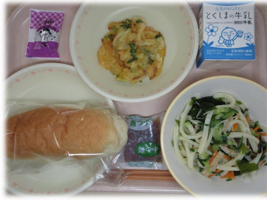
7月1日(金) 小型おからパン 冷やしうどん えびいかかきあげ レーズンクリーム めんつゆ 牛乳