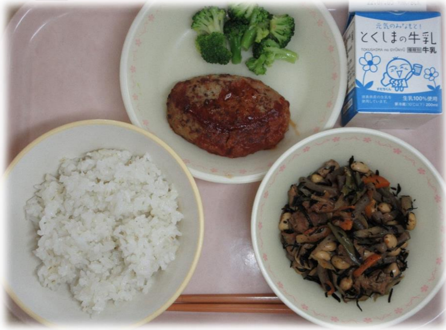
6月27日(月) ごはん ひじきと大豆のにももの ハンバーグのケチャップソースかけ ボイルブロッコリー 牛乳