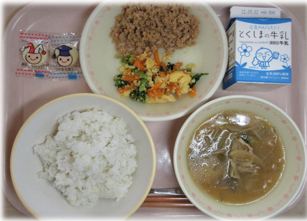
4月25日(月) ごはん とん汁 三色丼(肉そぼろ・あえもの) チーズ 牛乳