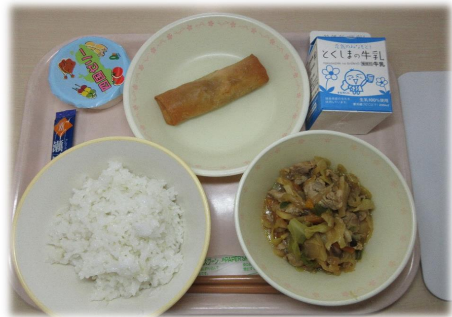
4月28日(木) ごはん ホイコーロー 春まき ふいかけ 四国ゼリー 牛乳