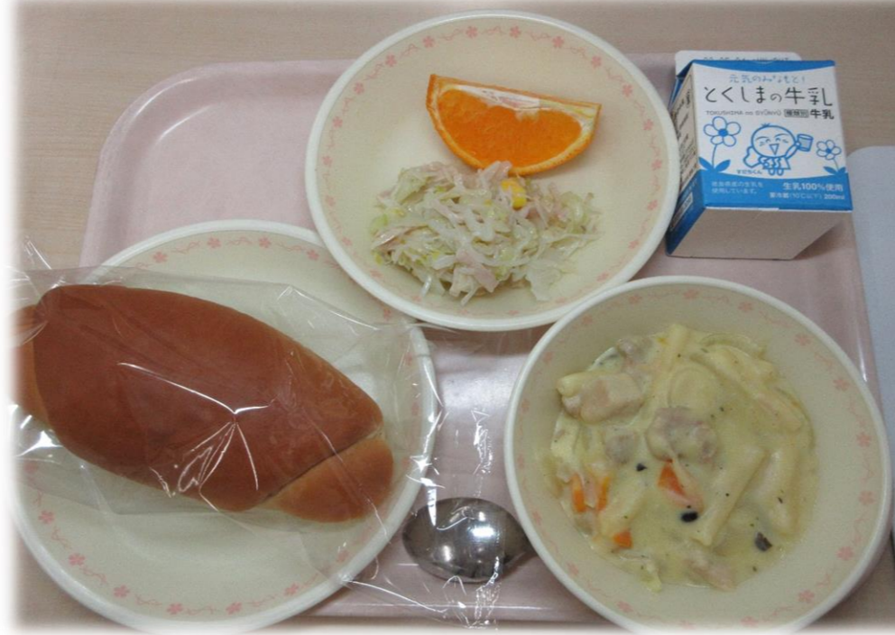
4月26日(火) こくとうパン マカロニのクリームに ハムサラダ テコポン 牛乳