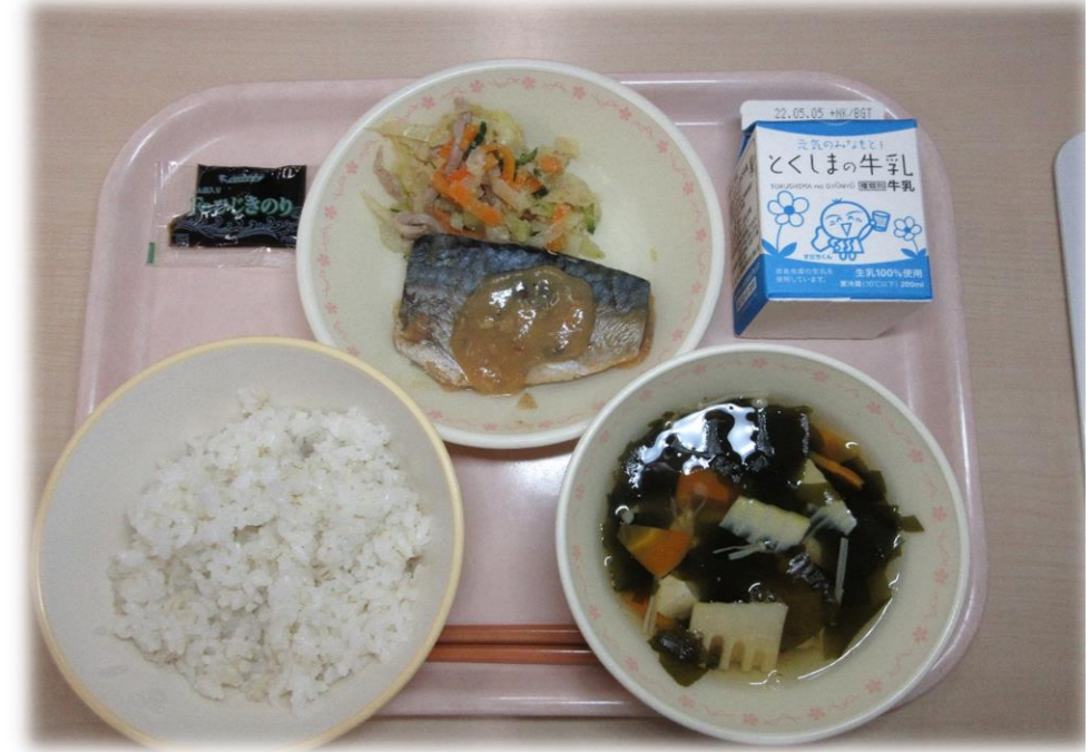
4月27日(水) ごはん さばのみそに ごまずあえ 若竹汁 ひじきのりつくだに 牛乳