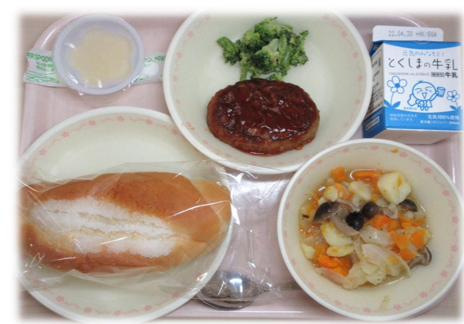
4月22日(金) シュガーパン ボイルフロッキー ハンバーグのケチャップソースかけ キャベツのポトフ とう乳プリン 牛乳