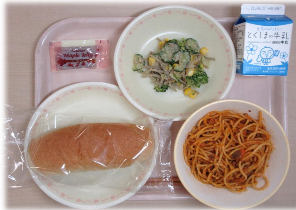
4月19日(火) 小型おからパン ミートスパゲティ ごぼうとコーンのサラダ メープルジャム 牛乳