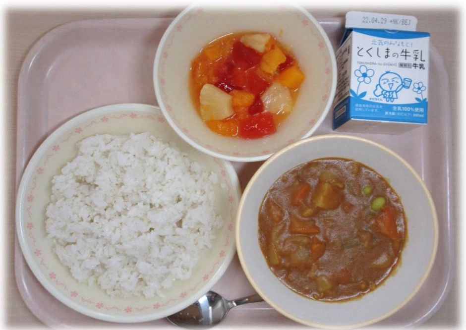
4月21日(木) ごはん ポークカレー フルーツミックス 牛乳