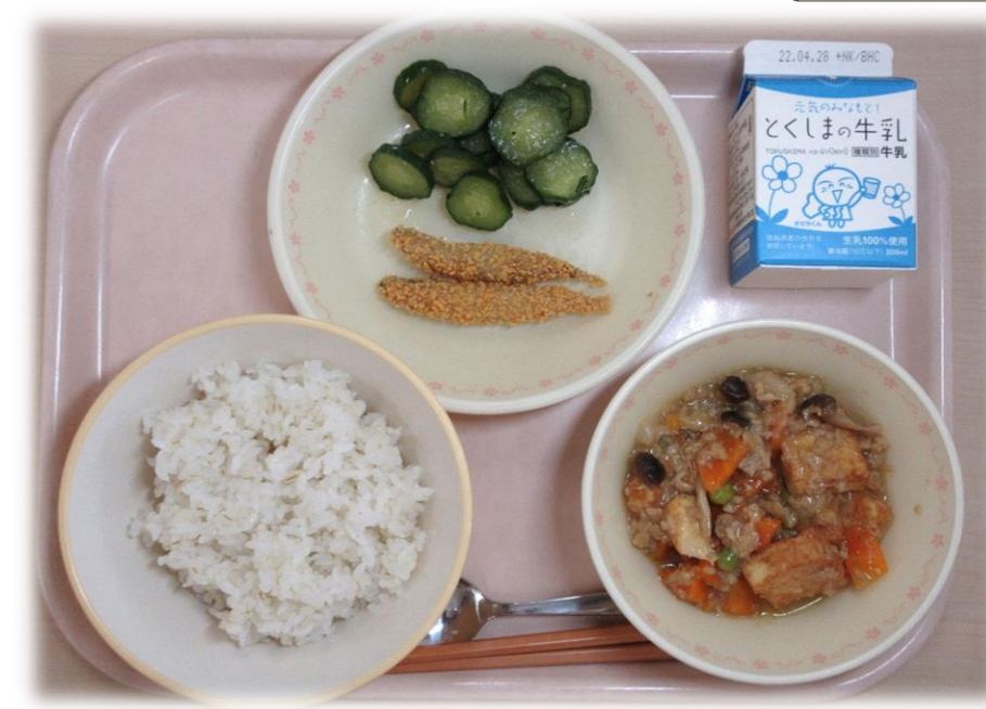
4月20日(水) ごはん きびなごフライ きゅうりのかおりづけ ジャアジャンどうぶ 牛乳