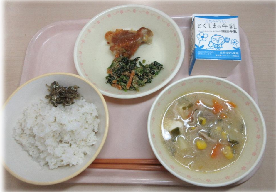
4月18日(月) ごはん とり肉のバーベキューソースかけ ごまあえ どさんこ汁 小魚つくだに 牛乳