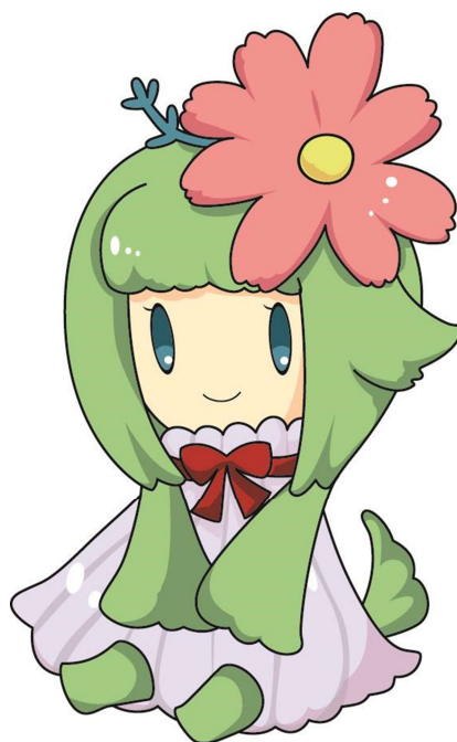
阿波市観光大使 あわみちゃん