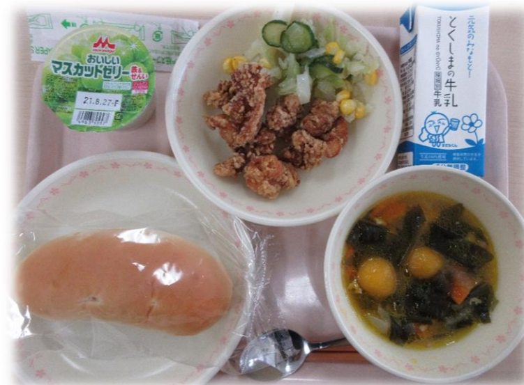
5月28日(金) 小型アップルパン かぼちゃもち入りコンソメスープ イタリアンサラダ とりのからあげ マスカルドゼリー 牛乳

給食センターでは、地元で採れた新鮮で栄養たっぷりの旬の野菜をできるだけ使用する地産地消に取り組んでいます。 また、地産地消推進は、地元の生産者の方を身近に感じ、安心できることや、輸送などでむだなエネルギーを使わないので、環境にも優しい取り組みです。