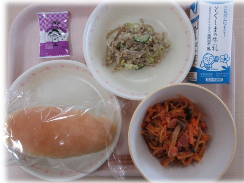
5月25日(火) 小型コッペパン スパゲティ+ポリタン ごぼうとナッツのサラダ レーズンクリーム 牛乳