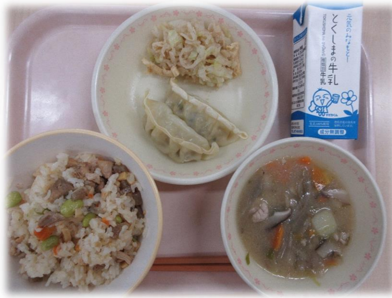
5月24日(月) たきこみごはん りょうざ キャベツのあまずあえ とん汁 牛乳