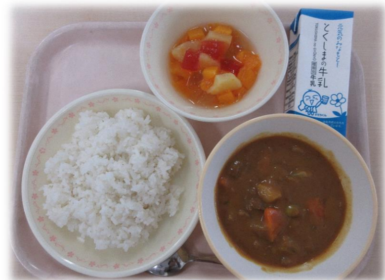
5月27日(木) ごはん ビーフカレー フルーツポンチ 牛乳