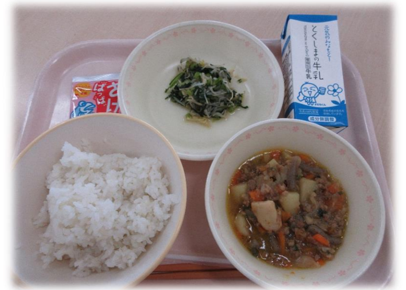
5月26日(水) ごはん ジャガイものそぼろに しょうがずあえ さけふりかけ 牛乳