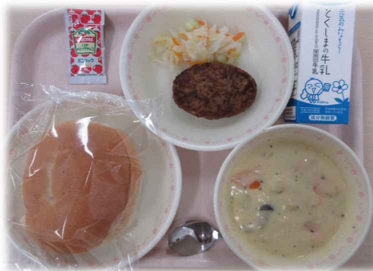
5月21日(金)【アメリカ料理 🇺🇸 】 全粒粉バンズ パックケチャップ セルフハンバーガー(ハンバーグ・ポイル野菜) ホタテのチャウダー 牛乳