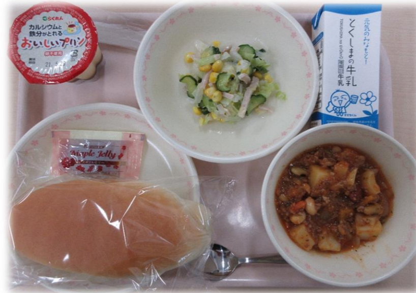
5月18日(火) コッパン チリコンカン フレンチサラダ メープルジャム フィン 牛乳