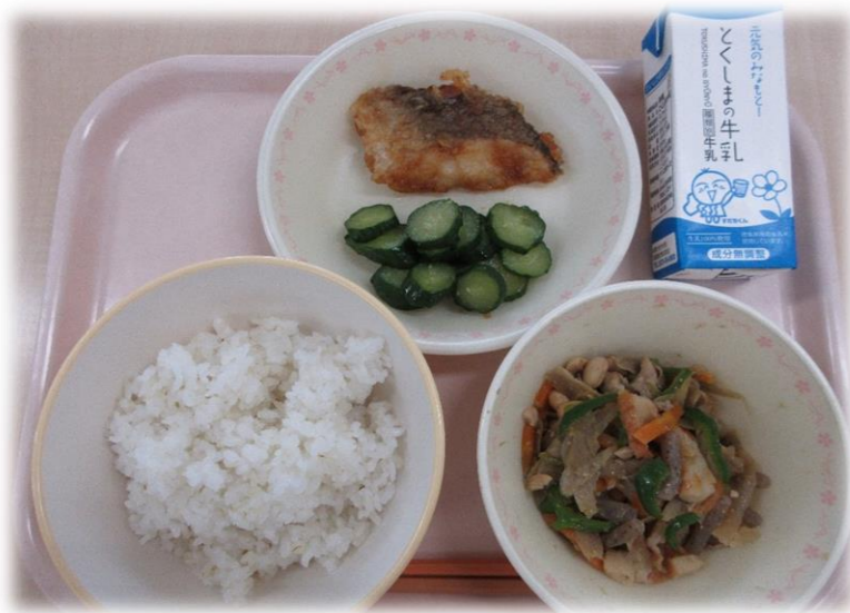
5月20日(木) ごはん あげ魚のすだち風味 きゅうりのかおいづけ 大豆入りきんぴらごぼう 牛乳