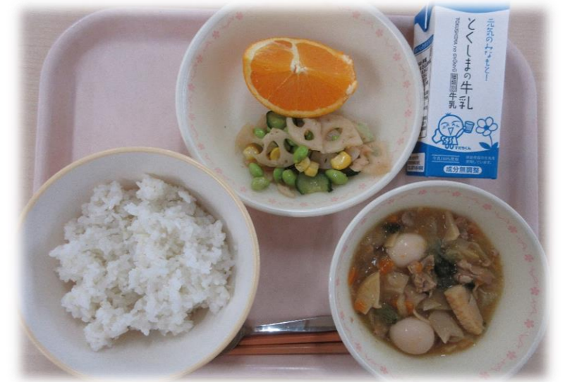
5月19日(水) ごはん ちゅうか弁 えだまめサラダ オレンジ 牛乳