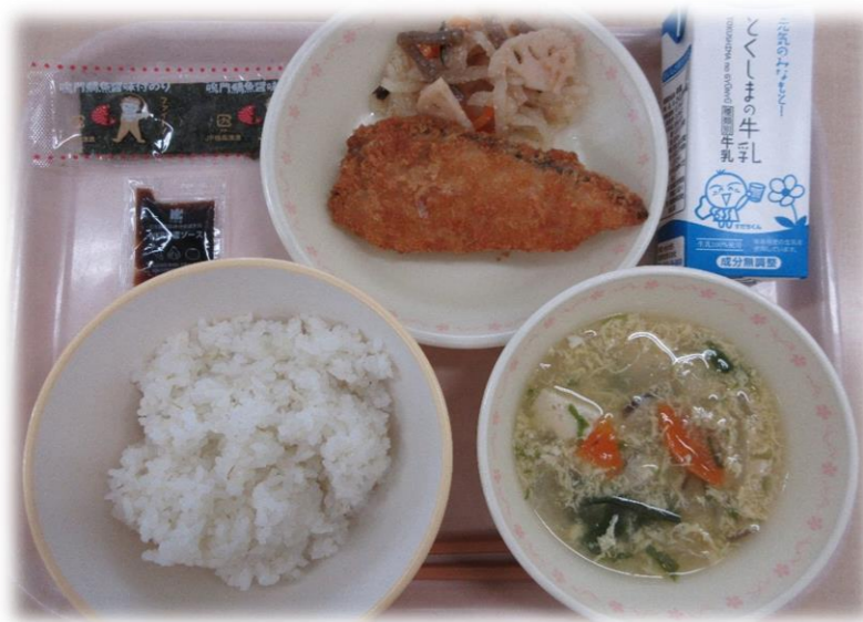
5月17日(月) ごはん さけのチーズフライ ならえ かきたま汁 たい風味あじつけのり パックソース 牛乳