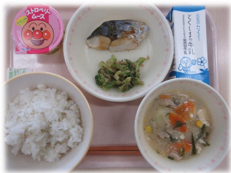
5月10日(月) ごはん どさんこ汁 さわらのてい焼き フロッコリーのおかかあえ ストロベリームース 牛乳