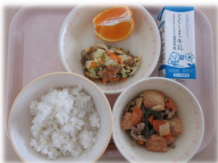
5月13日(木) ごはん ぶた肉とあつあげのみそに ちくさあえ テコポン 牛乳