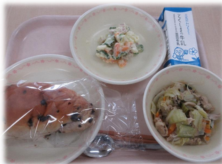
5月11日(火) チョコチップパン 野菜いため ポテトサラダ 牛乳