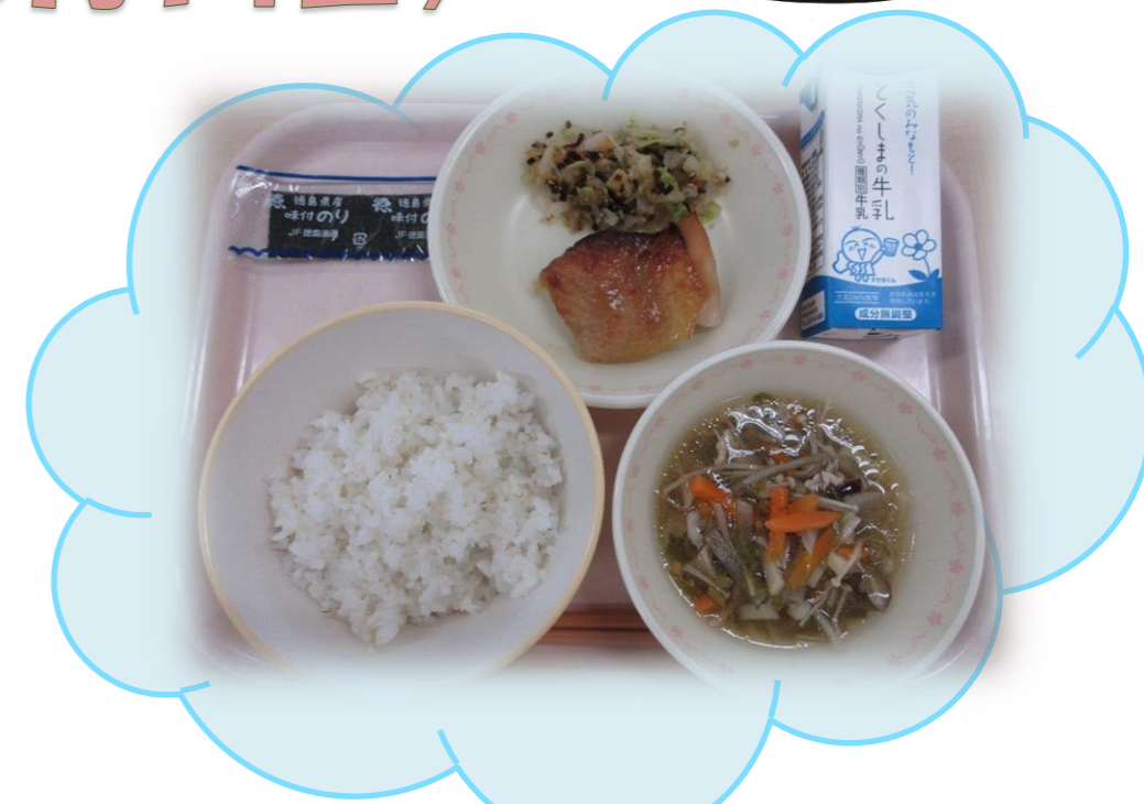
5月12日(水) ごはん あじつけのり 阿波おどいのみそ焼き こんぶあえ さわにわん 牛乳