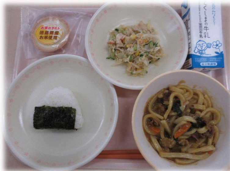
5月14日(金) のりまきおにぎり カレーうどん 野菜のアーモンドあえ お米のタルト 牛乳