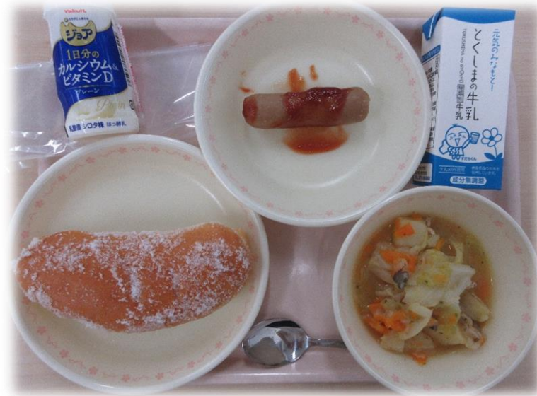
5月7日(金) あげパン キャベツのポトフ フランクフルトのケチャップソースかけ 飲むヨーグルト 牛乳

6日の「切りほし大根のツナあえ」はいかがでしたか？ 切りほし大根はその名のとおり大根を千切りにして干した乾物です。大根は天日にあてて乾燥させると、栄養価がぐんと上がります。もともと昔の人が、保存食として考えたものですが、現代社会においても栄養価の高い食品として食べられ続けられています。昔の人の知恵はすばらしいですね。