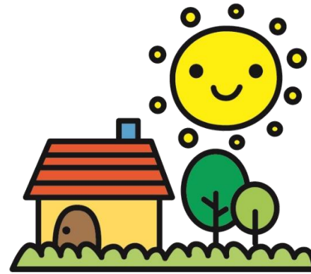
5月4日(火) みどりの日