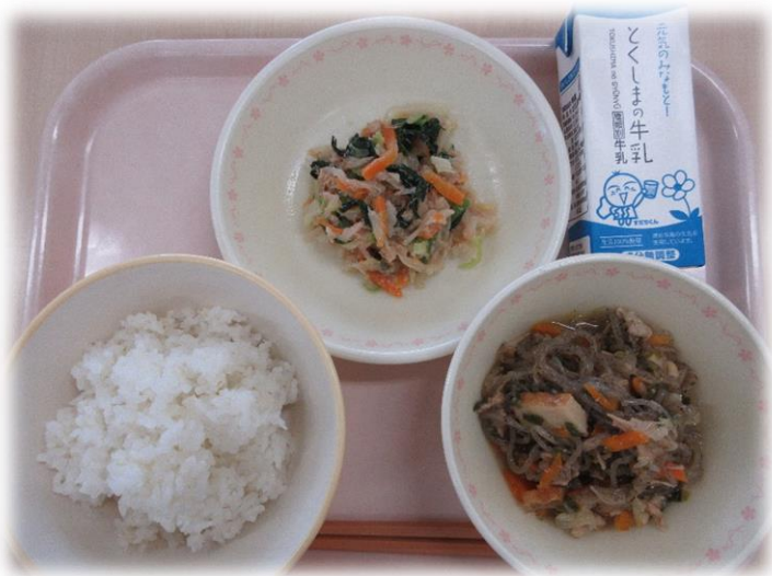
5月6日(木) ごはん ぶた丼 切りほし大根のツナあえ 牛乳