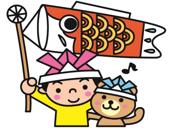
5月5日(水) こどもの日