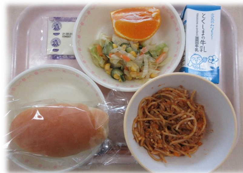
4月20日(火) 小型コッペパン ミートスパゲティ コーンサラダ テコポン パンにめるチーズ 牛乳