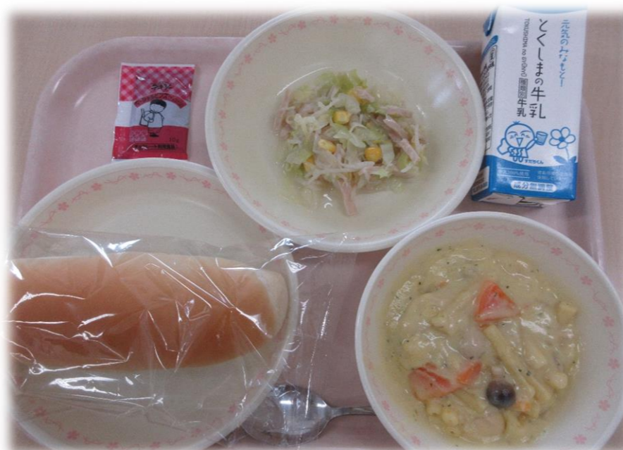
4月23日(金) 小型コッペパン マカロニのクリームに ハムサラダ チョコ大豆クリーム 牛乳