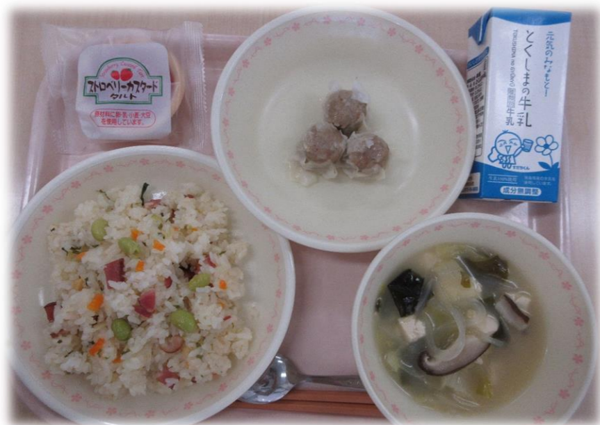
4月19日(月) チャーハン ポークしょうまい はるさめのちゅうかスープ ストロベリータルト 牛乳