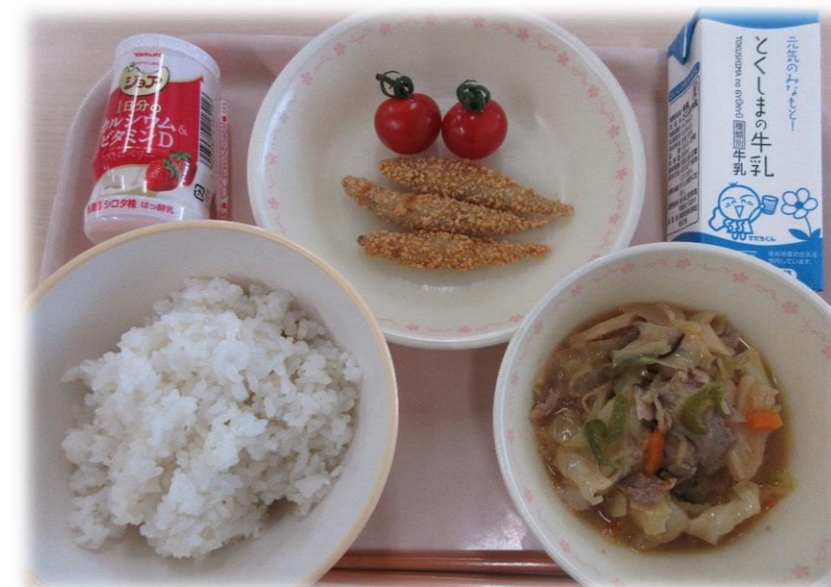
4月21日(水) ごはん きびなごフライ ホイコーロー ミニトマト 飲むヨーグルト(中のみ) 牛乳