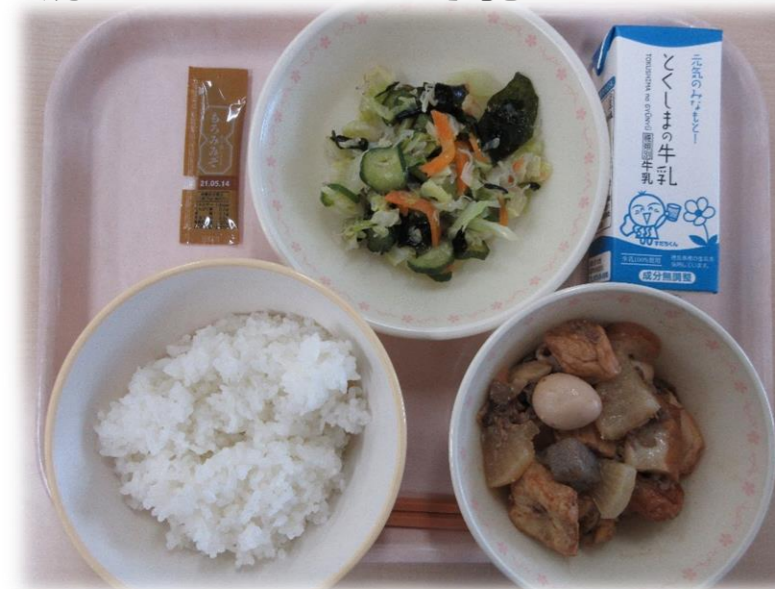
12月3日(木) ごはん おでん風にももの わかめのすだちあえ もろみみそ 牛乳