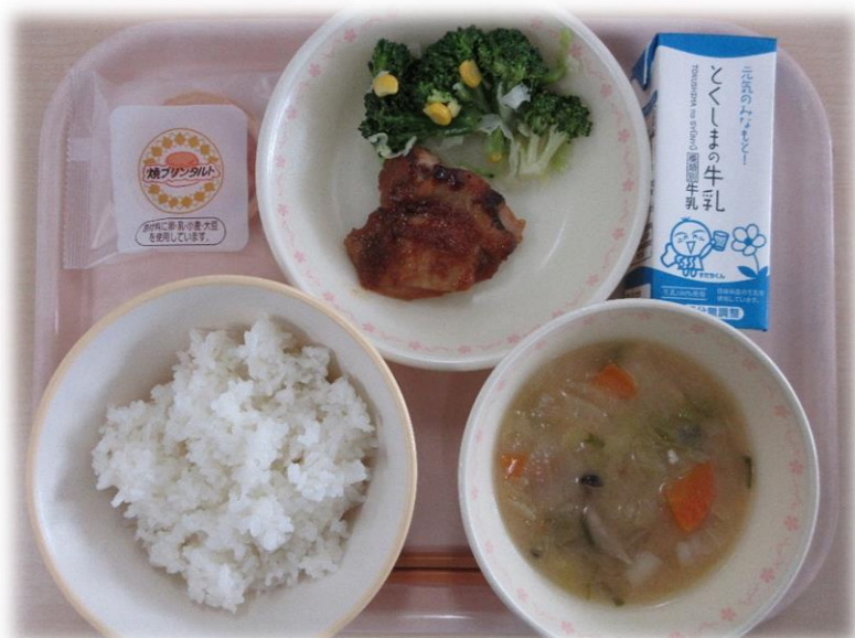
11月30日(月) ごはん とり肉のバーベキューソースかけ 野菜サラダ はくさいのみそ汁 焼きフリンタルト 牛乳