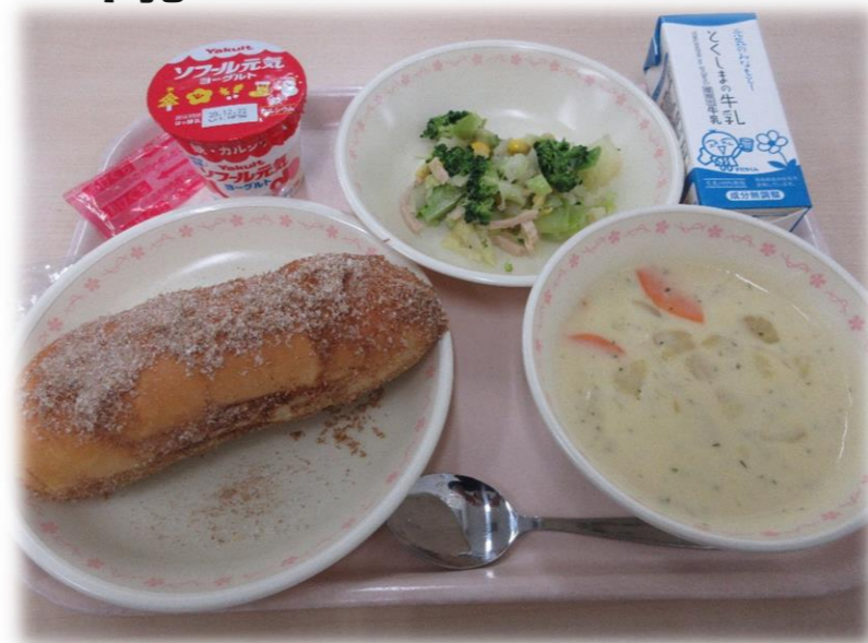
12月4日(金) キャラメルあげパン フロッコリーのちゅうかサラダ さつまいものポタージュ ヨーグルト 牛乳