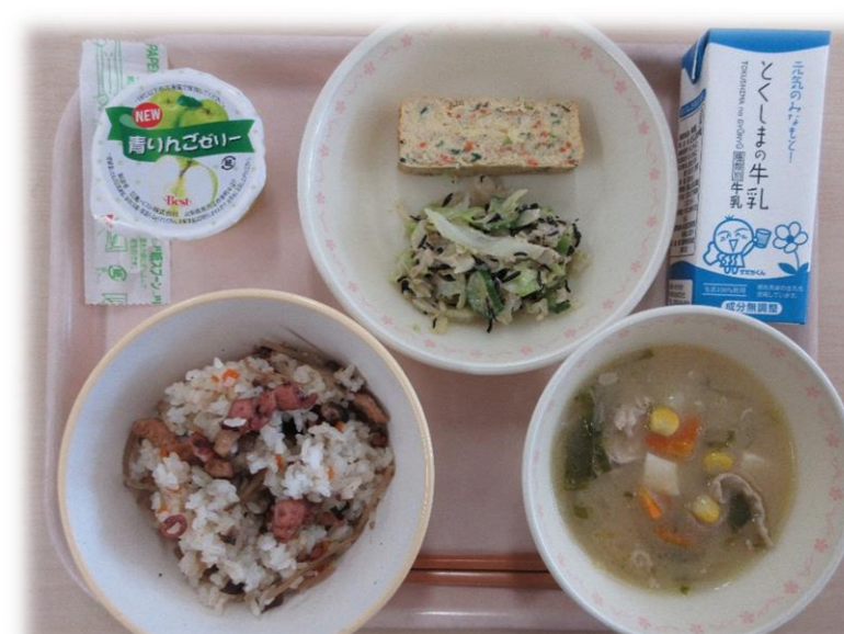
12月2日(水) たこめし 具だくさんのたまご焼き ごまドレサラダ どさんこ汁 青りんごゼリー 牛乳