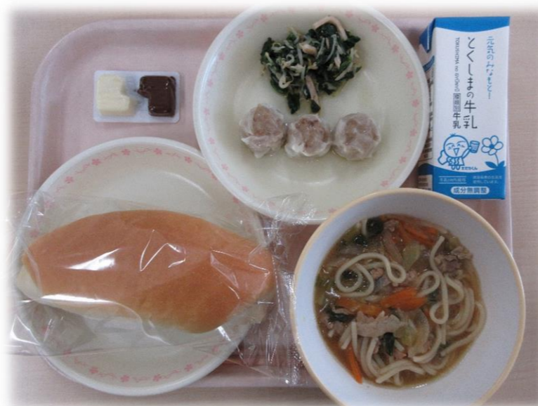
12月1日(火) コッペパン とくしまラーメン 肉しゅうまい もやしのナムル ペアチョコ 牛乳