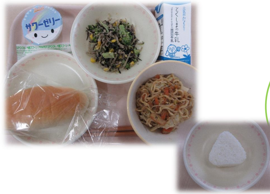
10月23日(金) おにぎり(幼・小) 小型米粉パン(中) 焼きそば ごぼうとひじきのサラダ ヨーグルトゼリー 牛乳