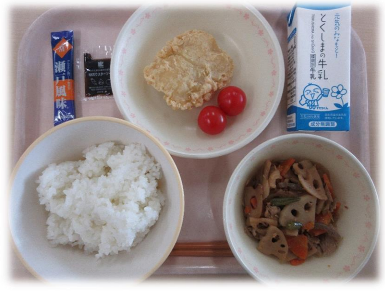
10月21日(水) ごはん はもの天ぷら れんこんきんぴら ミニトマト パックソース ふりかけ 牛乳