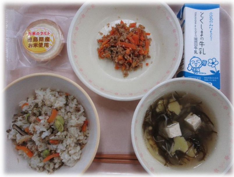
10月19日(月) じゅーしー にんじんシリシリ もずくスープ お米のタルト 牛乳