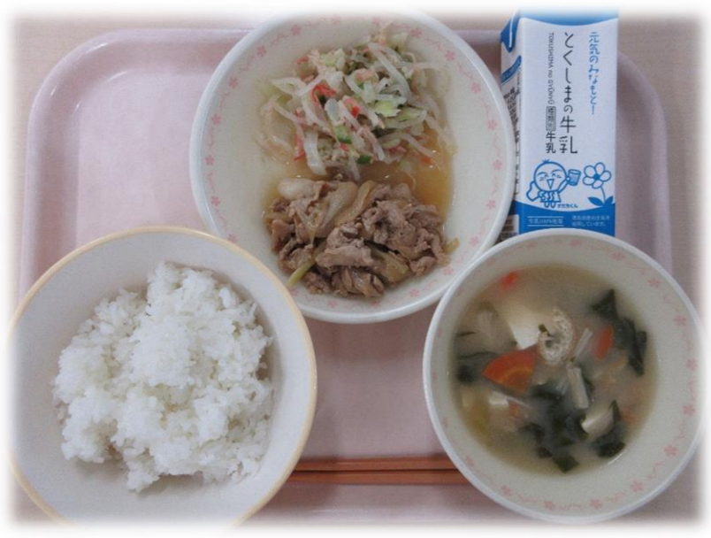
10月22日(木) ごはん ぶた肉のしょうがいため はるさめのすの物 小松菜のみそ汁 牛乳