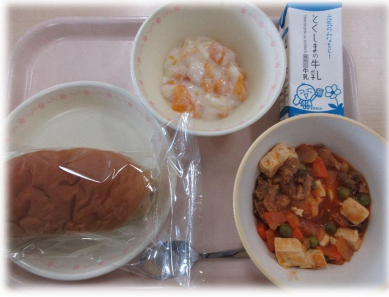
10月20日(火) こくとうパン とうふとえびのチリソースに フルーツババロア 牛乳