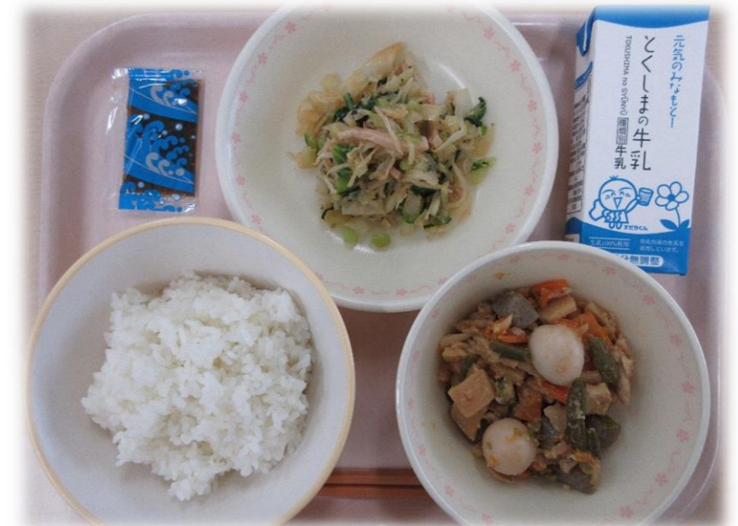
9月16日(水) ごはん ぶた肉とこんにゃくのみそに ぽんずあえ のりつくだに 牛乳