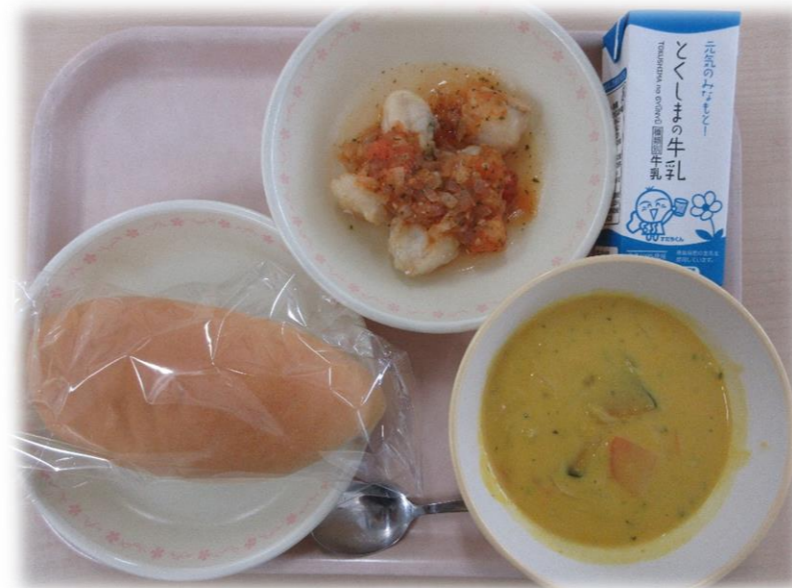
9月18日(金) コッペパン 白身魚のフロヴァンス風 パンプキンポタージュ 牛乳