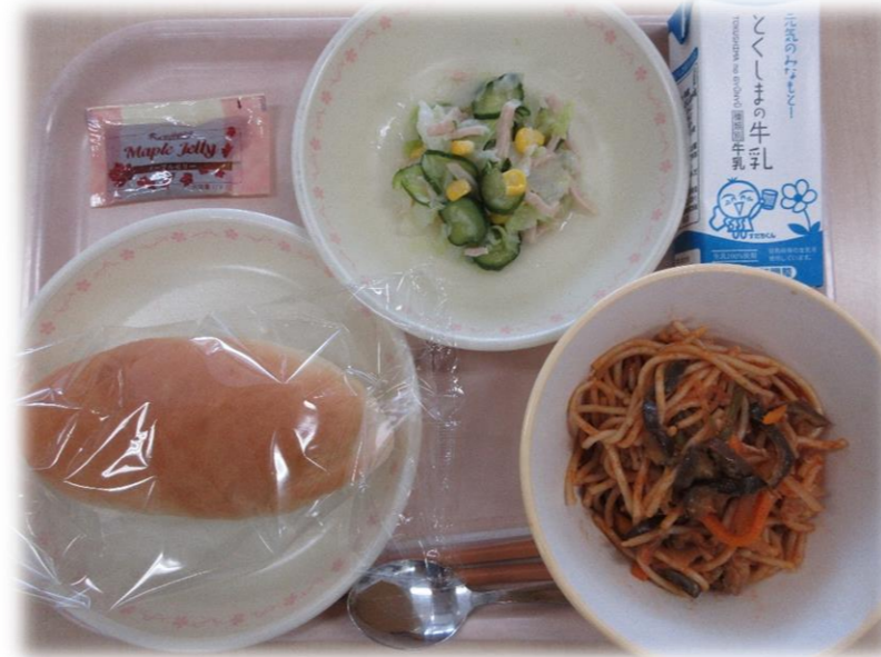
9月15日(火) 小型コッペパン なす入りポリタン フレンチサラダ メープルジャム 牛乳