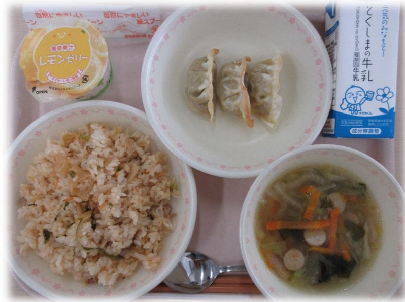
9月14日(月) キムタクごはん ぎょうざ 春雨スープ レモンゼリー 牛乳