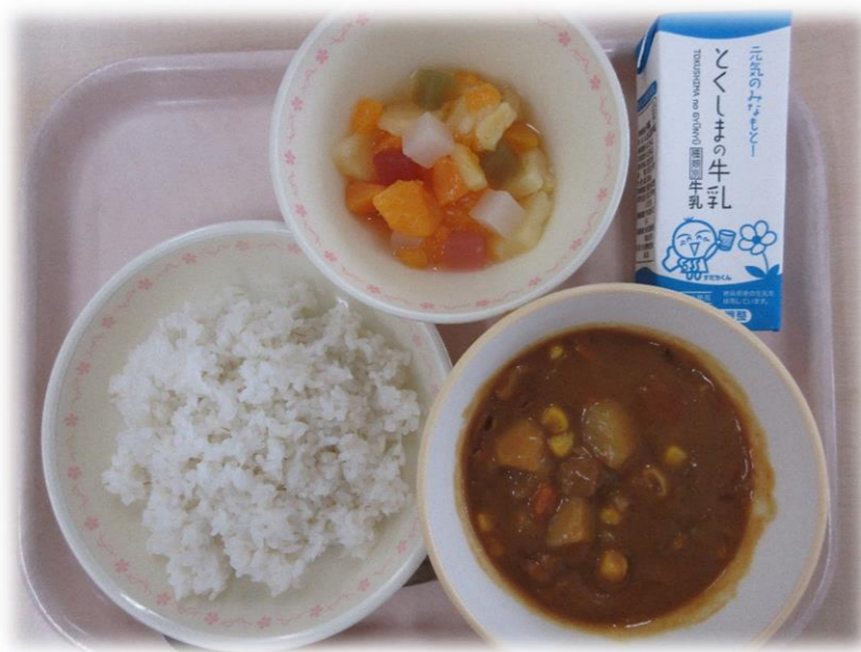
9月17日(木) コーンカレー (麦ごはん) フルーツポンチ 牛乳