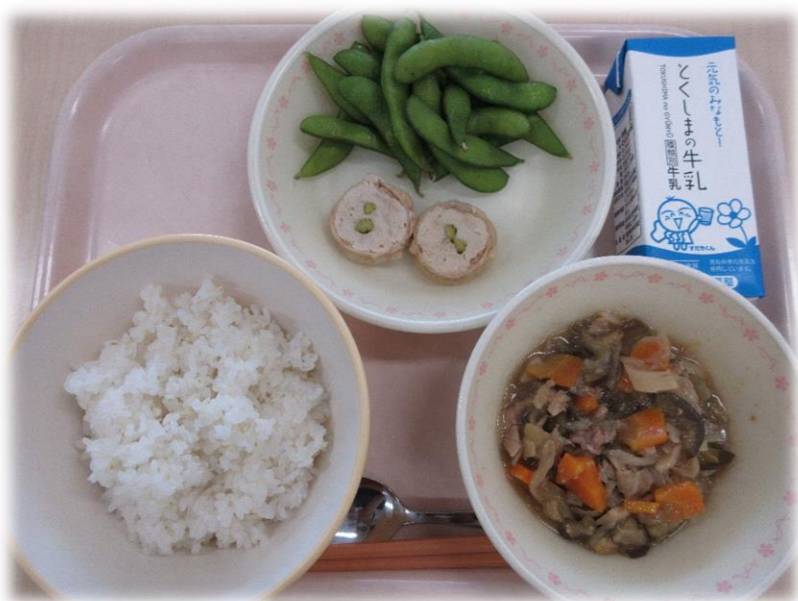
8月31日(月) 麦ごはん あわっこどん とり肉のアスパラまき えだまめ 牛乳