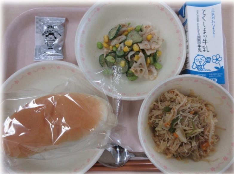
9月4日(金) 小型コッパン 焼きビーフン れんこんとえだまめのサラダ 黒豆きなこクリーム 牛乳

給食センターでは、台風や大雪時の献立変更等に備え、レトルトカレーや米、炊き込みわかめなどを備蓄しています。おうちでも、もしもの時に備えて、最低でも3日分、できれば1週間程度の食品を備えましょう。