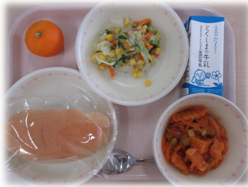
9月1日(火) コッパン ウィナーとポテトのケチャップに コーンサラダ れいとうみかん 牛乳