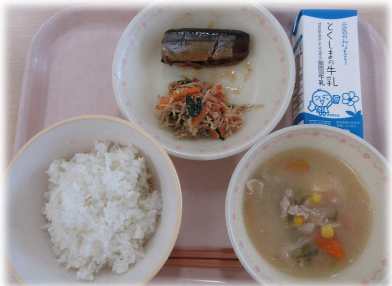
9月3日(木) ごはん さんまのかぼすレモンに 野菜のアーモンドあえ どさんこ汁 牛乳