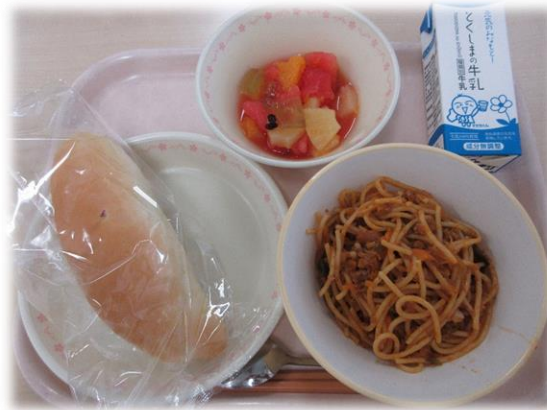
7月21日(火) 小型なると金時パン なす入りミートスパゲッティ すいかのマスカットゼリーあえ 牛乳