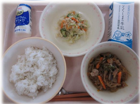
7月20日(月) 麦ごはん Awa ベジフルコギ丼 ちゅうかさラダ 飲むヨーグルト(中のみ) 牛乳