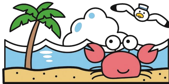
7月24日(金) スポーツの日