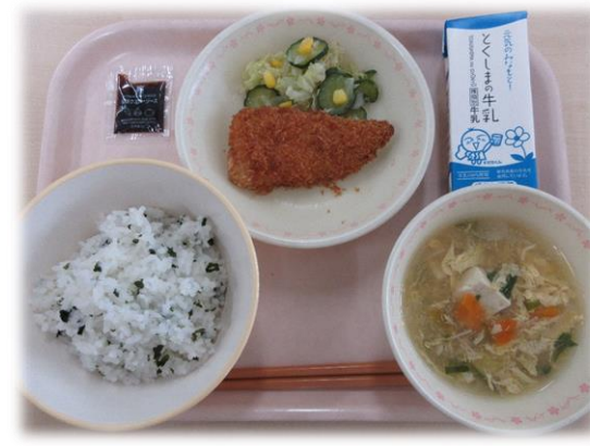
7月22日(水) わかめごはん あじフライ イタリアンサラダ 村雲汁 パックソース 牛乳