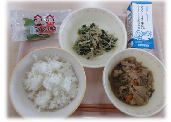
6月3日(水) ぶた丼 小松菜のちりめんあえ かしわもち 牛乳