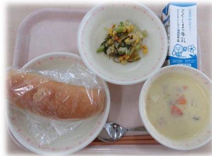
6月5日(金) きなこあげパン クリームシチュー Awaのカラフルこんぶ 牛乳