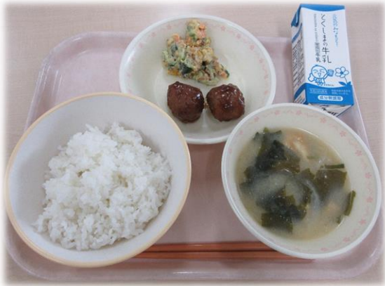
6月1日(月) ごはん 肉だんご かぼちゃのアーモンドサラダ みそ汁 牛乳