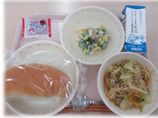
6月2日(火) コッパン 焼きビーフン まめまめサラダ イチゴジャム 牛乳