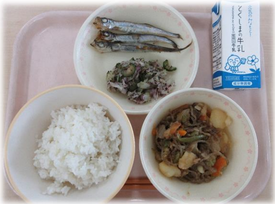
6月4日(木) ごはん 焼きししゃも キャベツのゆかりあえ 肉じゃが 牛乳