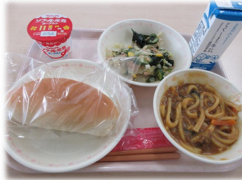
5月29日(金) 小型コッペパン カレーうどん わかめとコーンとツナのサラダ ヨーグルト 牛乳

給食センターでは、地元で採れた新鮮で栄養たっぷりの旬の野菜をできるだけ使用する地産地消に取り組んでいます。 また、地産地消推進は、地元の生産者の方を身近に感じ、安心できることや、輸送などでむだなエネルギーを使わないので、環境にも優しい取り組みです。