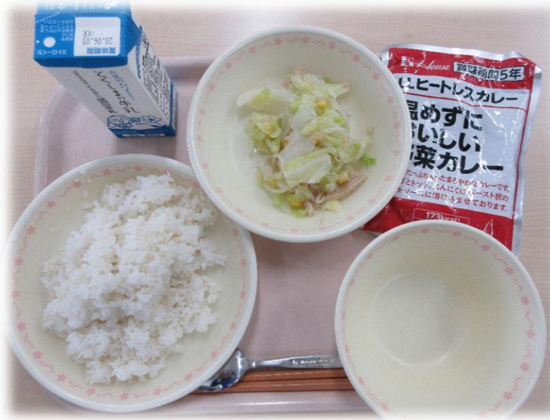
5月26日(火) ごはん 非常食カレー ハムサラダ 牛乳