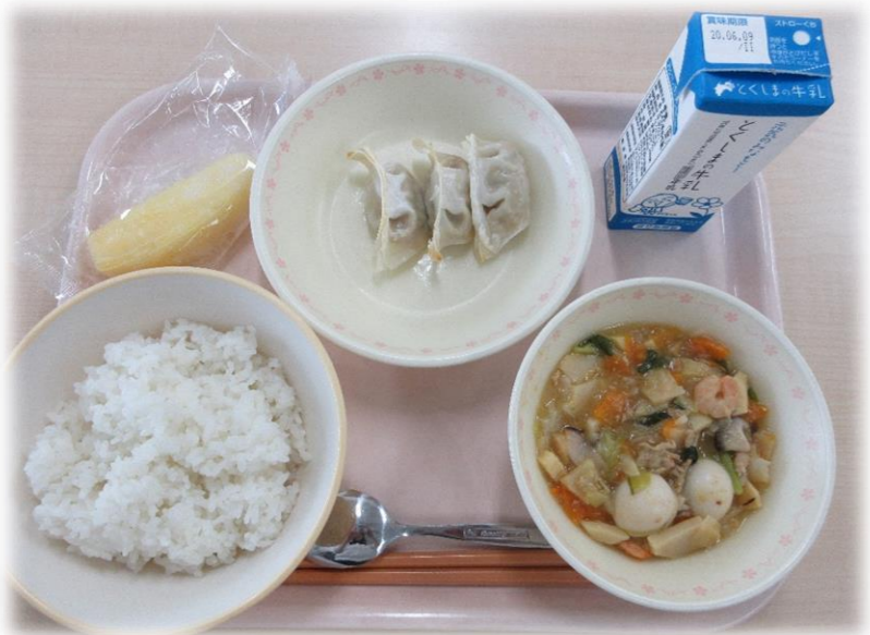
5月28日(木) ごはん 八宝菜 ぎょうざ パイン 牛乳