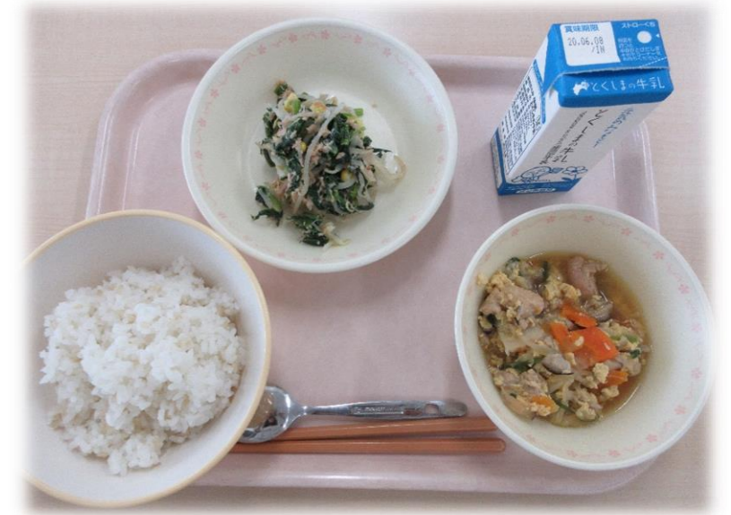
5月27日(水) もち玄米入りごはん 親子丼 ツナずあえ 牛乳