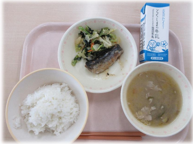
5月25日(月) ごはん いわしのしょうがに キャベツのごまあえ ぶた汁 牛乳