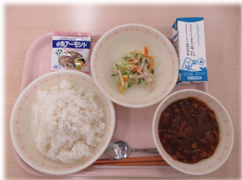
7月8日(月) ハヤシライス コールスローサラダ 小魚アーモンド 牛乳