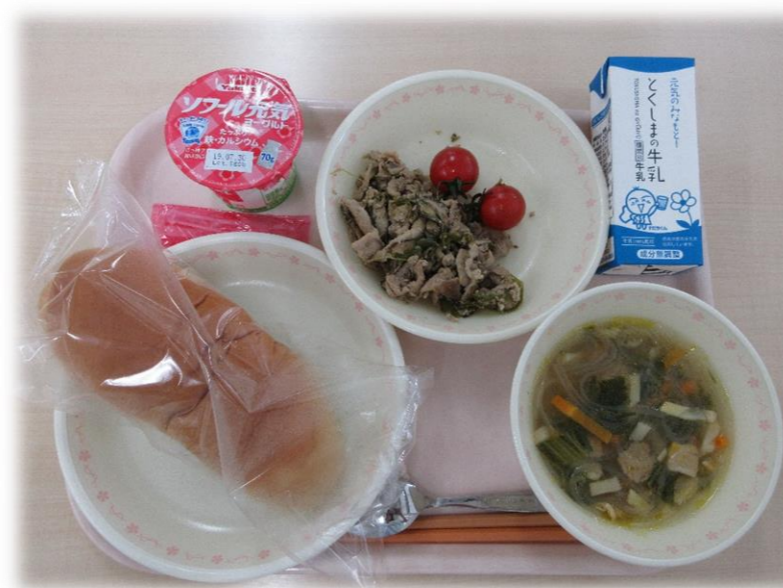
7月12日(金) キャラメルパン 豚(とん)ゴマシーピー 五目スープ ミニトマト 牛乳 ヨーグルト