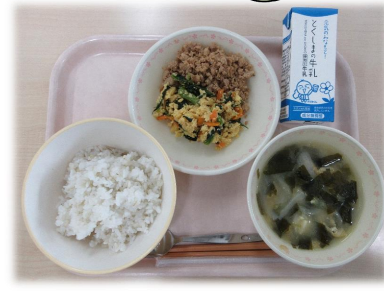
7月10日(水) 三色丼(麦ごはん) みそ汁 牛乳