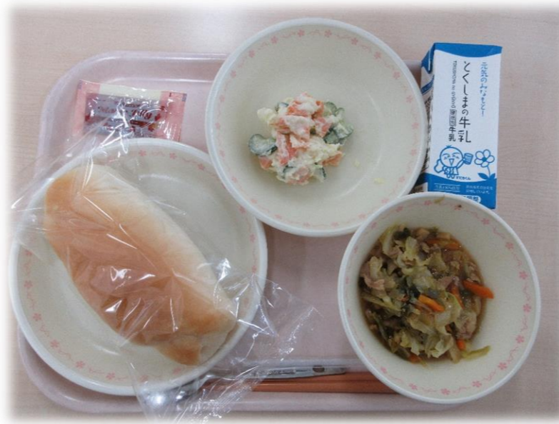
7月9日(火) コッパン ホイコウロウ ポテトサラダ 牛乳 メープルジャム