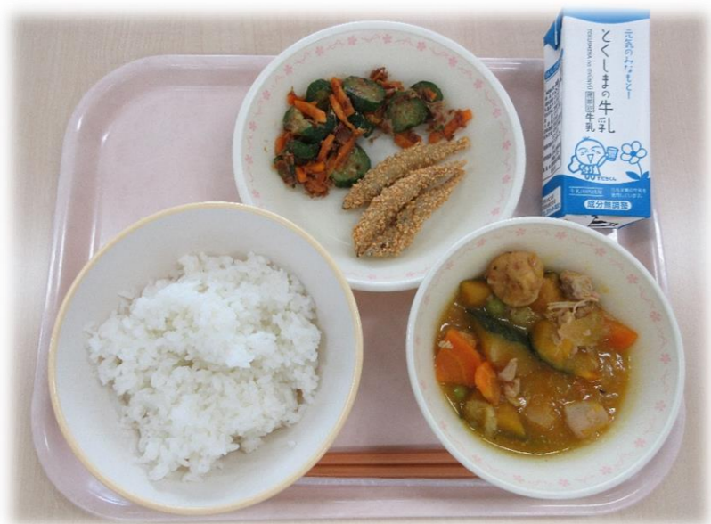
7月11日(木) ごはん かぼちゃの煮物 きびなごフライ きゅうりの土佐漬け 牛乳