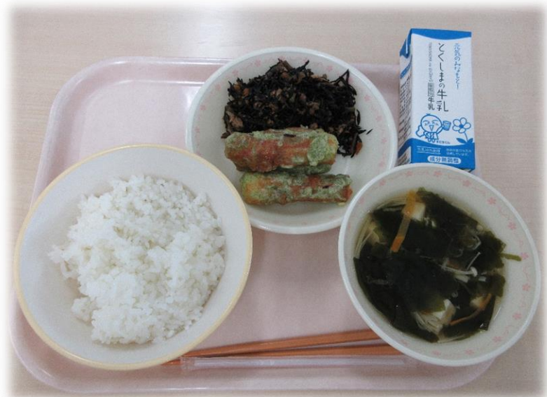
7月4日(木) ごはん ちくわのいそべあげ ひじきとツナの炒め物 すまし汁 牛乳