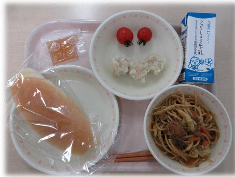
7月2日(火) 小型パン 焼きスパゲティ えびシューマイ リンゴジャム ミニトマト 牛乳