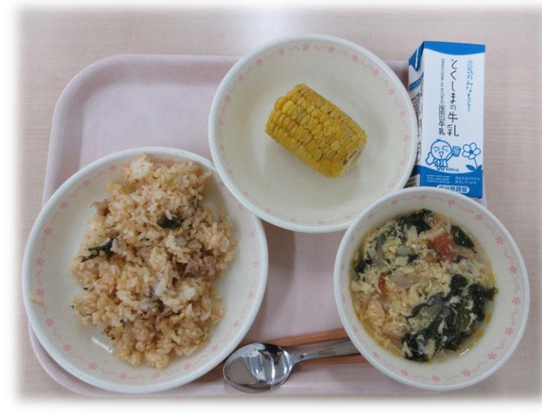
7月3日(水) 豚キムチチャーハン トマトと卵のスープ とうもろこし 牛乳