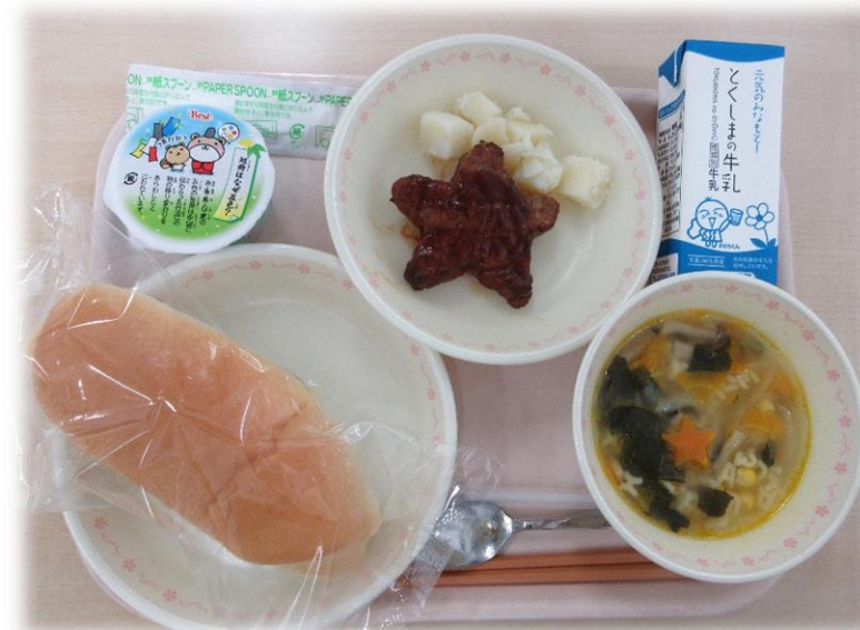
7月5日(金) コッパン ハンバーグ ABCスープ こぶきいも あまの川ゼリー 牛乳