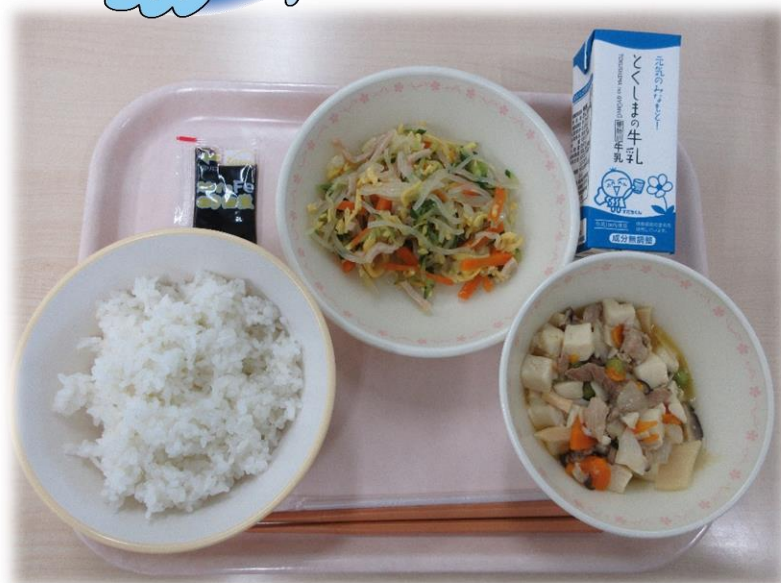
7月1日(月) ごはん とうふの中華煮 ばんさんすう のいつくだ煮 牛乳