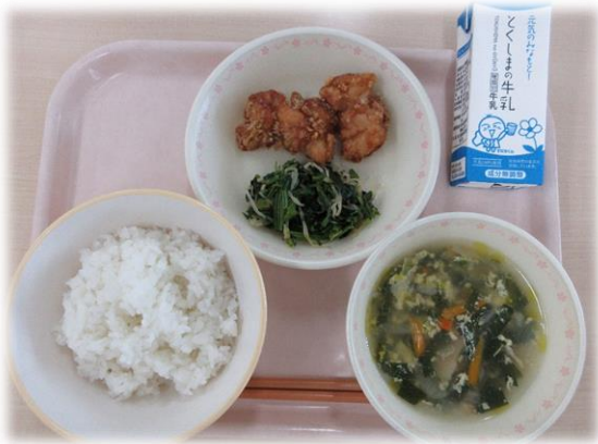
6月6日(木) ごはん とりのからあげ ほうれん草のおひたし にらたまスープ 牛乳