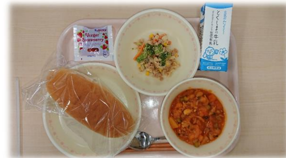
6月7日(金) コッペパン ポークビーンズ ブロッコリーのサラダ いちごジャム 牛乳