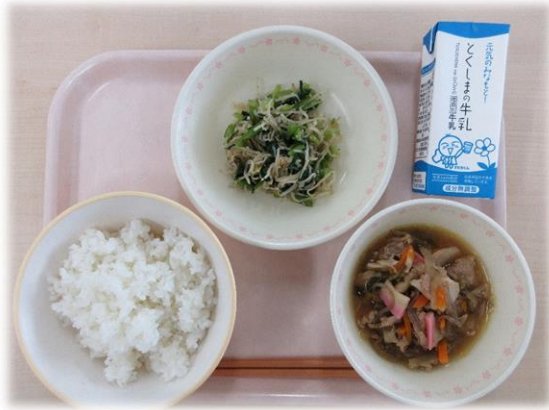
6月3日(月) ぶたどん 小松菜のちいめんあえ 牛乳