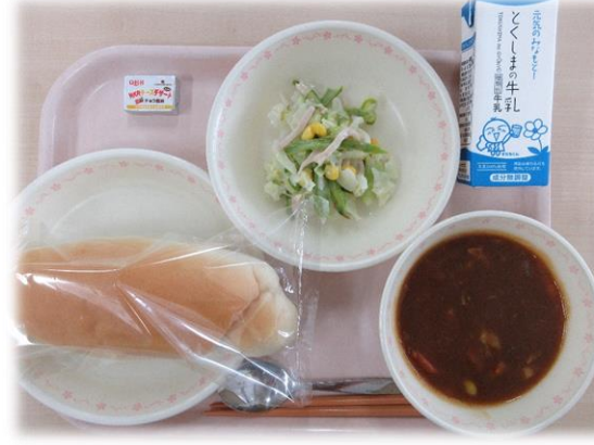
6月4日(火) コッペパン ビーフシチュー アスパラサラダ クリームチーズ(チョコ) 牛乳