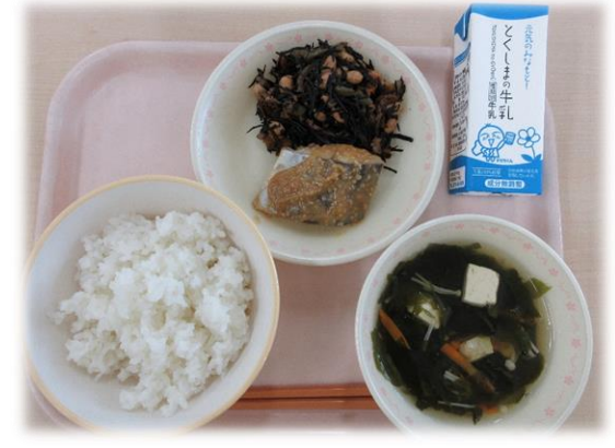
6月5日(水) ごはん さわらのごまみそかけ ひじきと大豆の煮物 すまし汁 牛乳