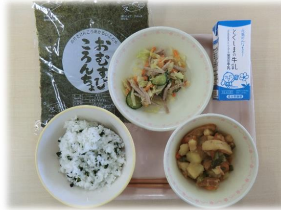
5月8日(水) わかめごはん いかと厚揚げの煮物 ごまずあえ おにぎりのり、牛乳