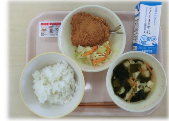
5月9日(木) ごはん あじフライ ゆで野菜 若竹汁 マヨ&ソース 牛乳