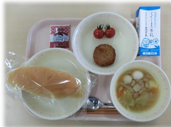
5月10日(金) コッペパン とり肉と野菜のつくね キャベツとベーコンのスープ ミニトマト チョコペースト 牛乳