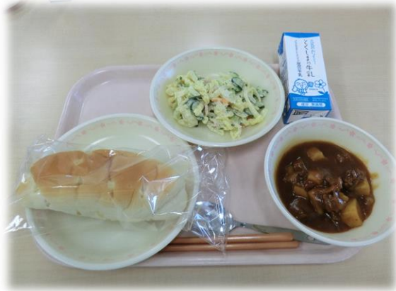
5月7日(火) パンパン ビーフシチュー マカロニサラダ 牛乳