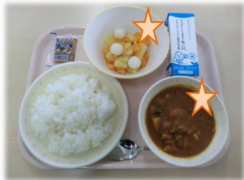
3月5日(月) カレーライス フルーツ白玉 福伸漬け 牛乳