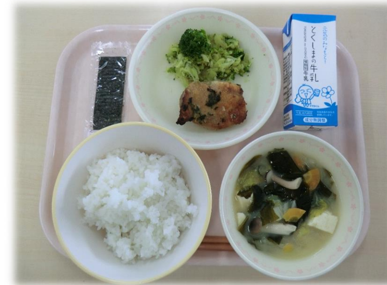
3月7日(水) ごはん 鶏肉の香味焼き そえ野菜 みそ汁 味付け海苔 牛乳