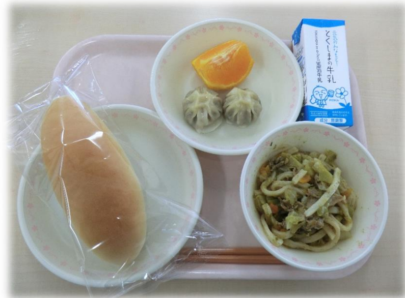
3月6日(火) 小型パン 焼うどん ターサイパオズ テコボン 牛乳