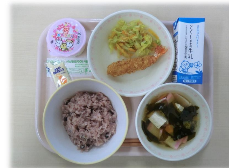
3月8日(木) 赤飯 すまし汁 えびフライ そえ野菜 タルタルソース お祝いいちごゼリー 牛乳