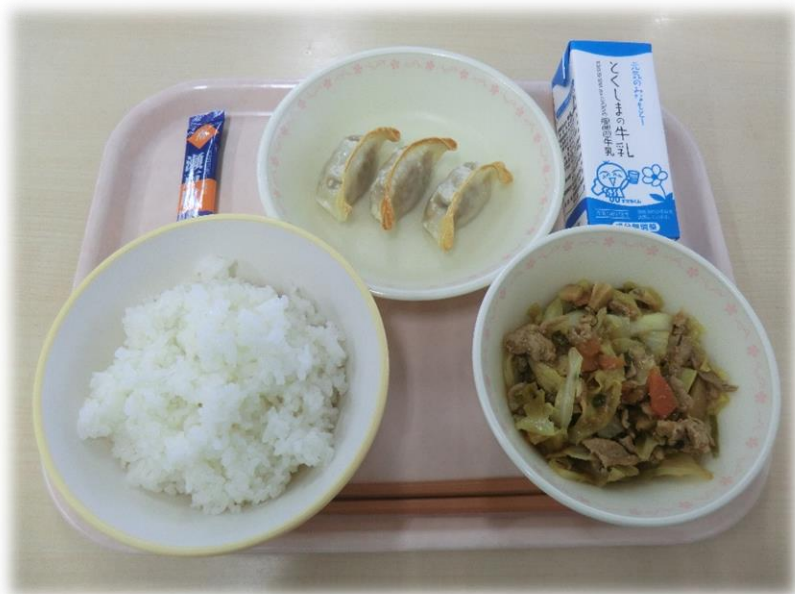
2月5日(月) ごはん ホイコウロウ ぎょうざ ふいかけ 牛乳