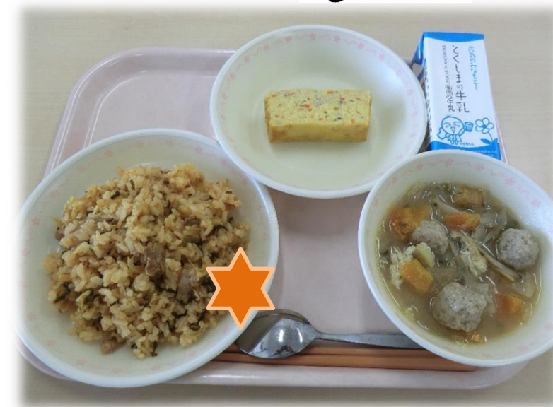
2月7日(水) 豚キムチチャーハン 五目厚焼き玉子 鶏つくねのみそ汁 牛乳