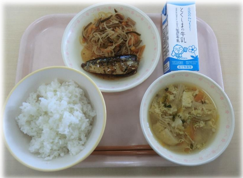
2月8日(木) ごはん さんまのかんろ煮 かきたま汁 しらたきのピリ辛いため 牛乳