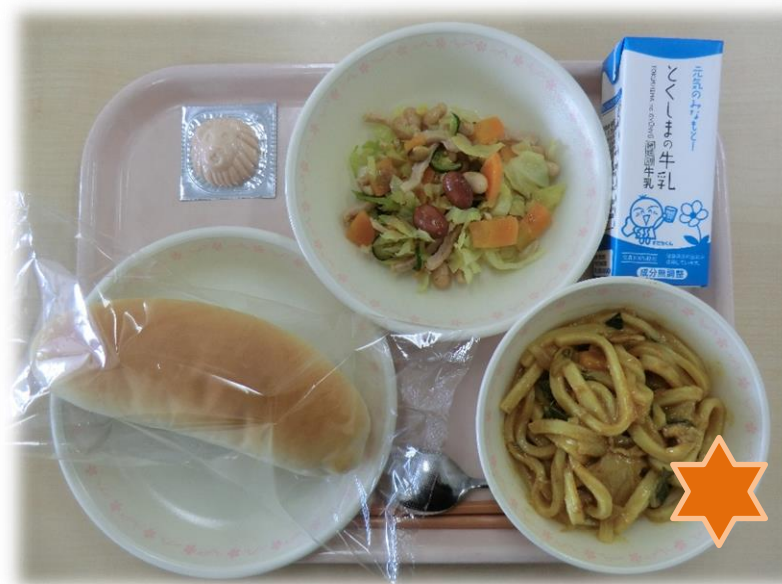
2月9日(金) 牛乳 小型パン カレーうどん 牛乳 まめまめサラダ 型抜きレアチーズケーキ