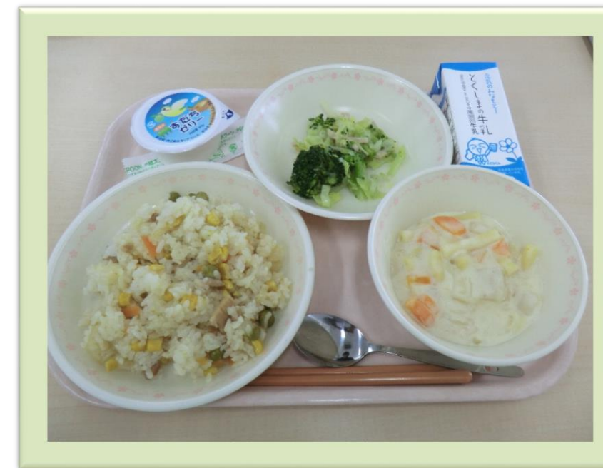
1月24日(水) Awa産Our消の日 ピラフ かぶとマカロニのクリーム煮 フロッコリーのサラダ すだちゼリー 牛乳