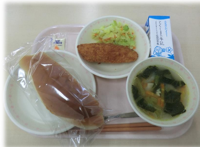
1月26日(金) 黒糖パン 鮭のチーズフライ ゆで野菜 ABCスープ 牛乳