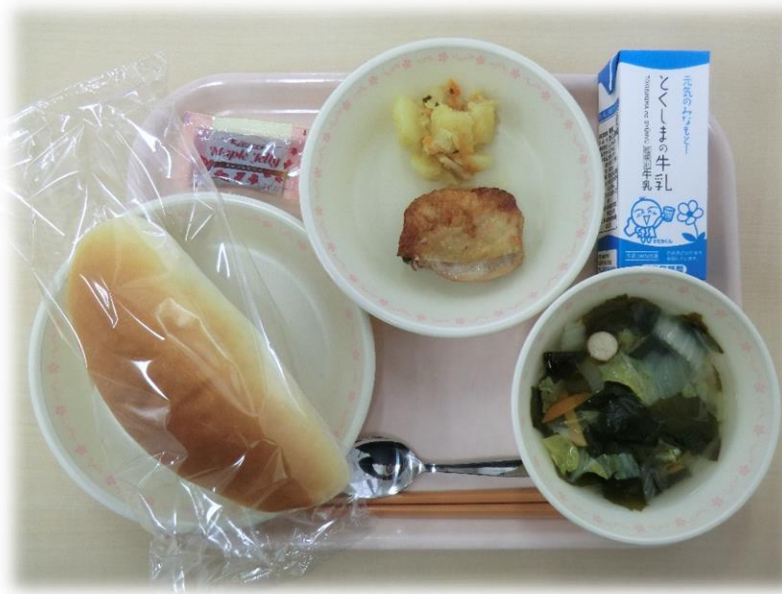
1月23日(火) コッパン コンソメスープ 照り焼きチキン ジャーマンポテト メープルジャム 牛乳