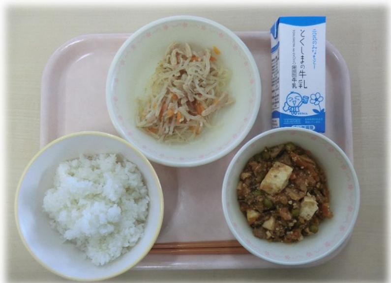
1月25日(木) ごはん マーボー豆腐 もやしのみそ汁 牛乳