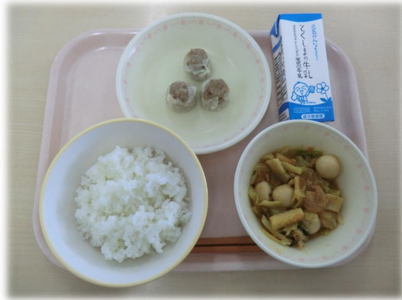
1月15日(月) ごはん 八宝菜 蒸ししょうまい 味付け海苔 牛乳