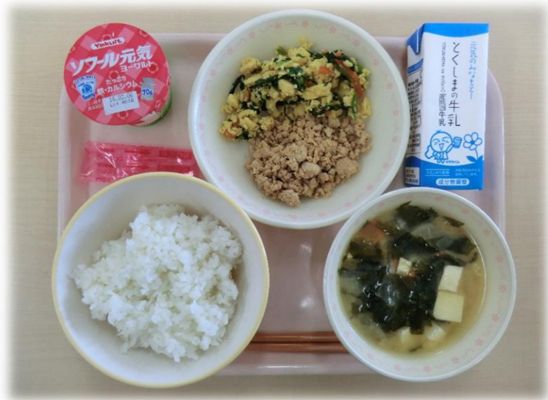
1月18日(木) 三食丼 みそ汁 ヨーグルト 牛乳