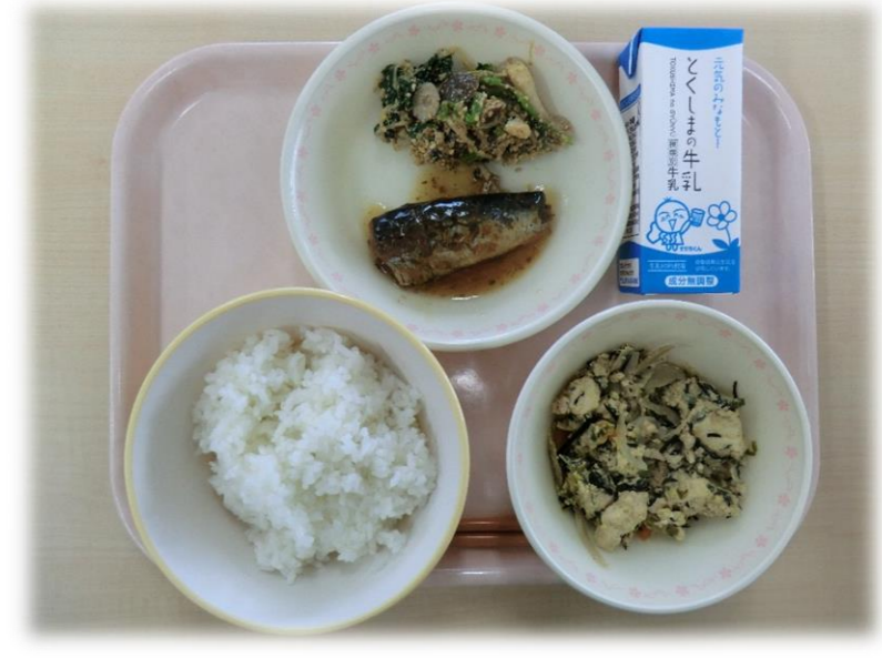
1月17日(水) ごはん いわしの梅煮 こまつなのごまあえ 卵と豆腐のいり煮 牛乳