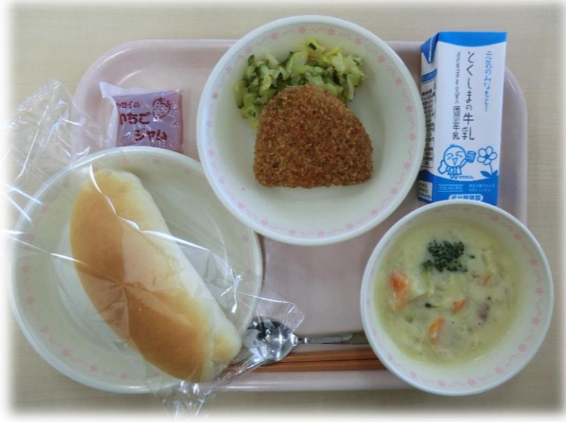
1月16日(火) コッペパン かぼちゃフライ そえ野菜 クリームシチュー 牛乳