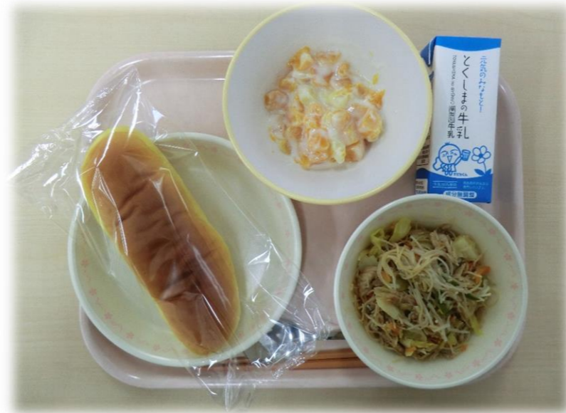
1月19日(金) かぼちゃパン 焼ビーフン フルーツヨーグルト 牛乳