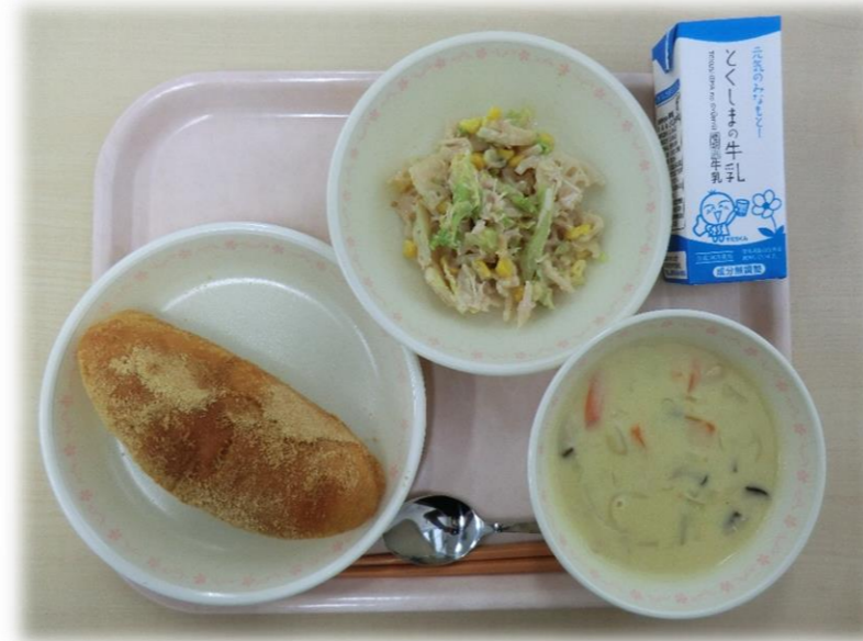
11月28日(火) きなこあげパン きのこのクリームシチュー れんこんサラダ 牛乳