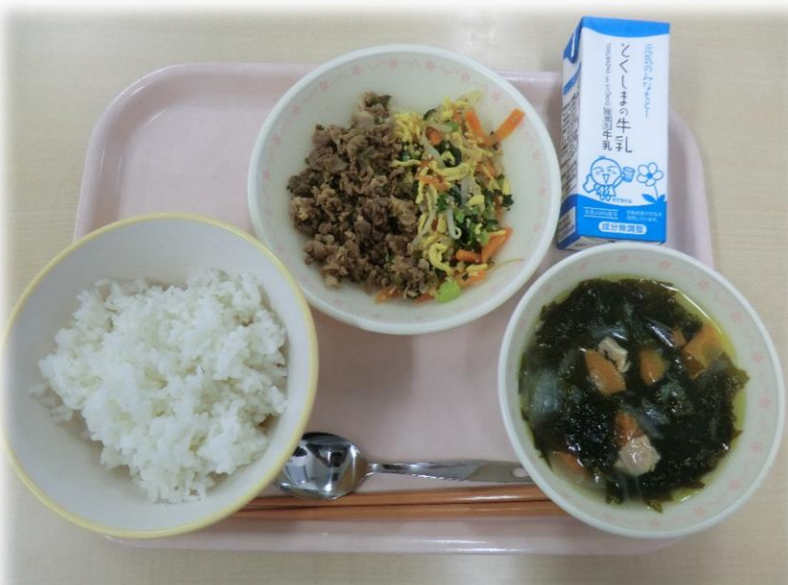
11月30日(木) ビビンバ わかめスープ 牛乳