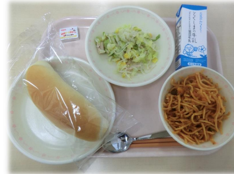
12月1日(金) 小型パン スパゲティ・ミートソース 牛乳 ハムサラダ ミニクリームチーズ(チョコ)