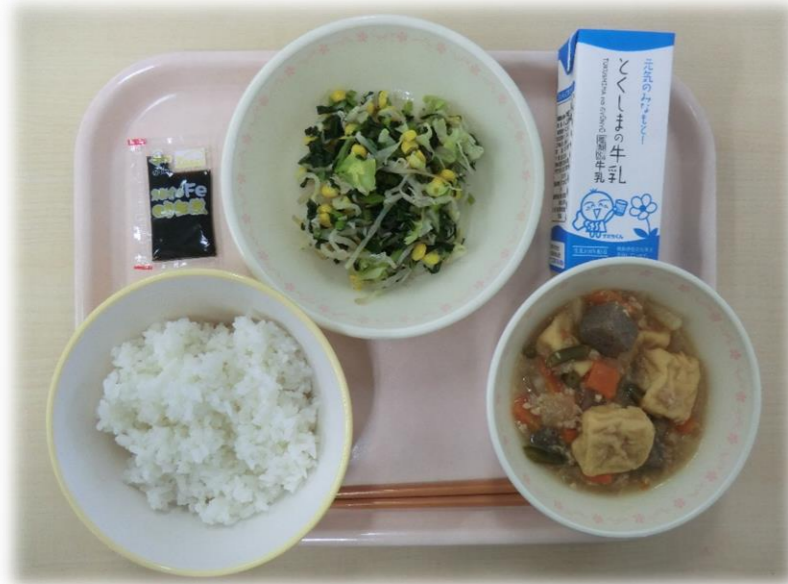
11月27日(月) ごはん あつあげとだいこんのみそ煮 じゃこサラダ のいつくだに 牛乳