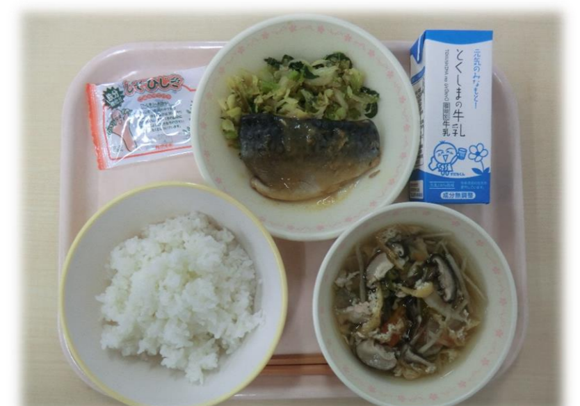
11月29日(水) ごはん さばのみそ煮 沢煮わん キャベツのごま和え しそひじき 牛乳