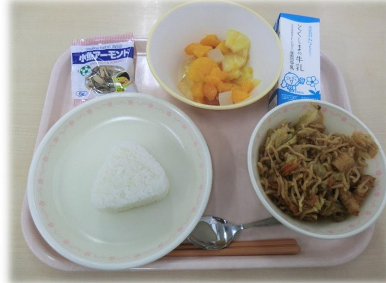
11月17日(金) おにぎり いか焼きそば フルーツポンチ 小魚のアーモンド和え 牛乳