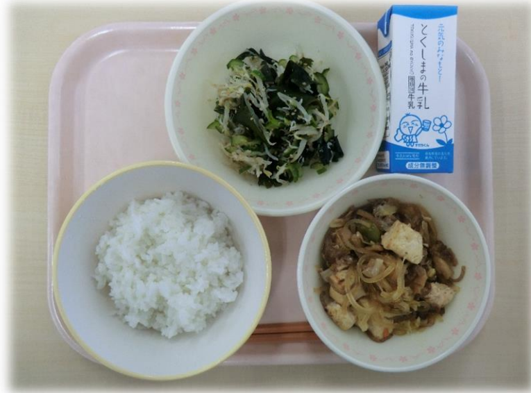
11月13日(月) ごはん すき焼き わかめの酢の物 牛乳