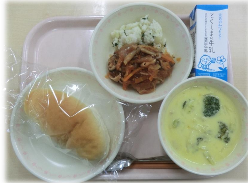
11月14日(火) コッパン ハンバーグのきのごソース こぶきいも コーンポタージュ 牛乳