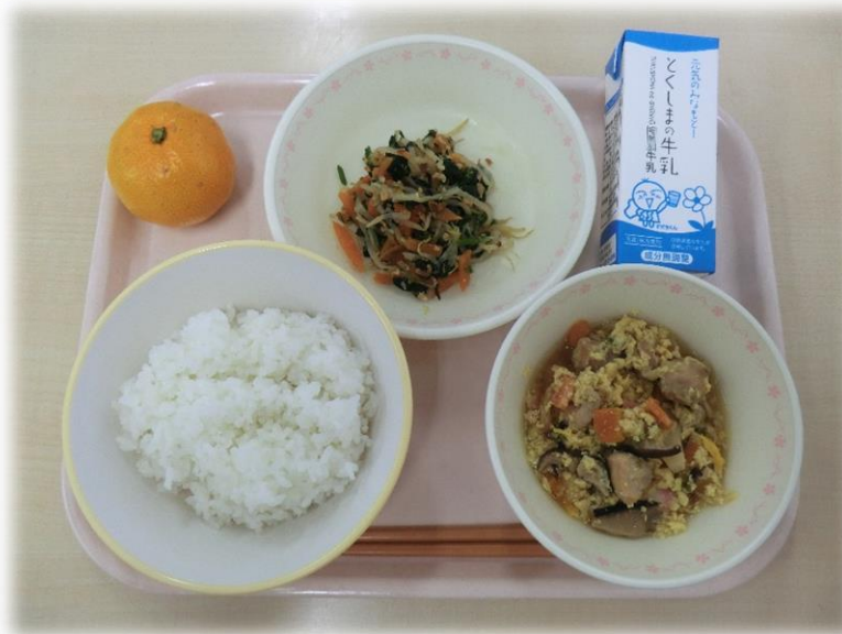
11月16日(木) 親子丼 野菜のアーモンド和え みかん 牛乳