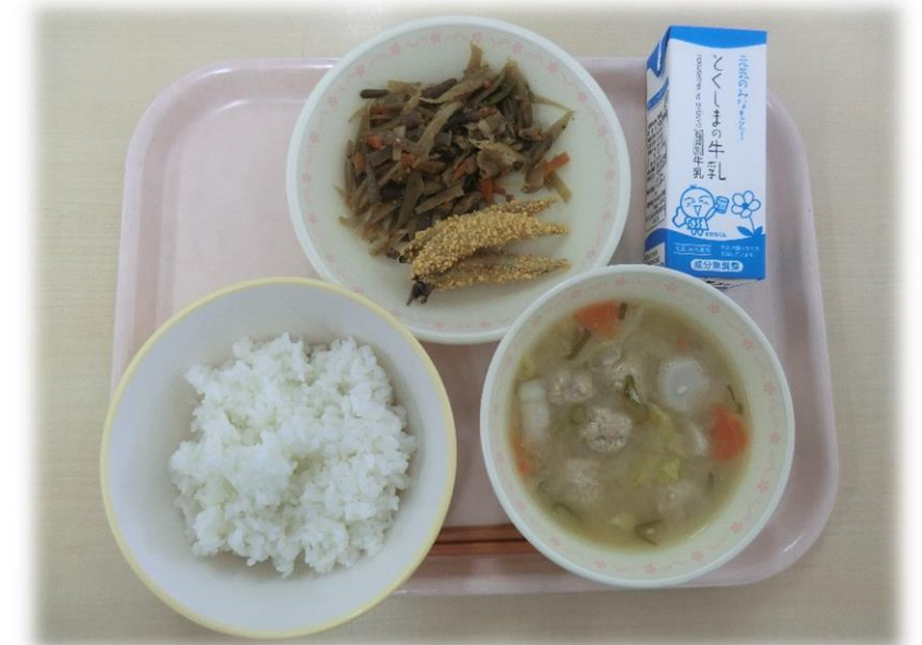
11月15日(水) ごはん きびなごフライ きんぴらごぼう 鶏つくねのみそ汁 牛乳