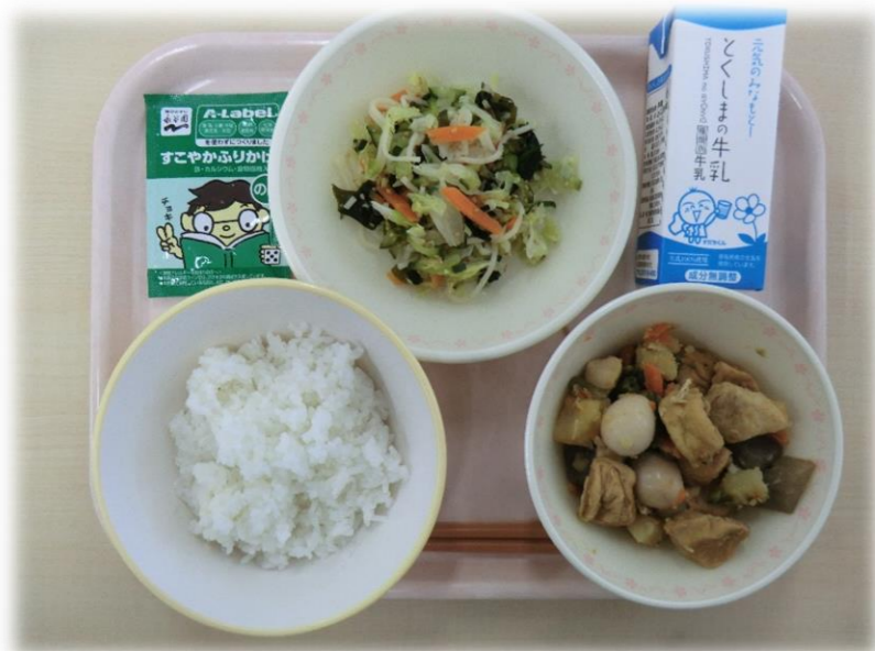
11月6日(月) ごはん うま煮 すだち酢あえ ふいかけ 牛乳