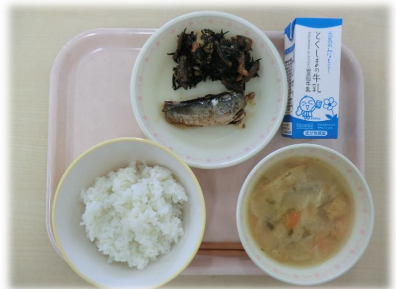
11月9日(木) ごはん いわしの梅煮 牛乳 さつまいもの磯煮 だいこんのみそ汁