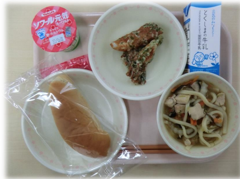
11月7日(火) 小型黒糖パン 五目うどん ちくわの磯部揚げ ヨーグルト 牛乳