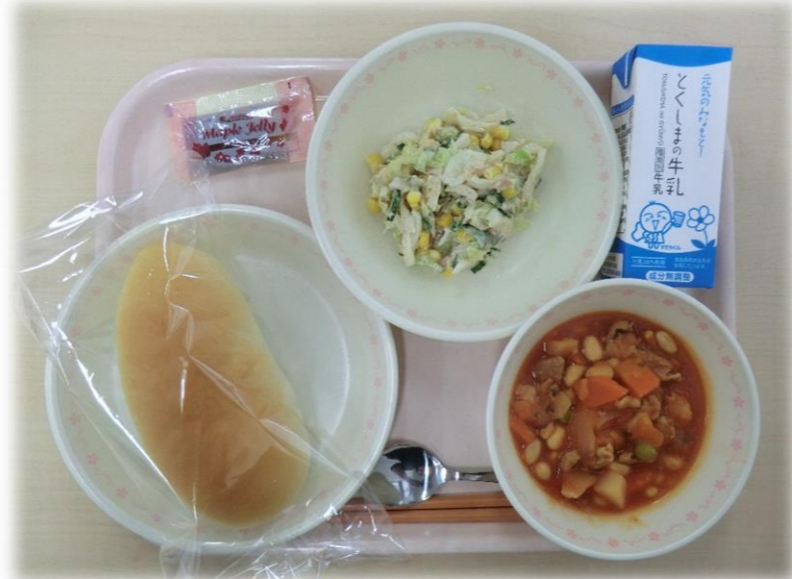
11月10日(金) コッパン ポークビーンズ 牛乳 だいこんとツナのサラダ メープルジャム