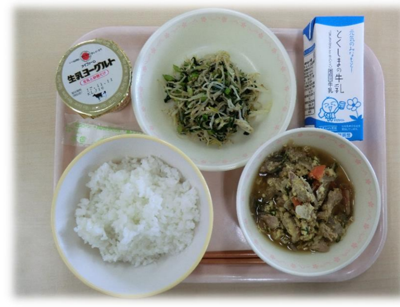
10月25日(水) 他人丼 小松菜のちいめんあえ ヨーグルト 牛乳