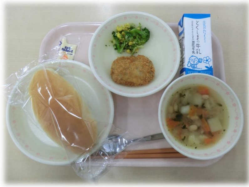
10月24日(火) コッパン 豆入りコンソメスープ たちうおのフライ フロッキーサラダ タルタルソース 牛乳