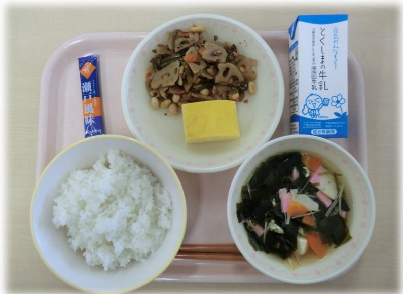
10月26日(木) ごはん 厚焼き玉子 五目きんぴら 具だくさん汁 ぶりかけ 牛乳