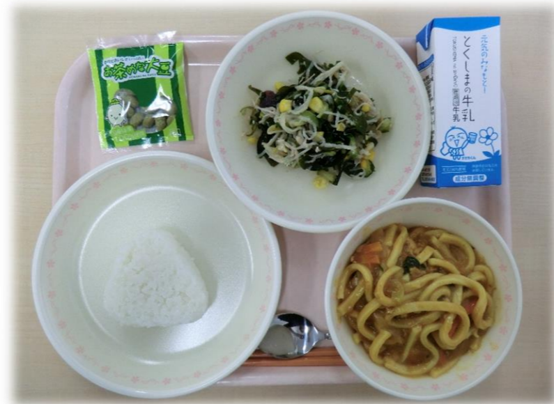
10月27日(金) おにぎり カレーうどん 海そうサラダ お茶めな大豆 牛乳