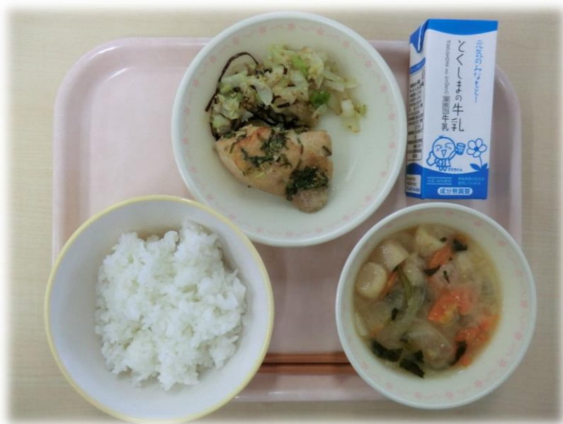
10月23日(月) ごはん ぶのみそ汁 鶏肉の香味焼き 昆布あえ 牛乳